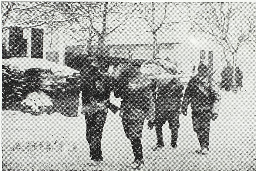
Борци носе рањеног друга