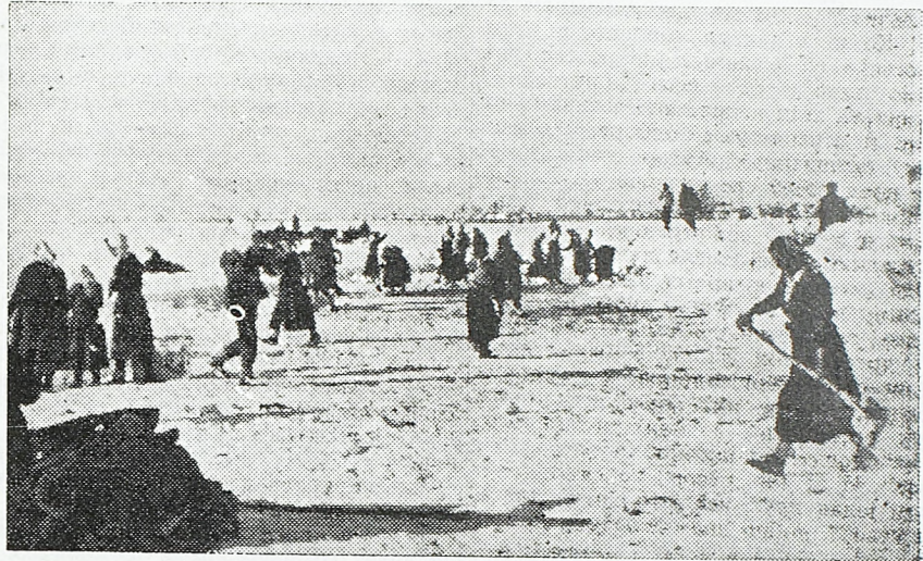
Омладина Босанске Крајине чисти један аеродром од снега