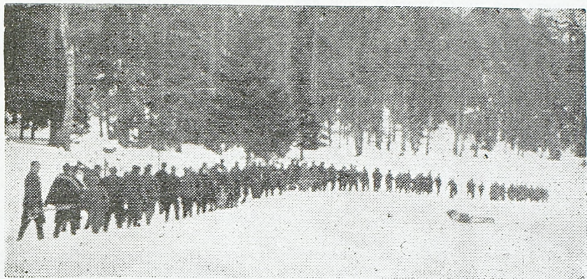
Ужичка бригада полази на Тару

Као једна од најбољих радних петорки показала се прва петорка друге рачанске чете на челу са Лазаром Камберовићем.