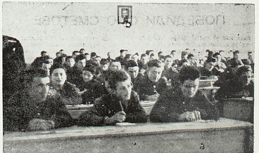
Заједнички час у Војној академији