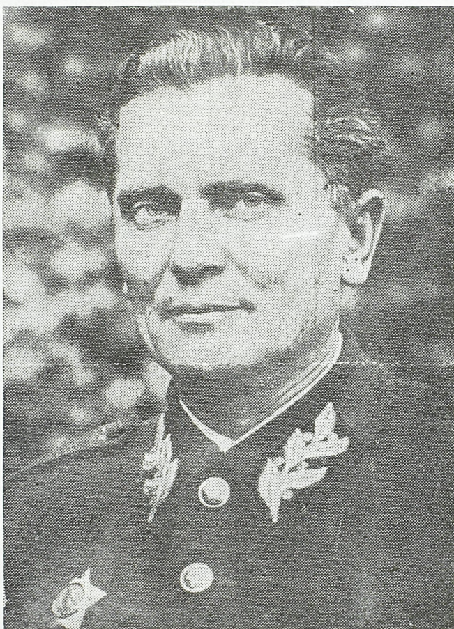
МАРШАЛ ТИТО претседник Јединствене народне владе и министар народне одбране

У стварању јединствене владе наша омладина види победу своје дугогодишње борбе против фашизма и отворен пут за слободан развој младе генерације у демократској федеративној Југославији.