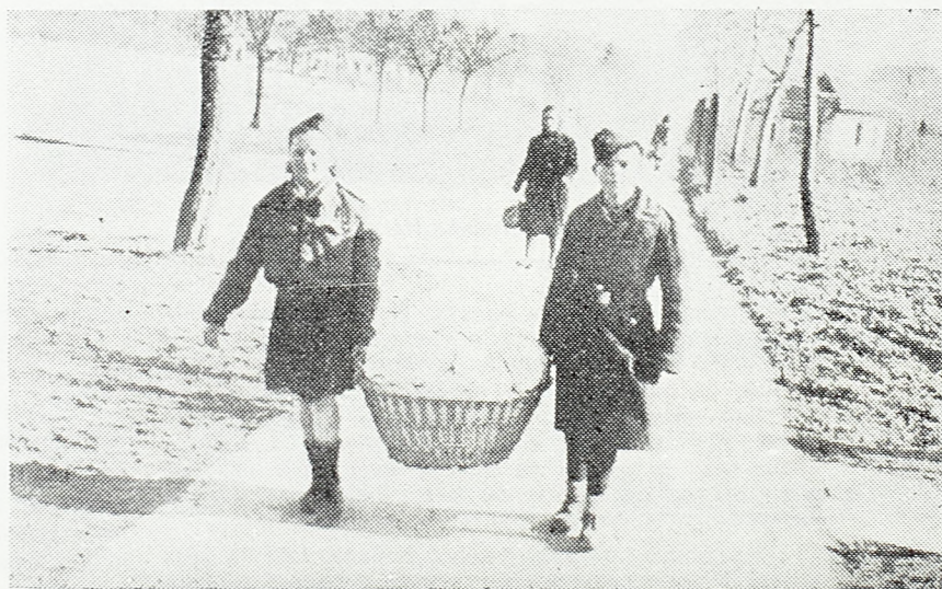
Пионери носе пакете рањеницима

Пионери села: Јасике, Кукљина, Срње и Беле Воде из крушевачког округа на апел за помоћ нашим рањеницима одмах су почели сакупљање. Досада је сакупљено доста намирница и новца. У количини прикупљених намирница највише су се истакли пионери села Кукљина и села Срње, који су, иако је село врло сиромашно, успели да својим трудом прикупе приличну количину намирница за наше рањене борце.