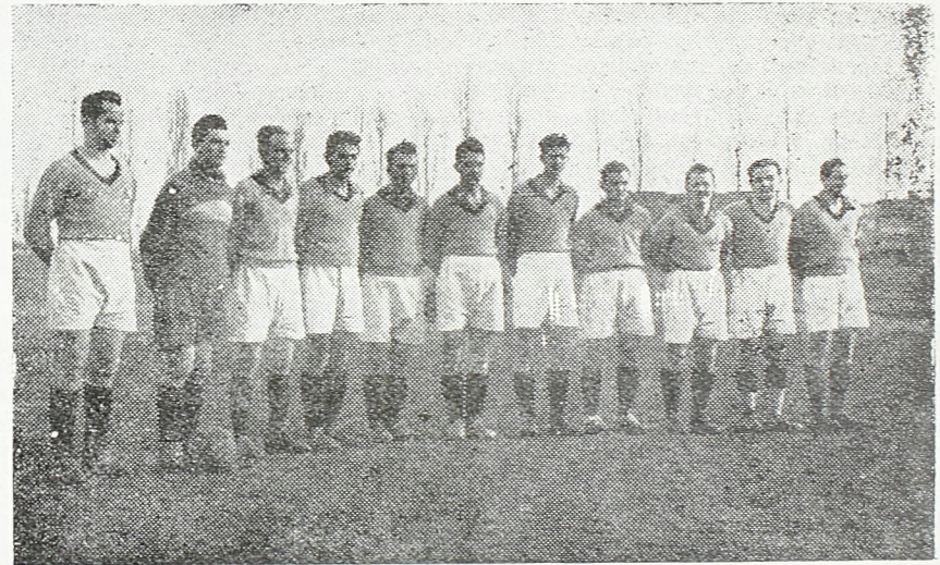
Фудбалска екипа „Црвене звезде“