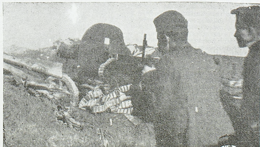
Наш митраљез у дејству

На сремском фронту нису забележене веће борбене акције. Наша авијација дејствује са великим успехом против непријатељских комуникација у позадини. Сам 8 марта, на пример, уништено је њеним дејством 35 аутомобила, 30 кола са људством и материјалом, изазвано више пожара и експлозија и побијено преко 100 непријатељских војника. Јужно од Саве, у троуглу Брчко—Јања—Бјелјина, непријатељ узалудно покушава да поправи своје положаје продирући према југу.