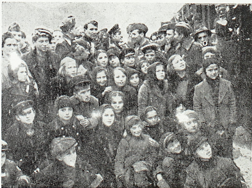
Са дочека наше деце у Бугарској

Зато данас за нас, словенске земље и Словене, нису важне разлике у мишљењу, разлике у политичком уређењу. За нас је важно само, да словенске земље имају слободу и да могу слободно, несметано да се боре против немачког завојевача и да се несметано у будућности развијају.