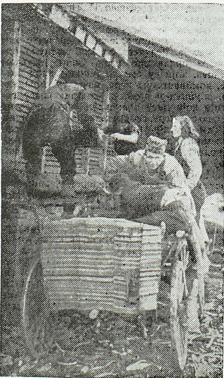
Кукуруз се убацује у чардаке

Окружна омладинска културна екипа округа ваљевског, која је до сада показала велике успехе на културном пољу, искористила је кратак одмор после повратка из Обреновца, да би, до сада запуштен, простор око „Дома културе“ у Ваљеву обрадила и претворила у корисну и плодну башту. Певачи, рецитатори, глумци, свирачи и сви остали чланови прихватили су се вредно ашова и настало је утркивање у риљању, све уз другарски смех и шалу. Није им било тешко нити су се стидели тог рада. На простору од око 500 кв. мет. биће засађено разно поврће.