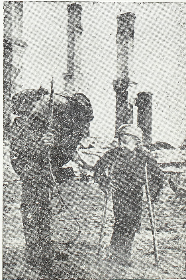
Црвеноармејац разговара са дететом, коме су ноге промрзале под окупацијом