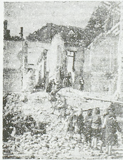
У Чачку неће остати ни једне рувевине