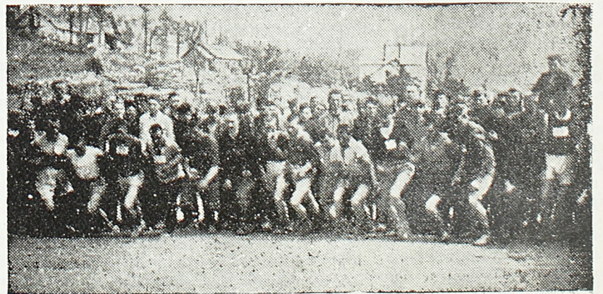
Са омладинског такмичења на Црном Врху

У првом полувремену Обреновчани су били надмоћни. Играла су повезано и лепо, и то им доноси вођство. Они у друго полувреме започињу истим еланом и већ у првом минуту повишују резултат на 4:2. Међутим, средином полувремену Београђани се сређују и снажно наваљују. Цео тим је препорођен. Навале се нижу једна за другом, и до краја игре они су надмоћни. То и доноси пет голова за двадесет минута.