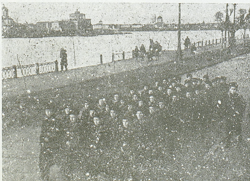
Питомци Суворовљеве војне школе у Совјетском Савезу

Загреб претставља у овом тренутку најважније непријатељско упориште у нашој земљи, које ће он настојати да по сваку цену брани. Међутим, већ досадашњи успеси наших трупа, ликвидирање босанског ратишта, ослобођење чи-