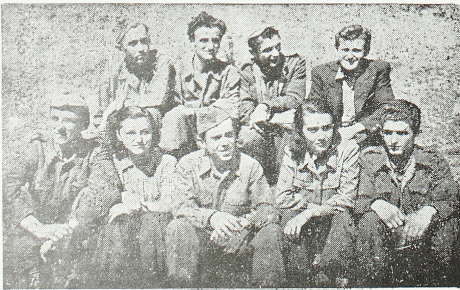
Секретаријат БРАШ-а (албанске антифашистичке омладинске организације)