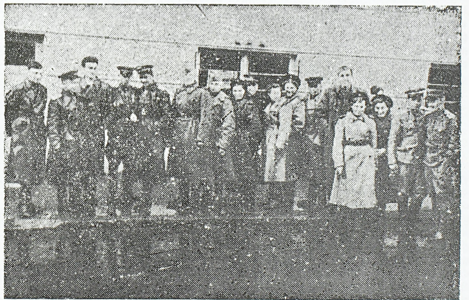
Делегација Комсомола ваздухопловне дивизије Трећег украјинског фронта

— Када се вратимо у отаџбину, ми ћемо причати нашој омладини о херојској борби омладине Југославије.