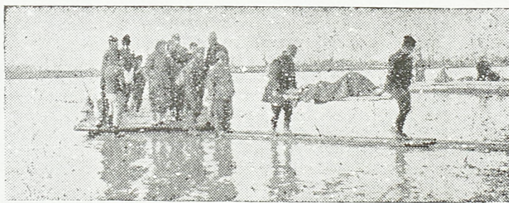
Из Источне Босне: преношење рањеника преко Дрише