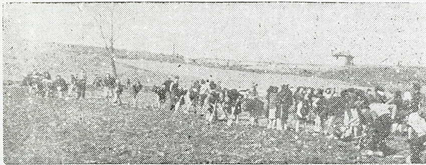
Радна бригада »Веца Корчагин« из Крушевца на раду

У Далмацији има доста рањеника, који се опорављају по повратку из италијанских болница. За време Светске омладинске недеље омладина је одвајала од својих уста и носила понуде рањеницима да и они осете радост »Недеље пролећне офанзиве«. Један Србијанац, рањеник на Хвару каже: »Било ми је тешко да примим те дарове, јер знам да они који их донесу морају да гладују. Нема народ опде да једе као код нас у Србији«. На острву Хвару се налази приличан број рањеника из српских јединица. Они немају довољно речи да нам похвале добар поступак и негу коју им указују браћа Хрвати.