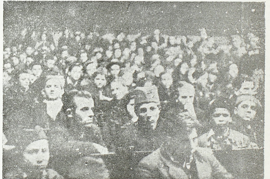
Радничка омладина и шегрти на конференцији

ноберзијанаца и удео радничке омладине у помоћи народној власти у спровођењу уредбе и завршио: »Да бисмо се ми сви могли са успехом борити за спровођење ових мера, ми се морамо другови окупити око синдиката који ће нам као наша радничка класна организација помоћи да спроведемо све ово у дело.«