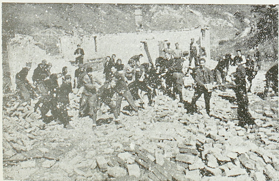
Омладина Рашке рашићшава цигле за изградњу новог биоскопа

У руднику је отпочело такмичење пред 1 мај. Одржане су конференције на којима су постављени задаци, образоване групе које ће се међусобно такмичити и расправљано је о могућностима повећања производње. Омладина је решена да у такмичењу пред Први мај премаше резултате које је постигла у Светској омладинској недељи.