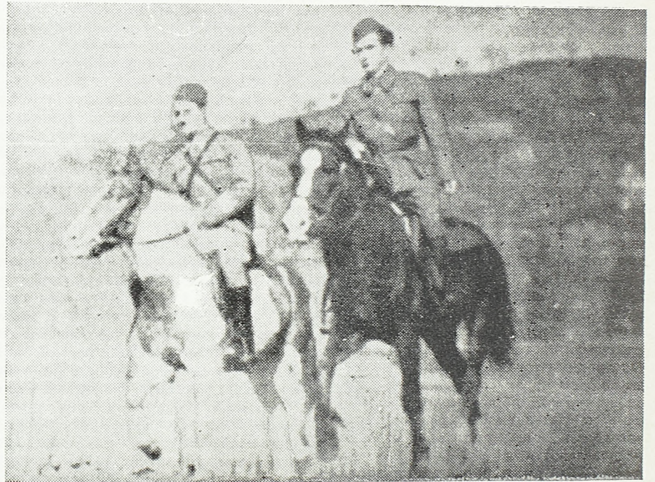
Народни хероји Лола Рибар и Милоје Милојевић

Народ из села дуж Гламочког поља жури ка авиону да види свој авион на свом пољу. Окружени децом која разгледају авион ми убацујемо ствари и опраштамо се са друговима који остају. Улазимо један по један у авион. Претпоследњи је Лола. Тада су нам се очи последњи пут среле. Стао сам још једном пред огромни бомбардер посматра-