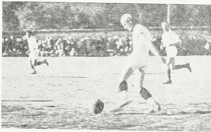
Са фудбалске утакмице у Косовској Митровици

Истога дана Месни УСАОС победио је пинг-понг екипу прокупачке гимназије са 5:2.