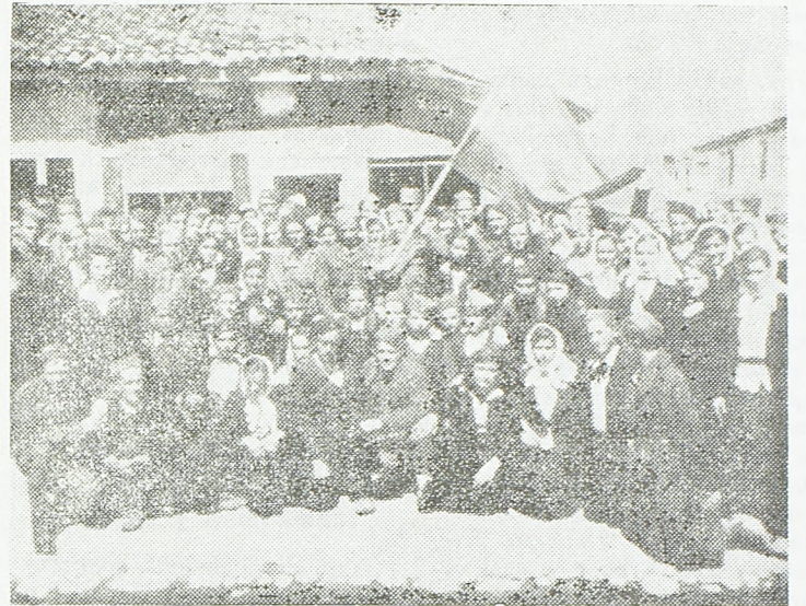
Златарци са прелазном заставом

упорно гонили непријатеља. Омладина је радила, на 300—500 метара од непријатељских линија жела жито, преносила га на својим рукама и снабдевала своје борце. А кад је крај сасвим очишћен од непријатеља она је прегла да га подигне, обнови и засеје. Зимус, када је требало преносити жито на леђима за