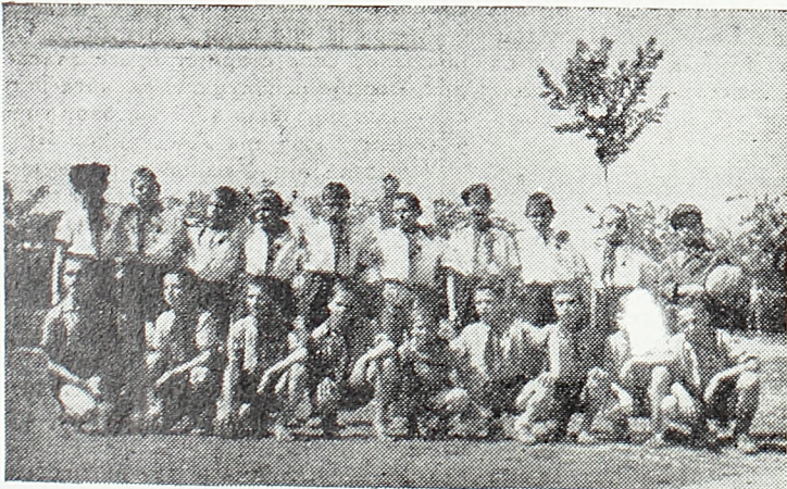
Пионери бригаде «Миладин Поповић» из Призрена

Истог вечера, у оквиру припрема за слет, пионери су дали своју прву приредбу. Пре почетка приредбе у граду се осетила велика живост — пионери су је стварали журећи се на своју прву приредбу. На свим лицима се огледала радост. Програм је био обилан. Смењивале су се једна за другом српска и шиптарска песма и рецитација — пионери су показивали на де-