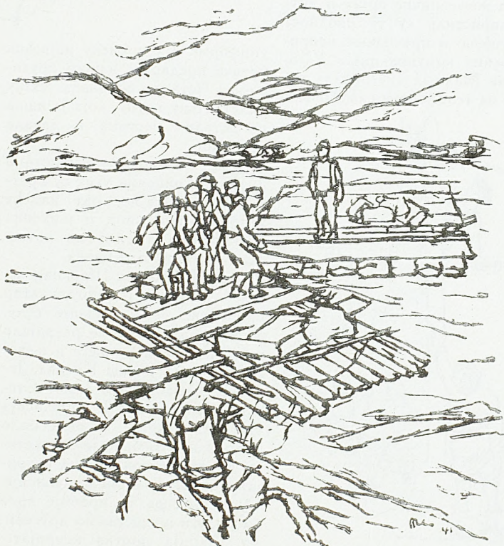
Пиво Караматијевић: На Дрини