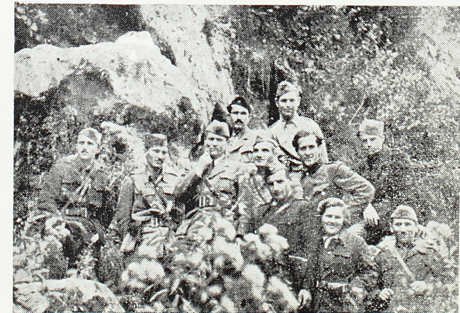
Код Јајца између Треће и Четврте офанзиве