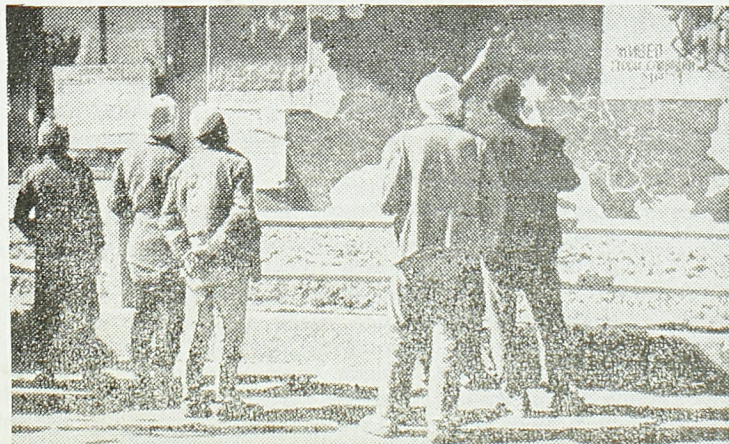
Зидне новине у Косовској Митровици