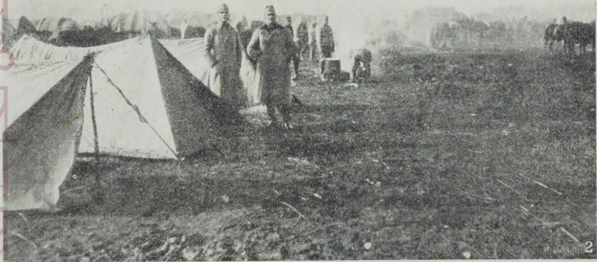
Табор топцијског пука.