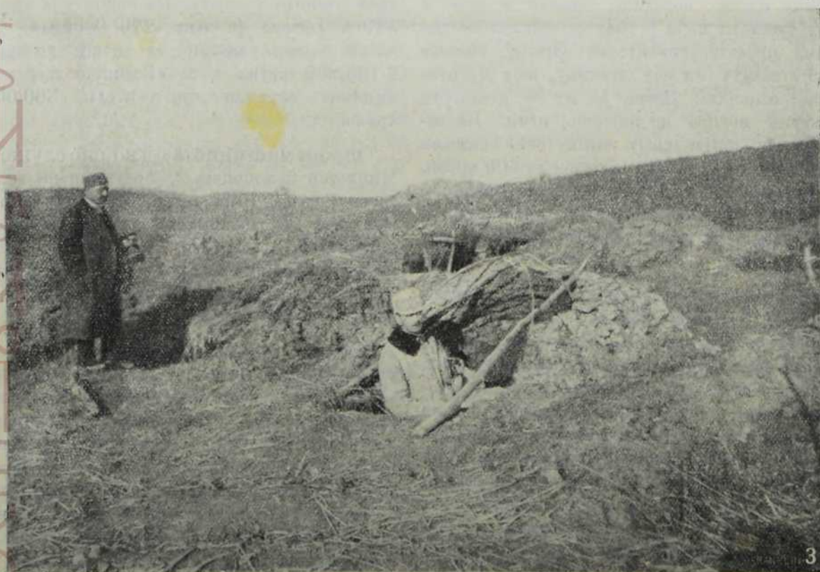
Напуштен стрељачки ров.