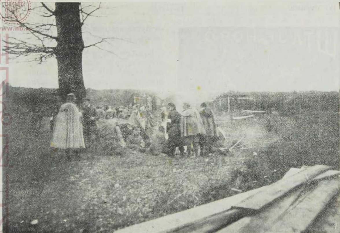
Табор око земуница.