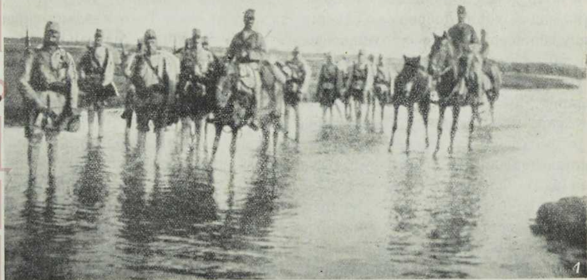
По каљвном ровту.