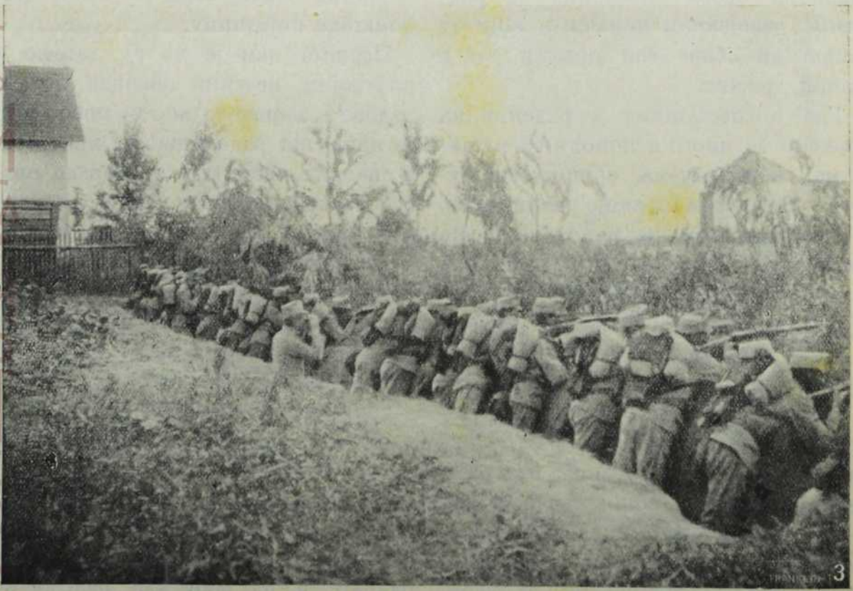
У стрељачком путу.