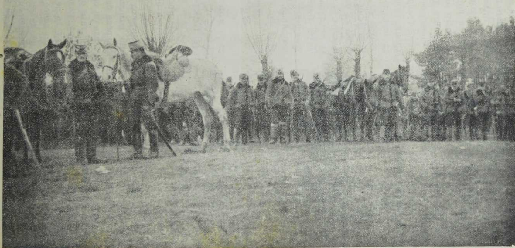
Мађарски хусари иза стрељачке дивизије у Руској Пољској.