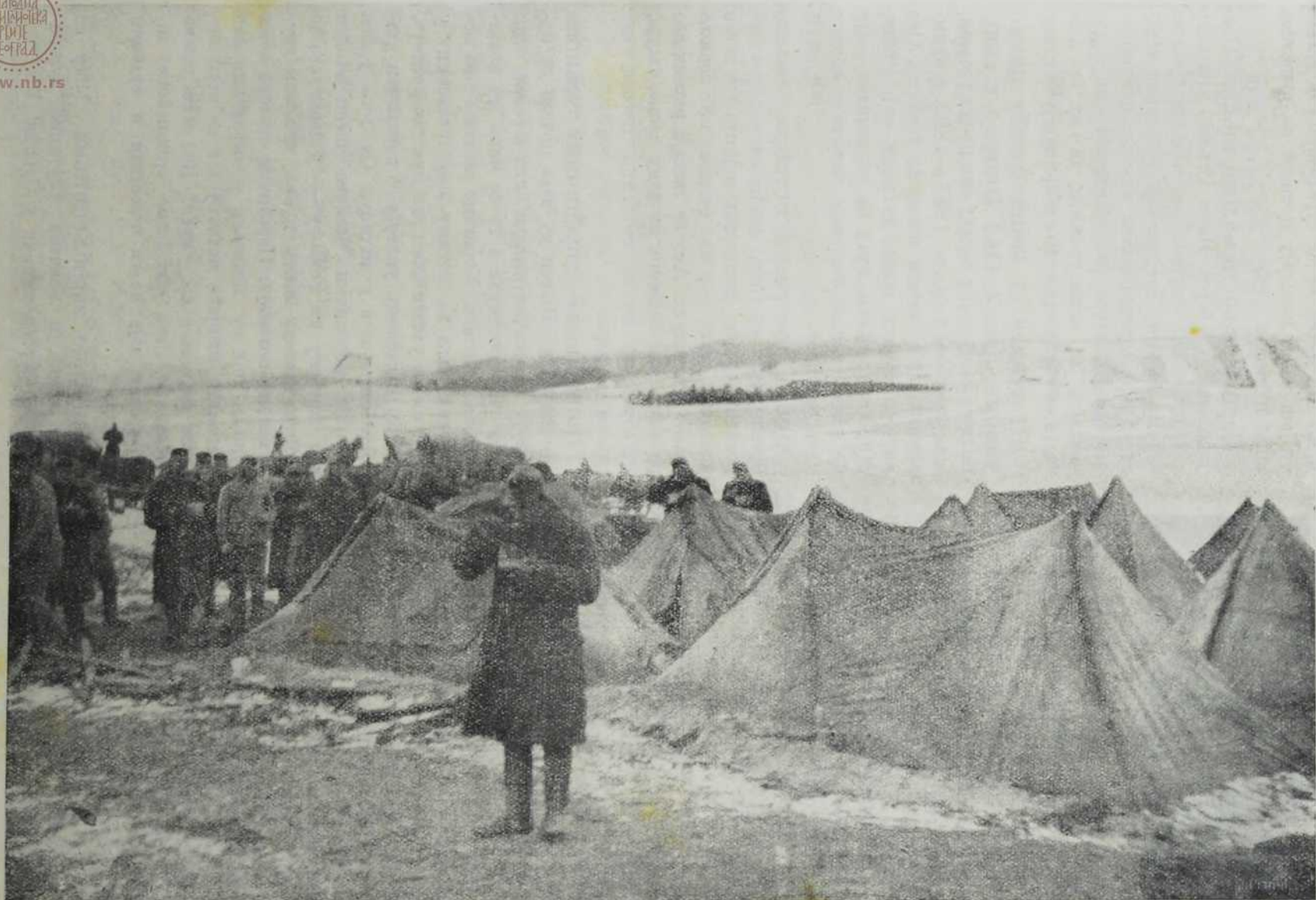
Шатори испред пољско-руског села Квасњова.