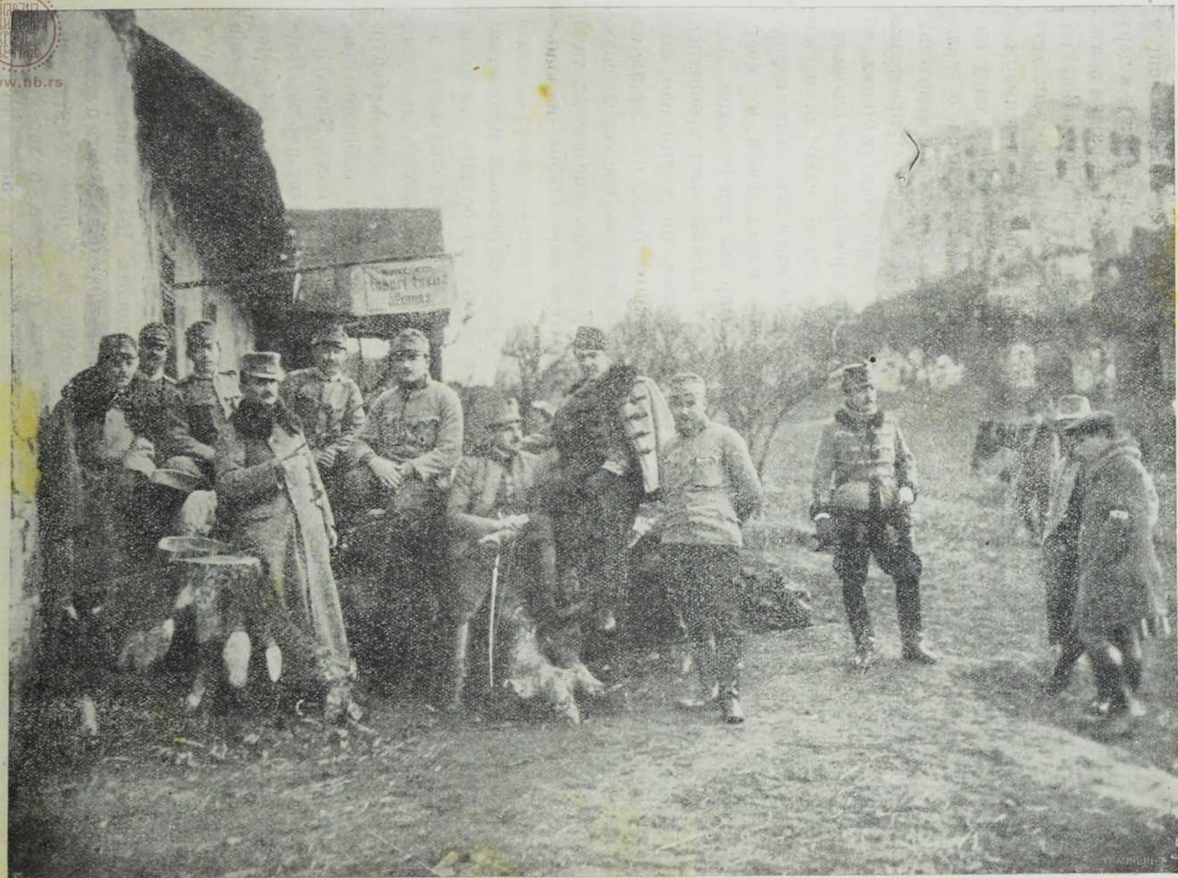
Заповедници мађарског усташког пука у Руској Пољској.