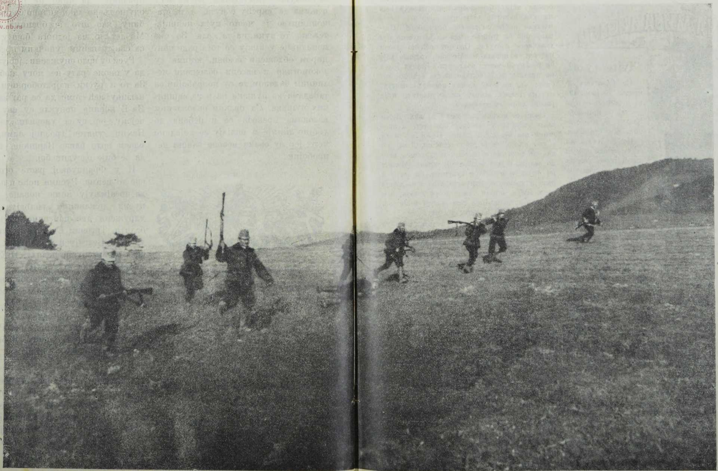
Јуриш домобранских хуџара пешице, са кундацима.