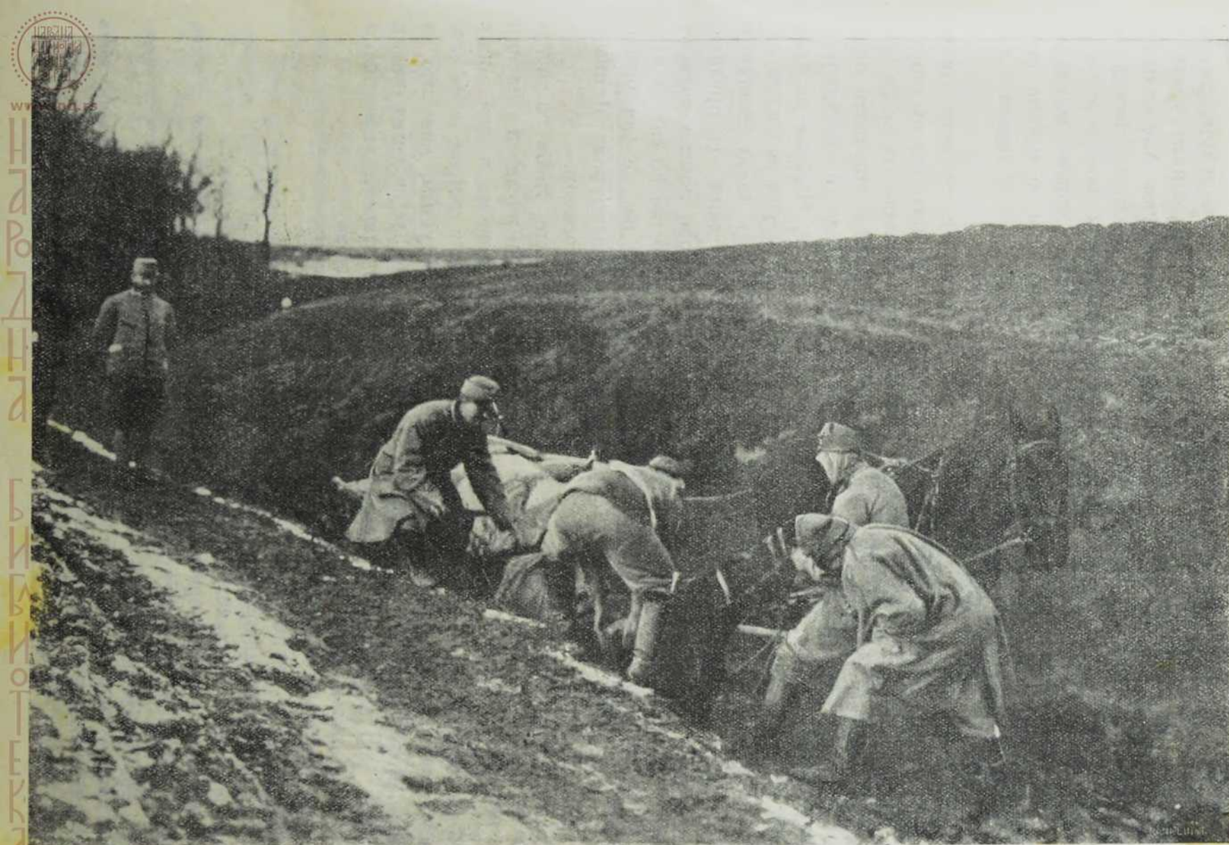
Са севернога ратишта: У мору галичкога блата.