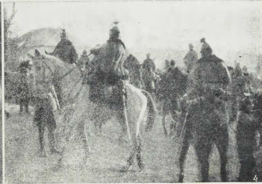
1. Прекрхано руско оружје. — 2. Чете у продаву. — 3. Генерални штаб. — 4. Улави.