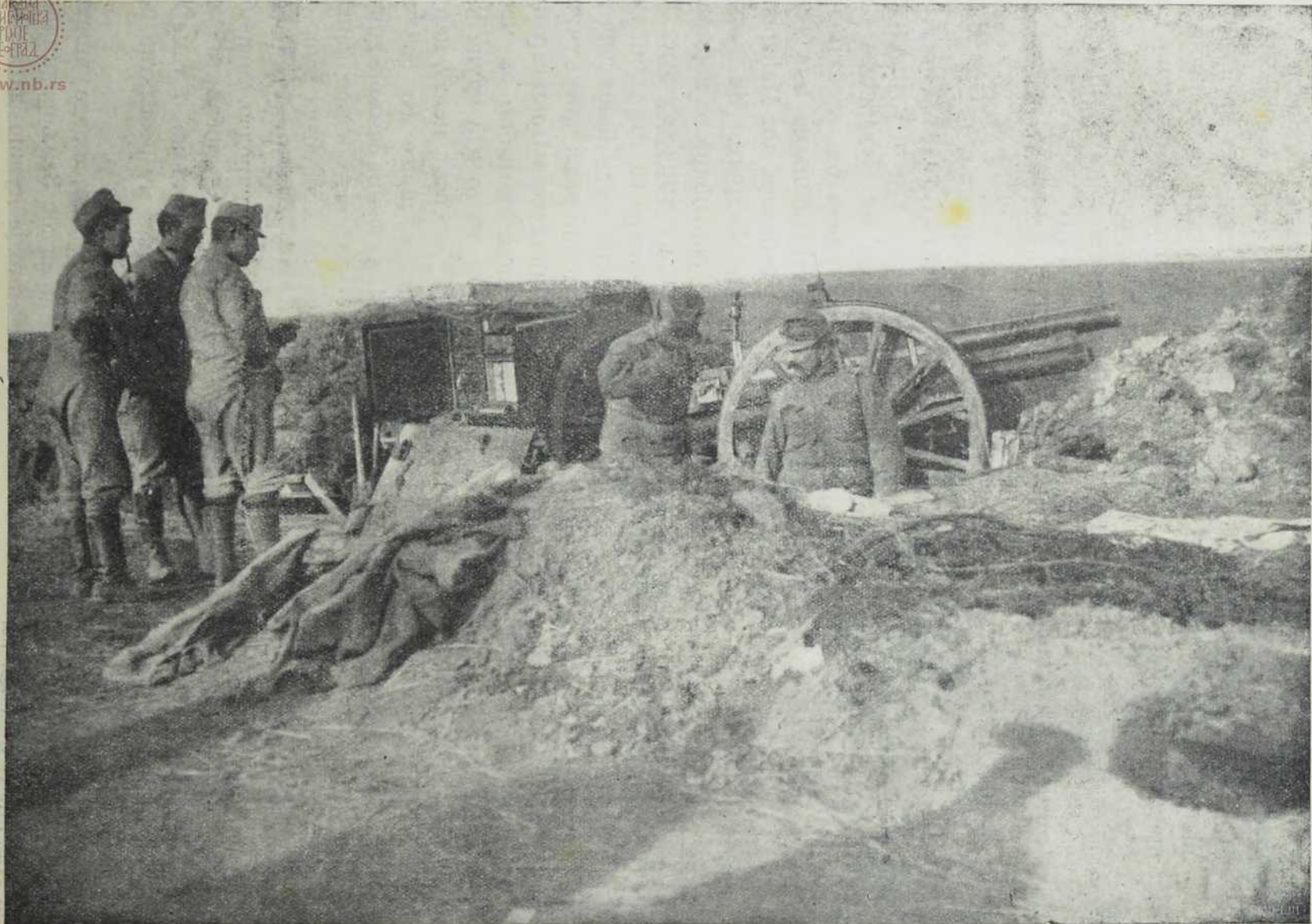
Наше топовије крај реке Пилице.