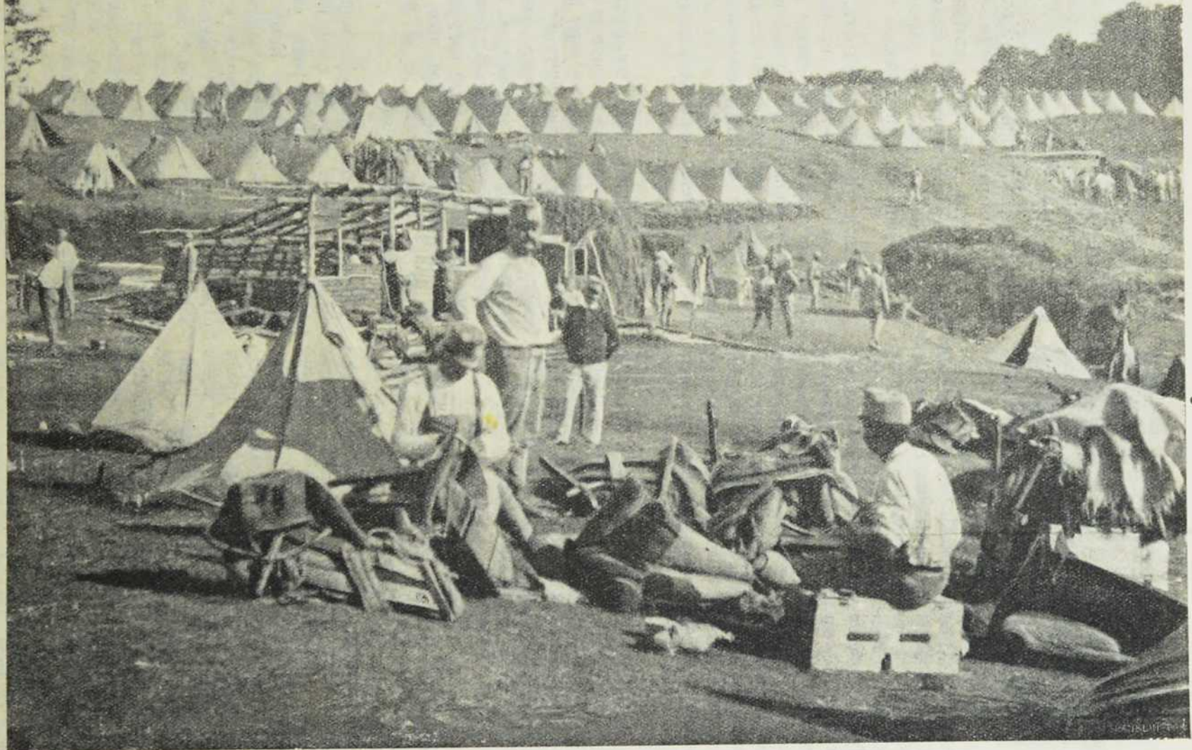
Са севернога ратишта: Рад у шаторишту.