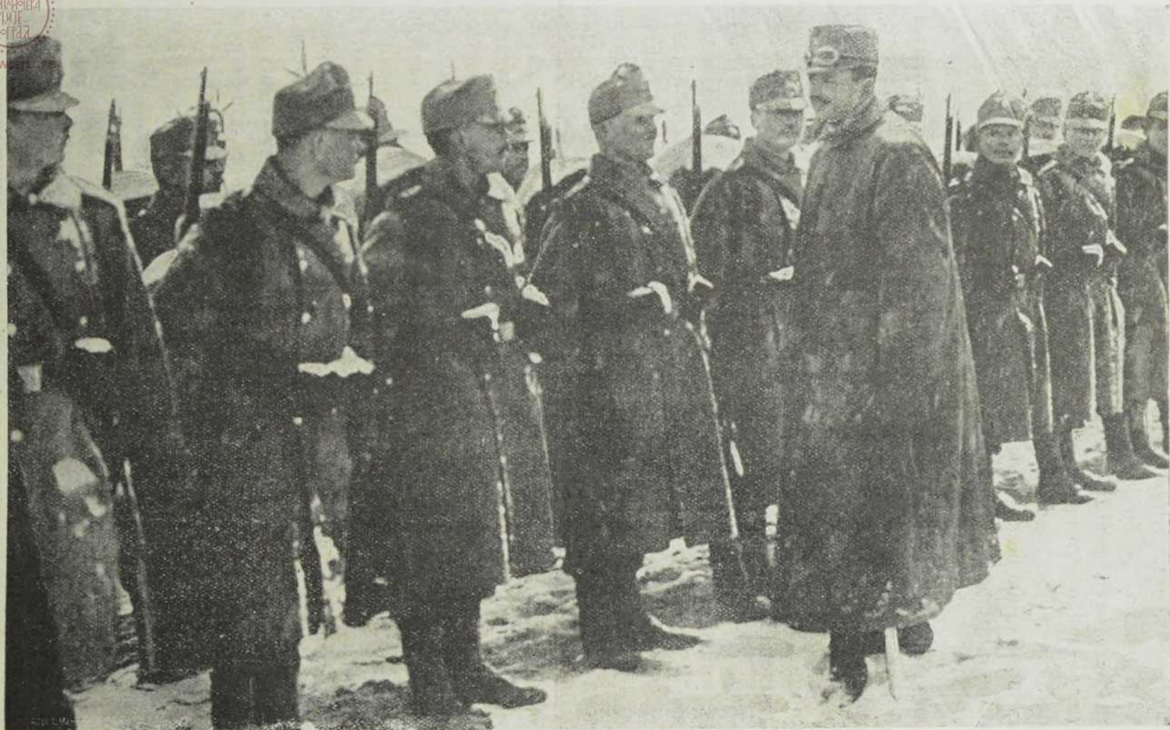
Престолонаследник Карл Франц Јосиф одликује војнике ословљавајући их