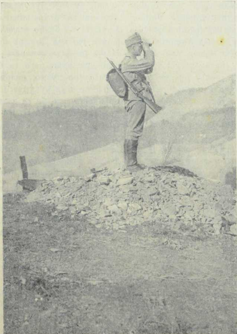
Предстража извиђа непријатеља.

кувају, пеку и пуре кукуруз. Осу- шени кукуруз међу у брашно, а у старој постојбини му, у Америци, месе од кукурузовог брашна хлебац.