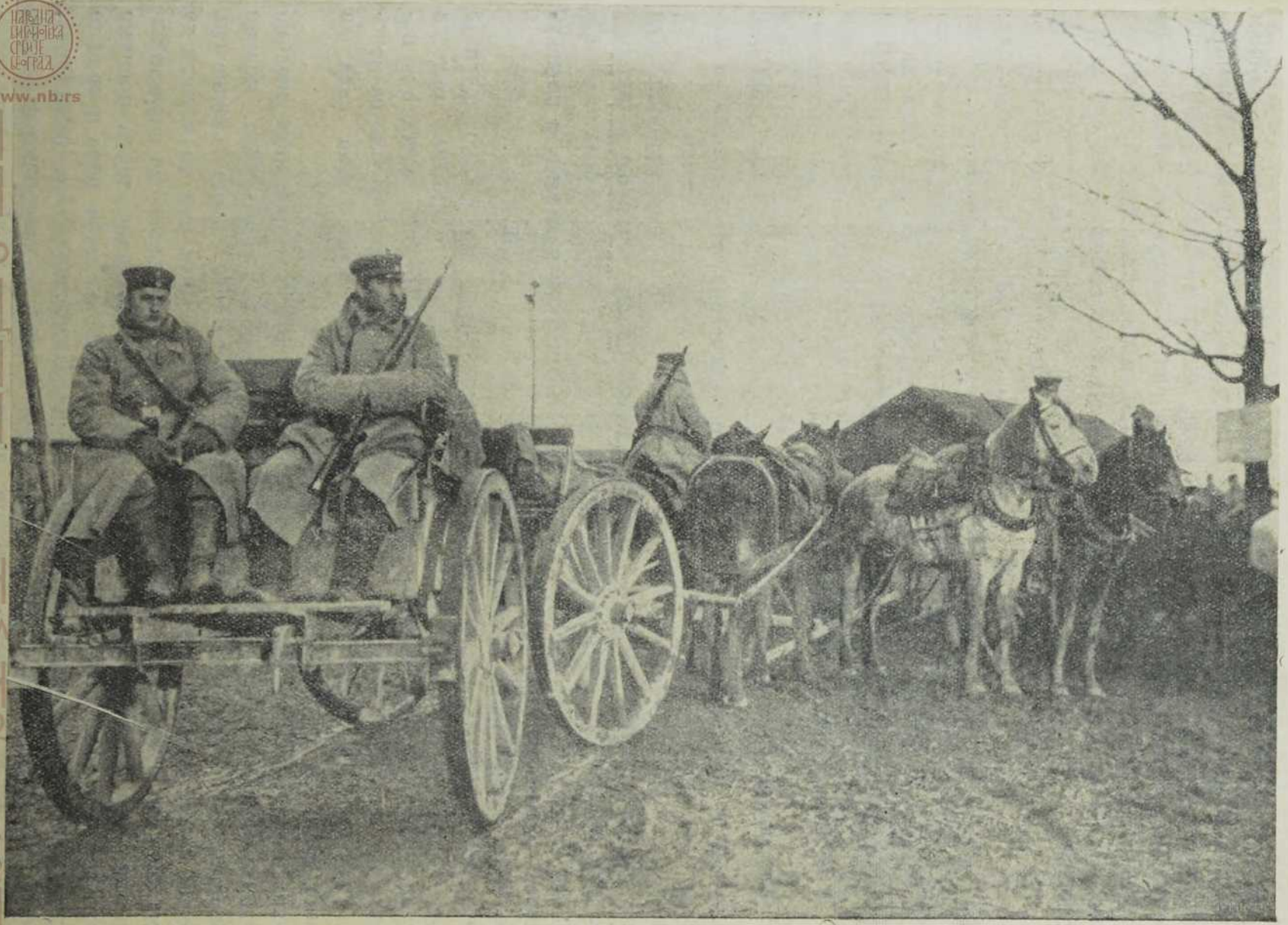
Немачка мунициона кола у Галицији.