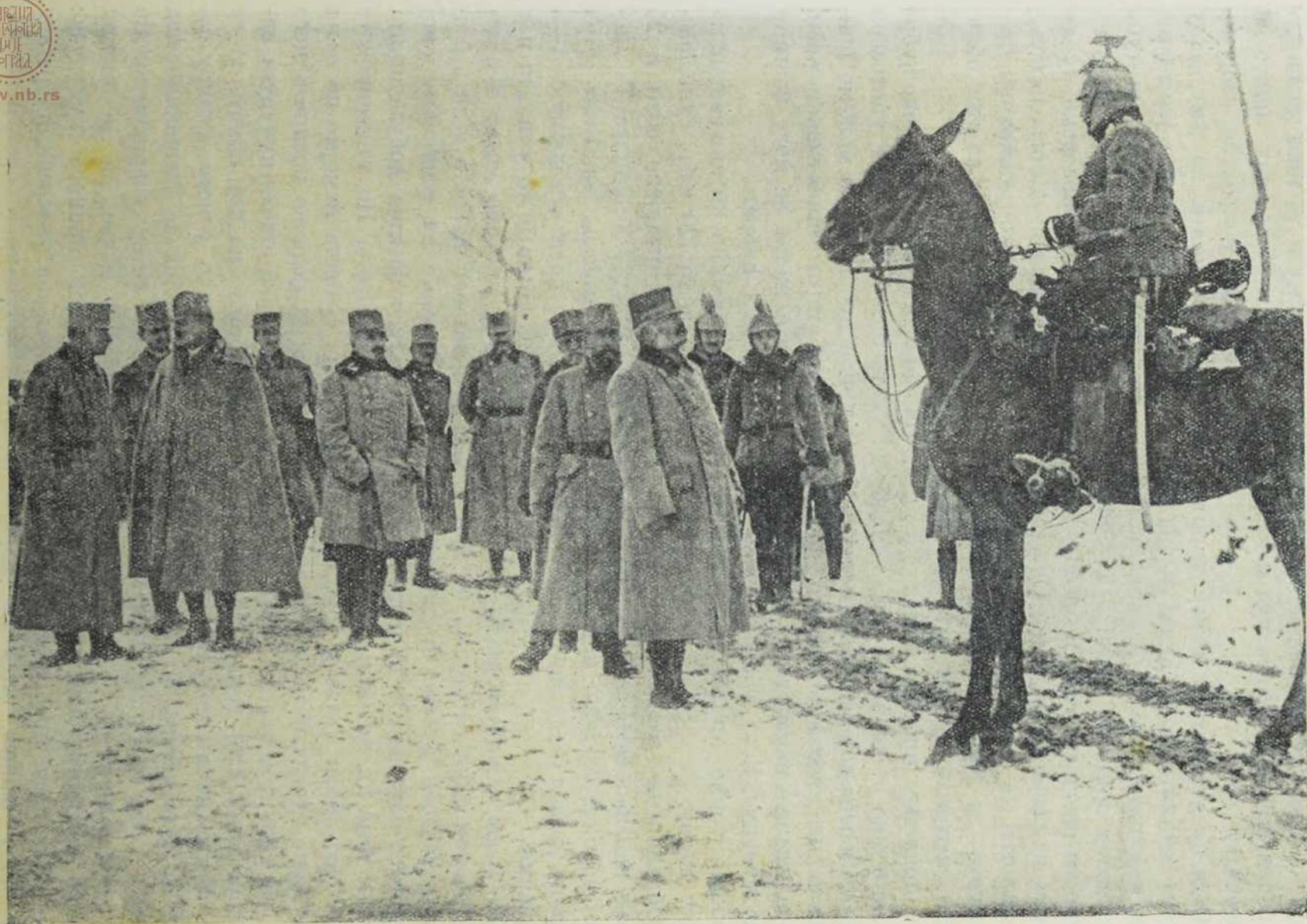
Заповедник уданског пука рапортира врховном надвојводи Фридриху.