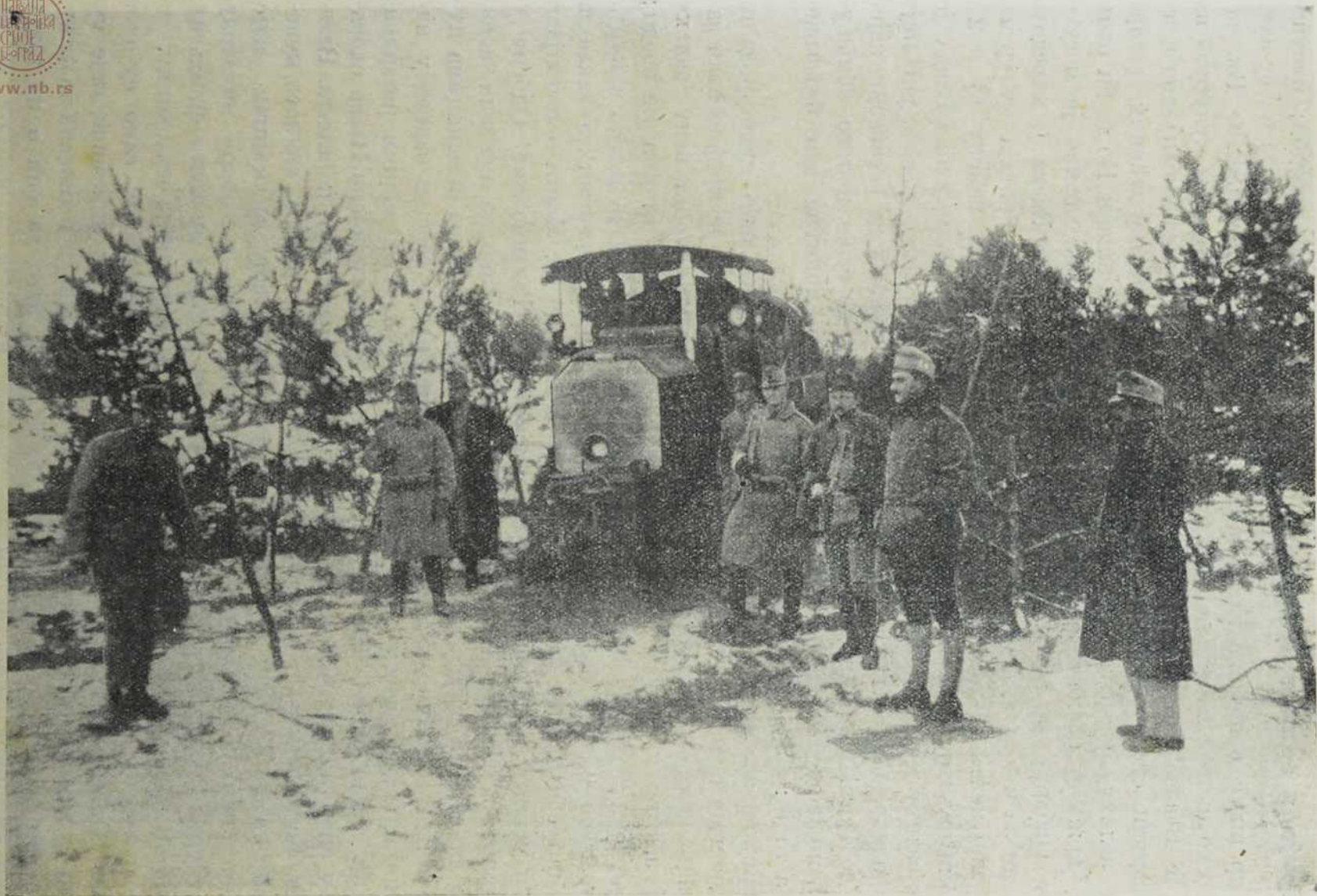
Топовски превозни мотор у заклоништу.