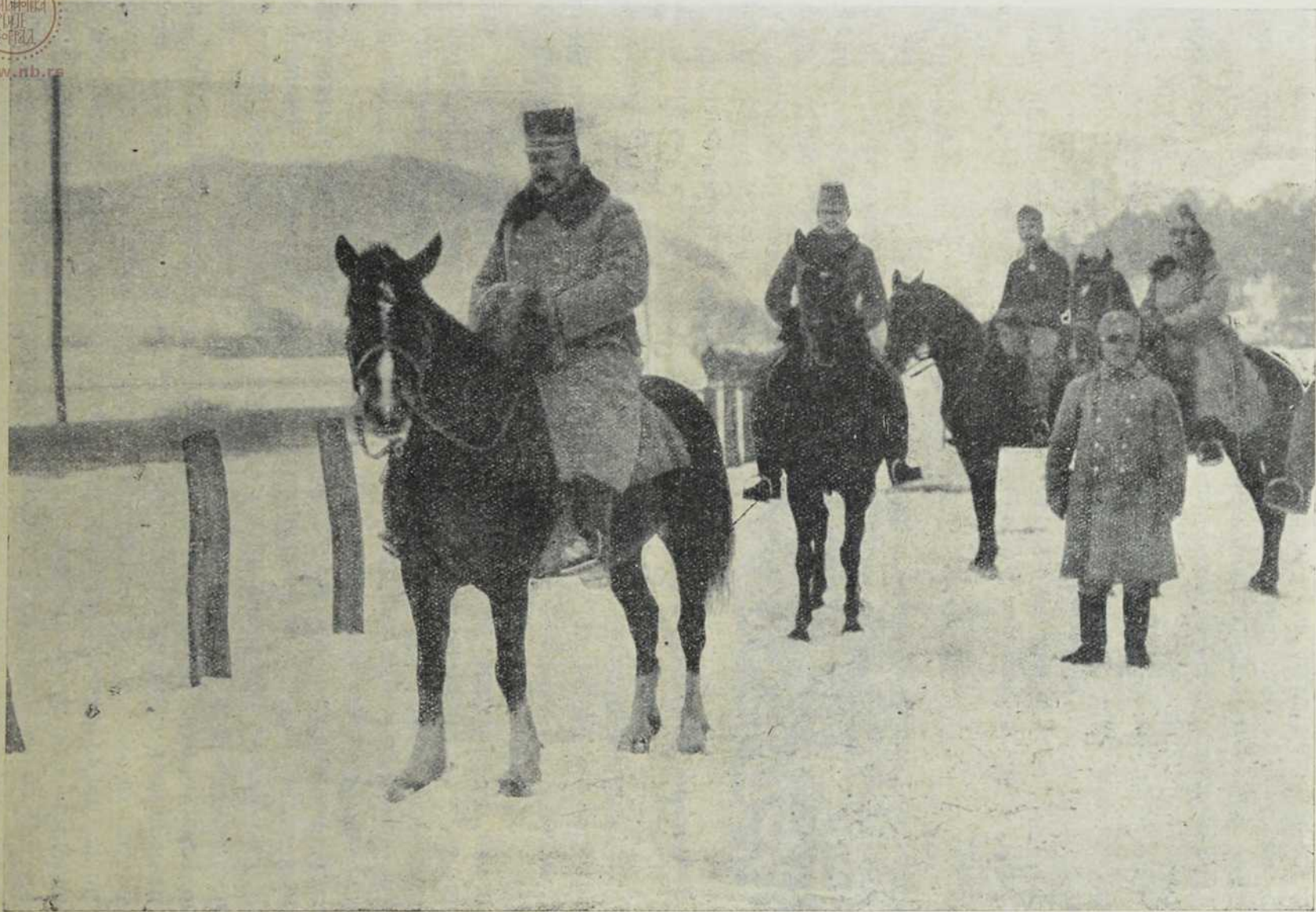
Надвојвода Јосиф на бојишту.