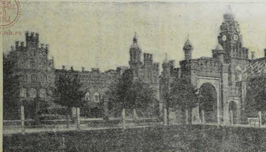
Черновица: Митрополитова палата.