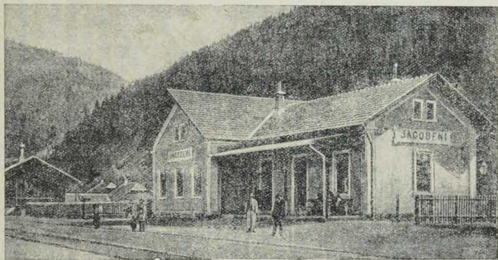
Јакобенска жељезничка станица.