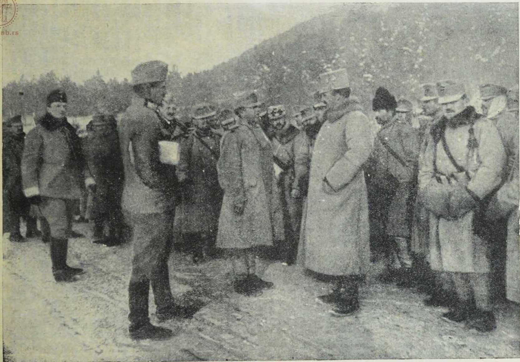
Надвојвода Јосиф разговара са војником, коме је приденуо сребрну медаљу за храброст.