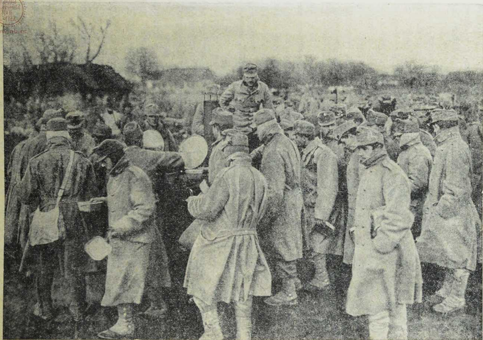
Са севернога бојишта: Делење менаже.