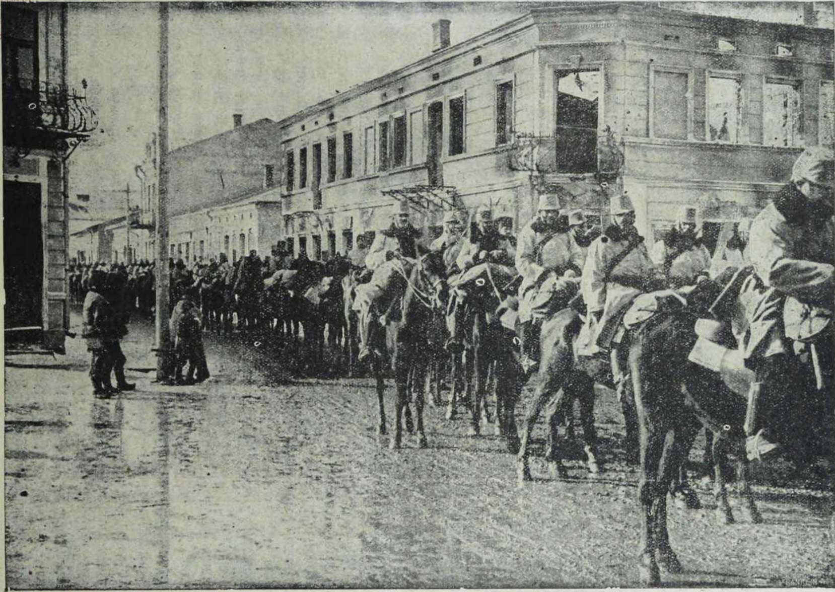
Из буковинских бојева: Хусари језде кроз Делатин.