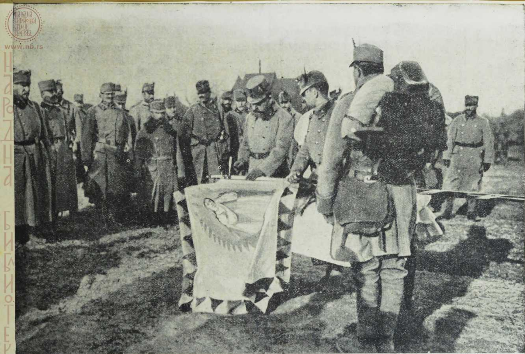
Надвојвода Јосиф Фердинанд укуцава клин у заставу.

2-ги тиролски ловачки пук свети своју од краља поклоњену заставу на бојишту.