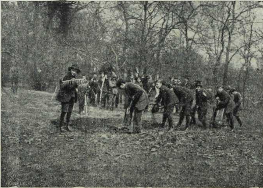
Престонички ђаци раде као баштовани.

Коње своје не дражимо, не шибајмо, не мучимо а не допустимо пикоме да то чини; јер је то не само нечовечно, него и убија коња, те му побија вредност. Коња не гоји зоб, него газдине очи — вели стара наша пословица, те по томе лепо, благо поступање и разумно гајење даје коњу не само снаге, него и ле-