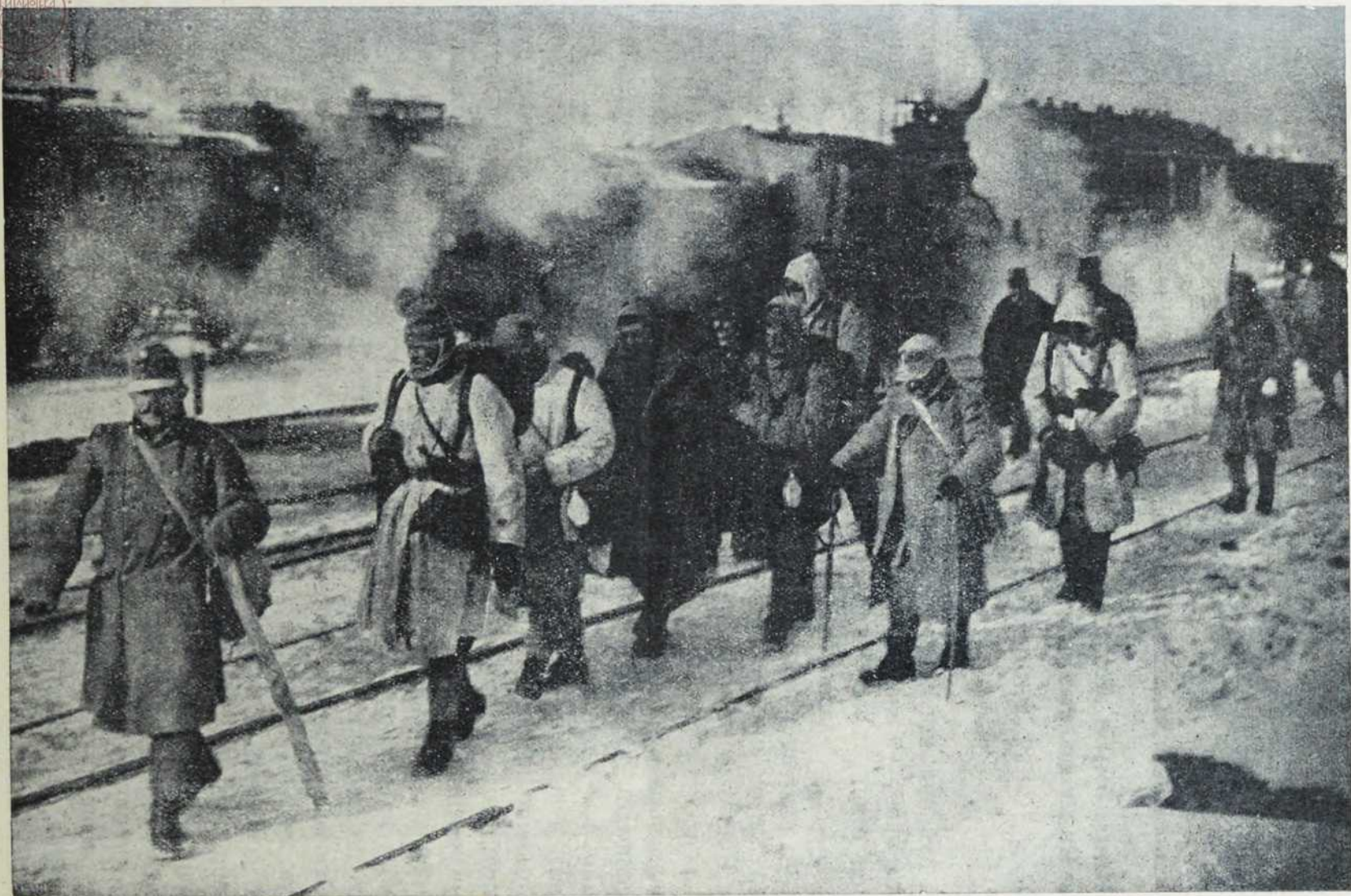
Са севернога ратишта: Рањеници на жељезничкој станици.