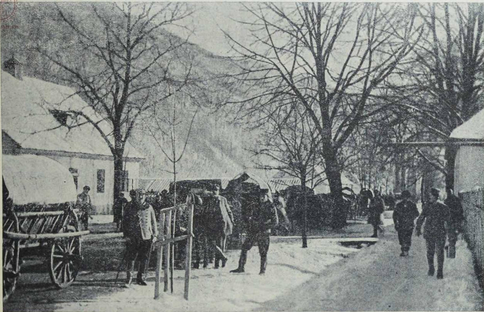
Са севернога ратишта: Припео трен.