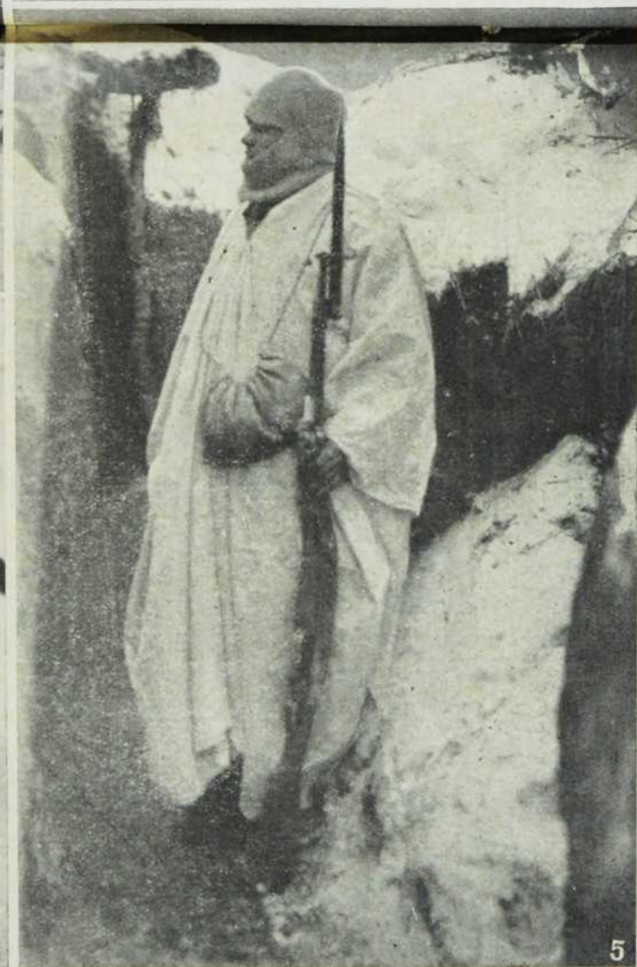
1. Полагање телефонске жице по снегу. — 2. Стан домбранског официра у стрељачком рову. — 3. Мећава. — 4. Сталац машинске пушке у стрељачком рову. — 5. Домбранац на стражи у снежној кабаници.