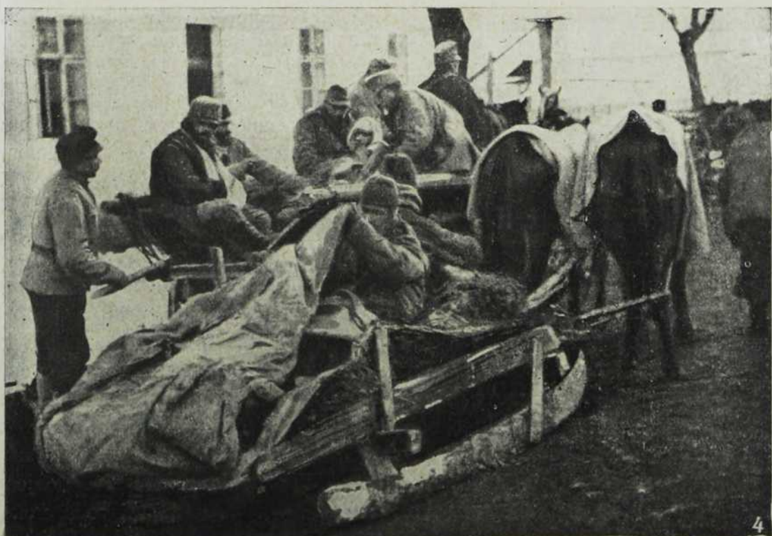
Румунке у Кирлибаби. — Превоз рањеника са соницама у Јакобени.