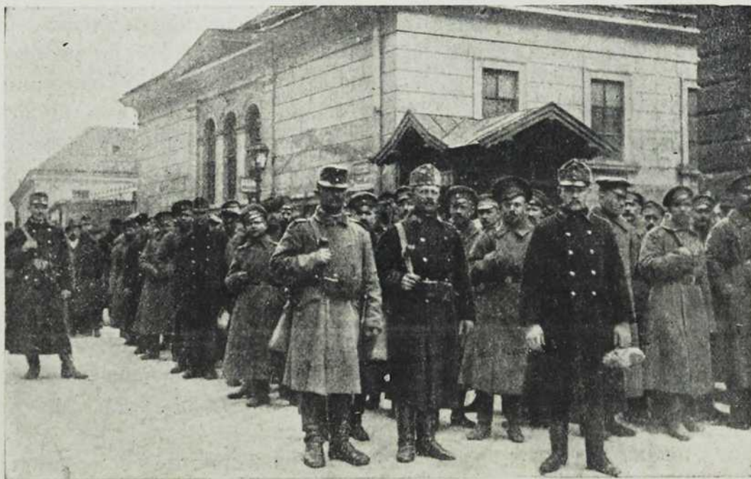
Руски заробљеници у Будапешти.

Ови 1000 милијона круна у злату тешки су 3360 метерцентри.