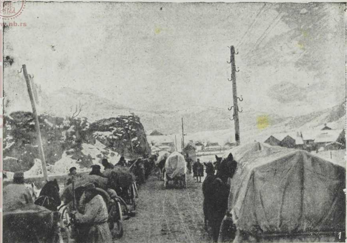
Трен у Кирлибаби са изгледом на Флудорицу.