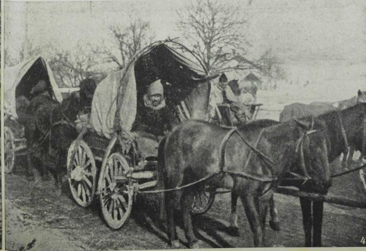
1. Разривен мост у Карпатима. — 2. Артиљеријски трен у снегу. — 3. Стигли су пакети. — 4. Сеоска кола у служби војске.