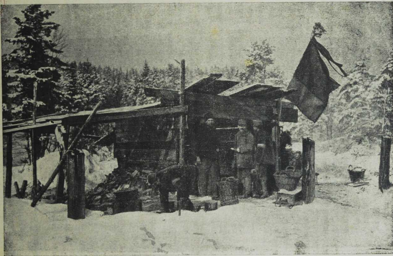
Са северног бојишта: Таборска кујна У шуми, украшена немачком заставом.