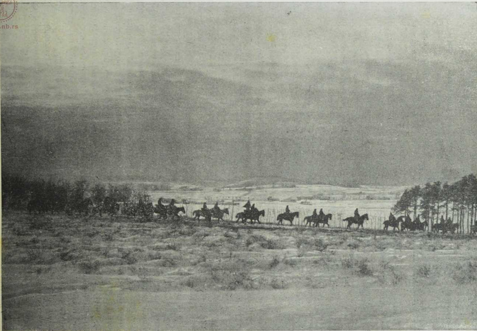
Са севернога ратишта: Улани језде преко поља.