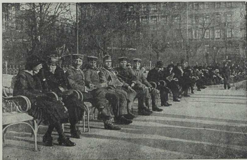
Будапешта: Наши и немачки рањеници сунчају се.

Не захваљује; само ме гледа плашљиво и узверено. Неки дечко који пролази путем, стаде, исприча се важно те ће рећи: