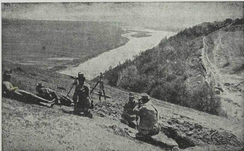
Извиђавају непријатељски положај.

најлепше главице салате. Када семе sazре, ваља га или дневно сабирати или дочекати да највећи део семена sazре и онда сасецимо цветна стабла, осушимо их и овршимо их. Семе и после четврте године још добро клија. У једноме килограму имаде око 750 хиљада зрна.