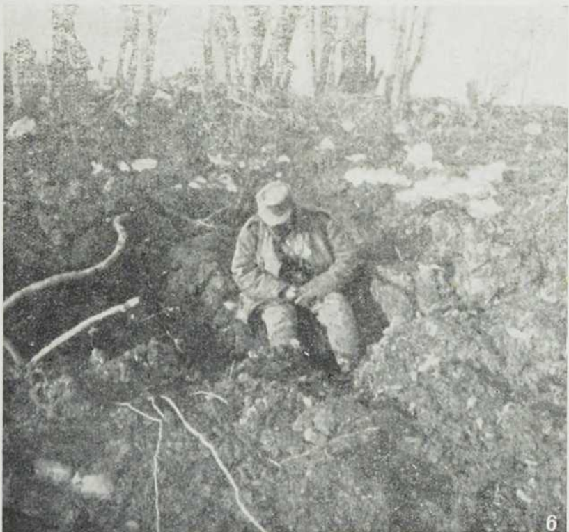
1. На подножју Карпата. — 2. На одмору. — 3. За време менаже. — 4. Дошао један Рус да се преда. 5. Тежак пут по благу. — 6. Руна гранатом разривена.