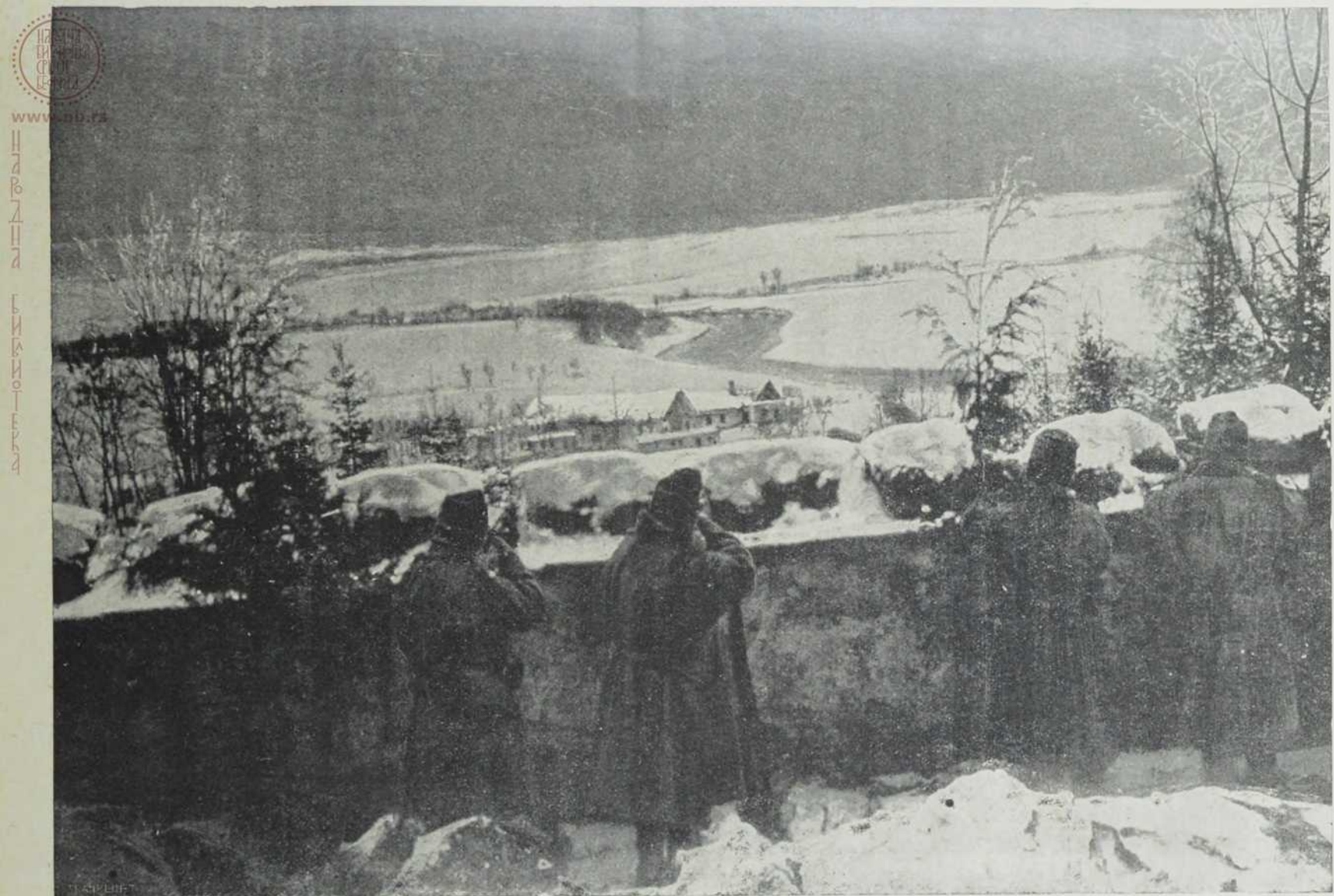
Са ратишта у Руској-Пољској: Изглед са наших положаја преко Ниде на руске подстаје.