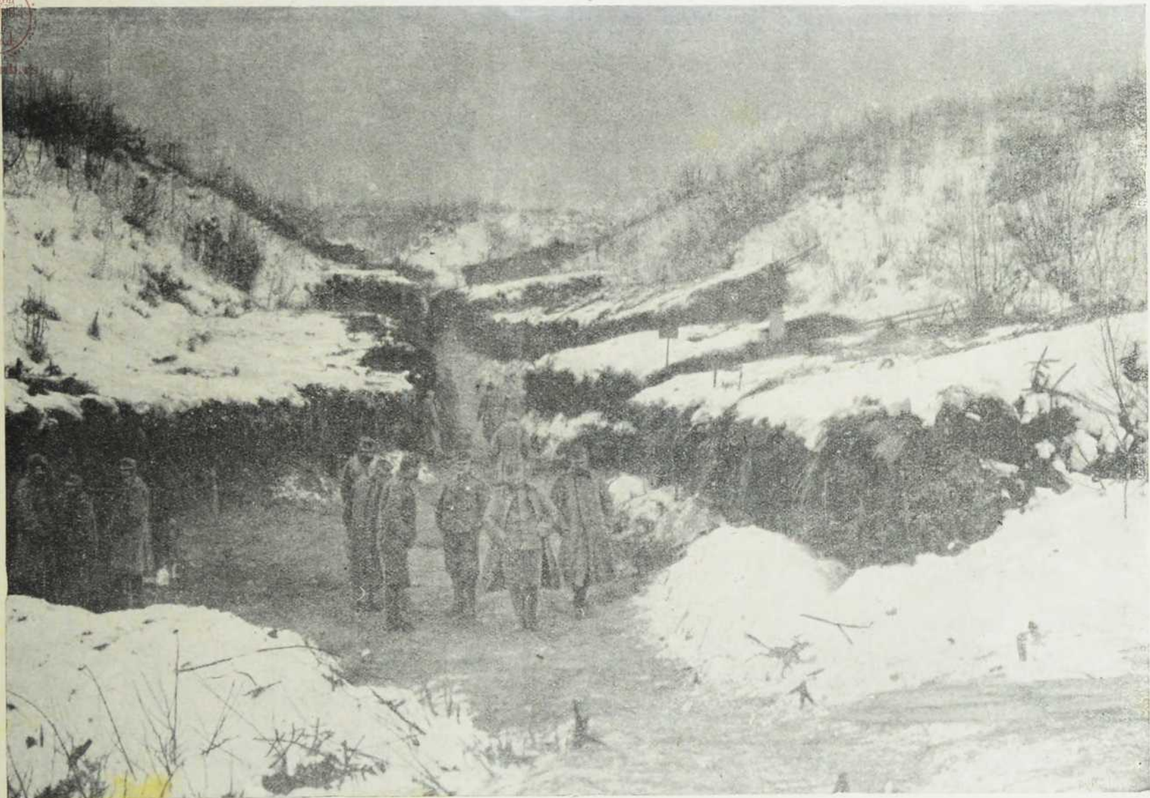
Са севернога ратишта: «Тиролско село» крај Дунајеца.