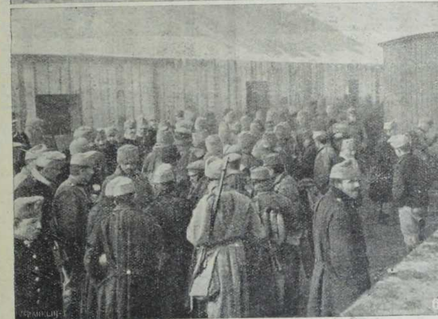
1. Шта почини једна граната! — 2. Напуштено село у Галицији на карпатском ратишту. — 3. Марва за војску — 4. Војник игра од радости са победе. — 5. Наши војници у једном селу у Галицији. — 6. Руски заробљеници добијају ручак. — 7. Народни усташки домобранци у Карпатима.