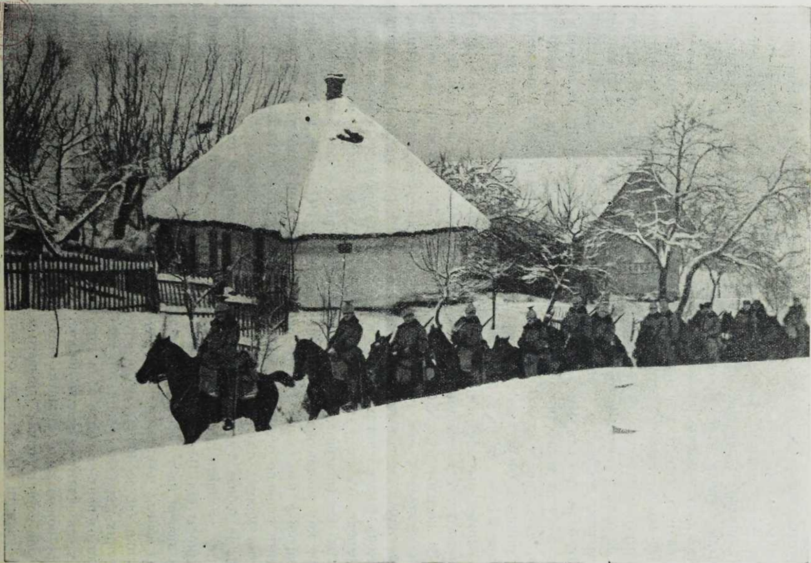
Са севернога ратишта: Пролаз уланаца кроз једно пољско село.