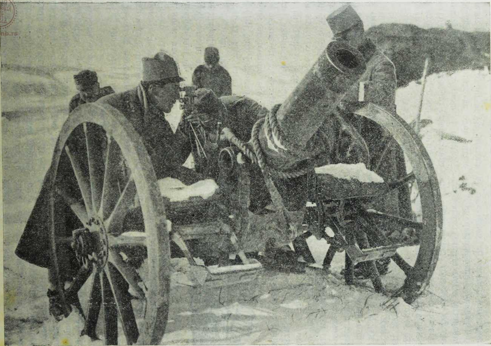
Са севернога ратишта: Намештање таборског тона.