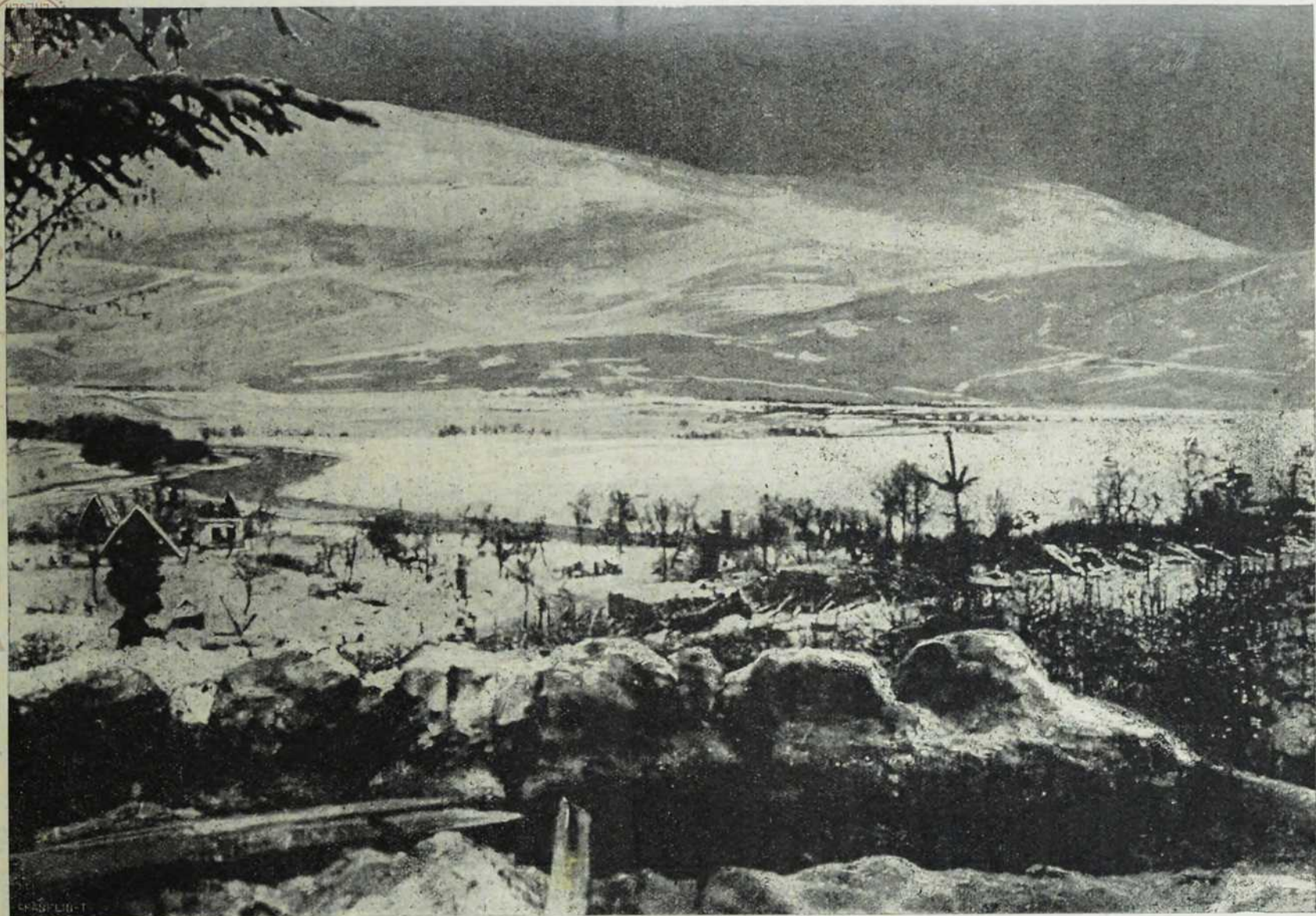
Са ратишта у Руској-Пољској: Изглед са наших положаја на Ниду.