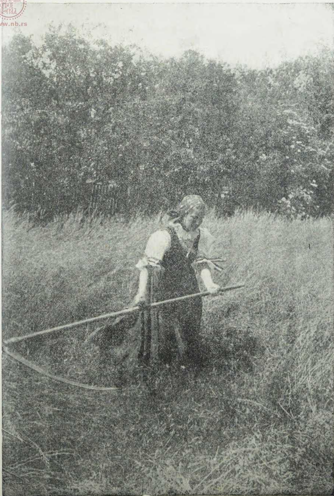
Кад су мужеви и момци у рат.