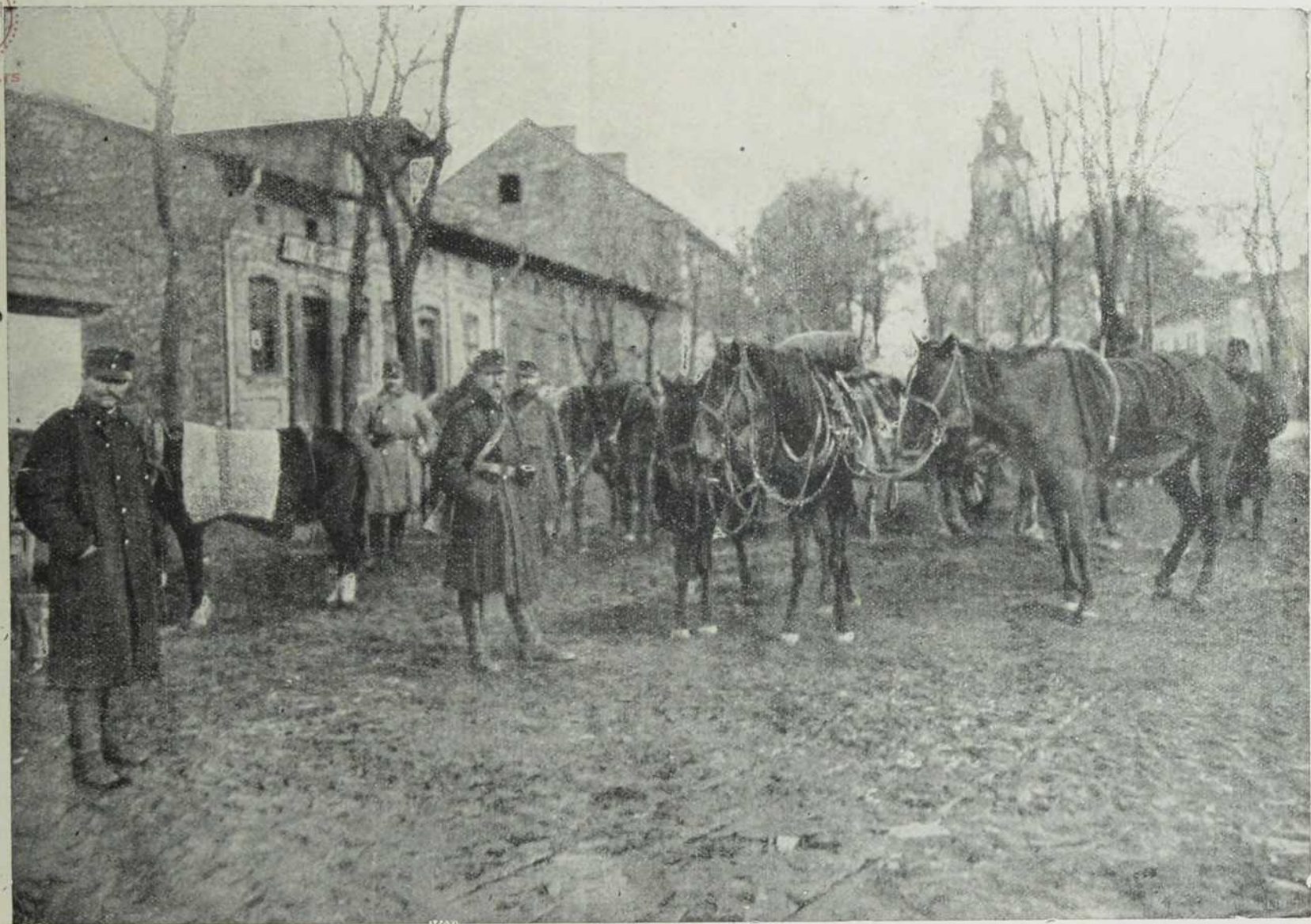
Са севернога ратишта: Наши пучки устани у руско-пољском селу.

НА ВО Д НА Б И Г РА ДС КО Г С Е ЛА Б И Г РА ДС КА Б И О Т Е КА