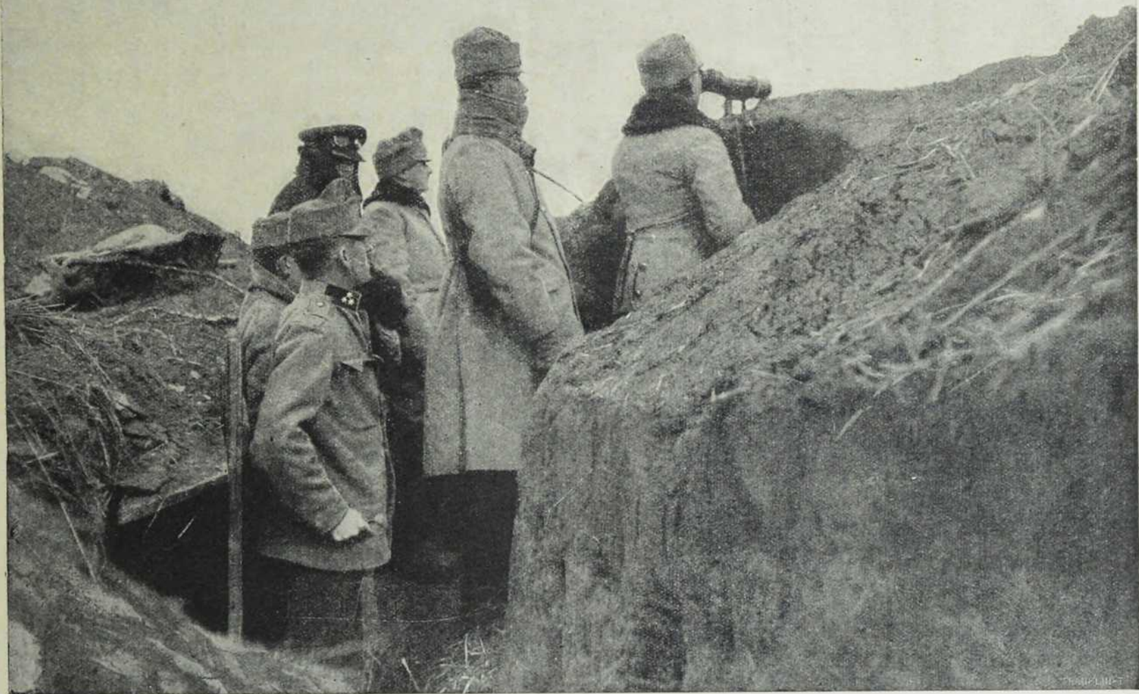
Са севернога ратишта: Артиљеријска извидница и телефонска станица.