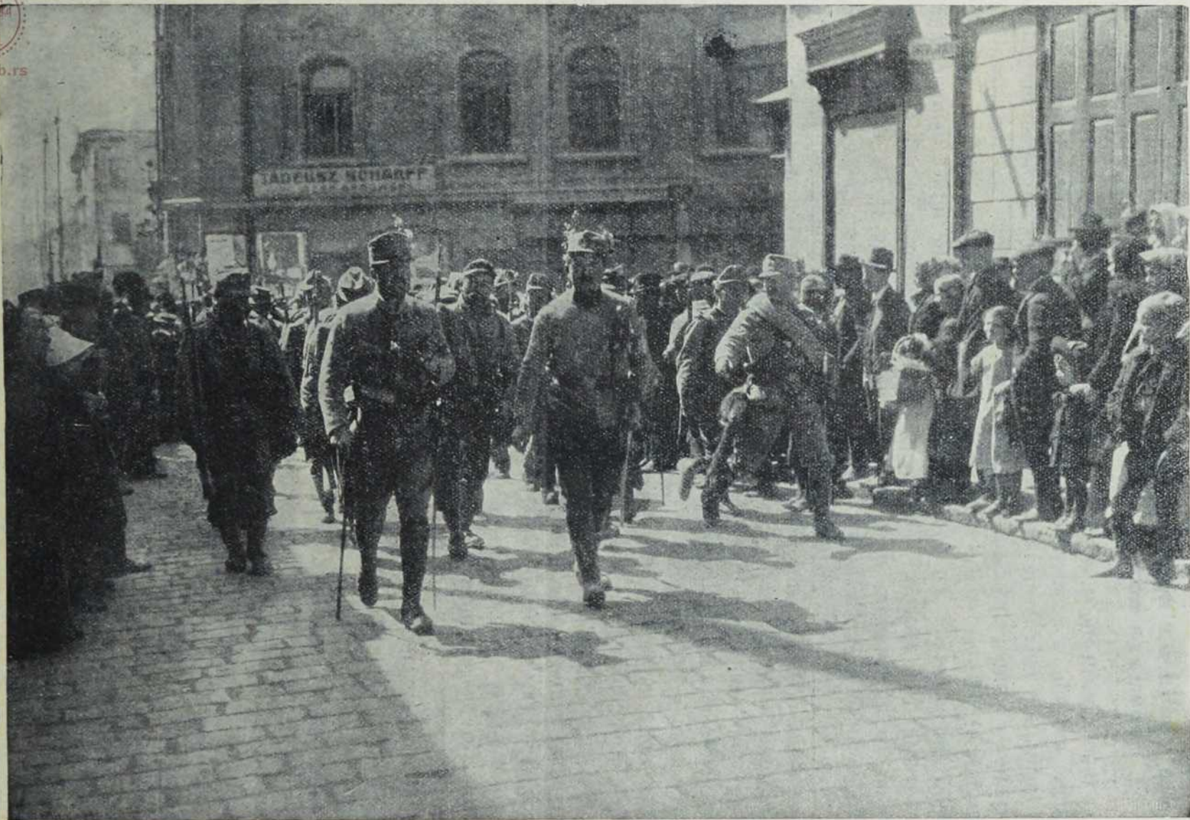
Од Горлице — до Јарослава: Улазак наше војске у Тарнову 6. маја.