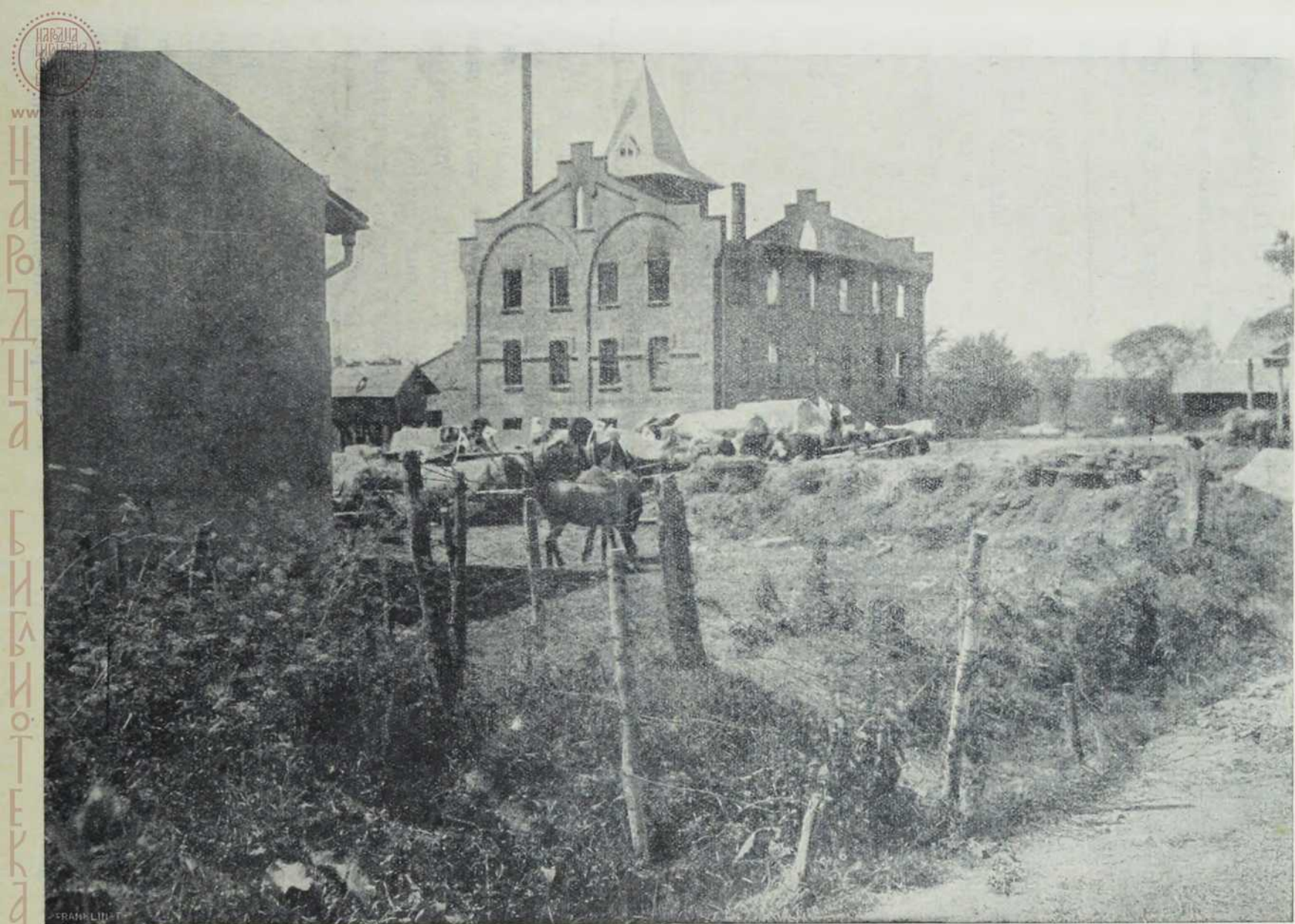
Са севернога ратишта: Жичане сметње и стрељачки ровови у дворишту једне творнице у Галицији.