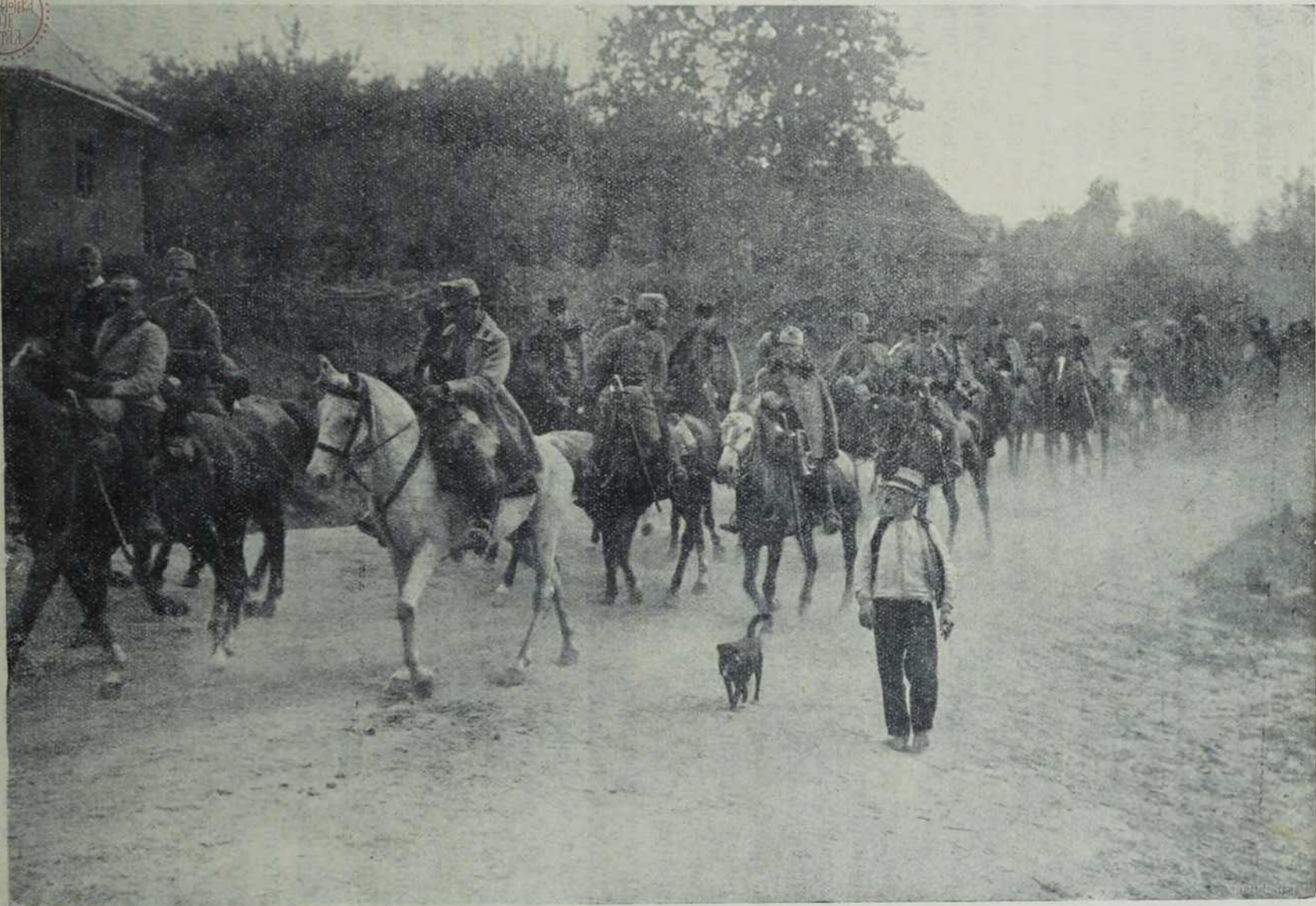
Са севернога ратишта : Улаз наше коњице у једно село.