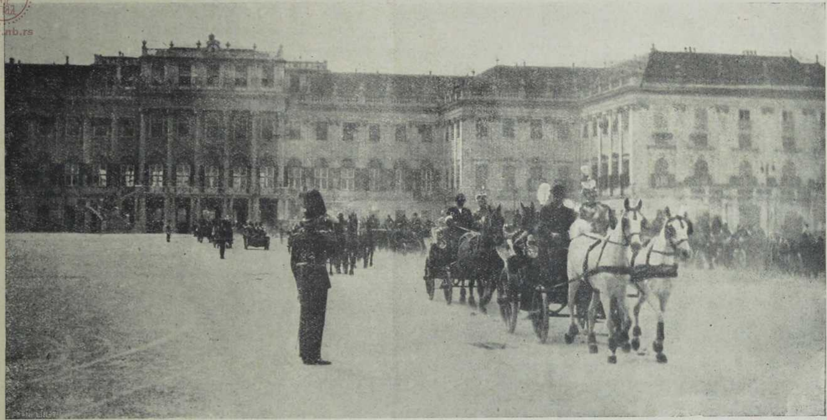
Повратак из Шенбруна.