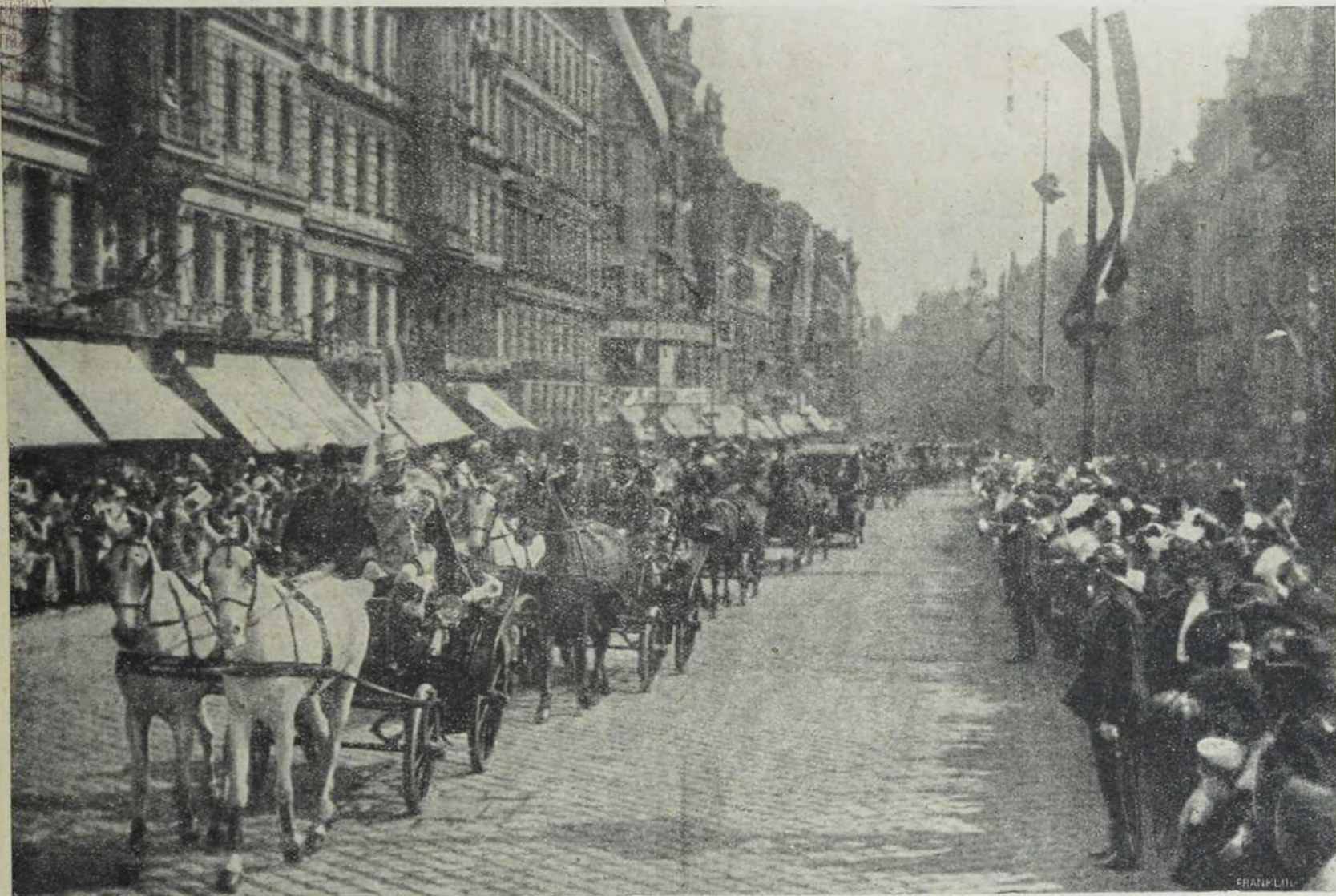
Пролаз депутације кроз улице у Шенбрун.