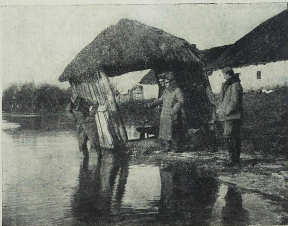
Да ли су ми добре чизме?