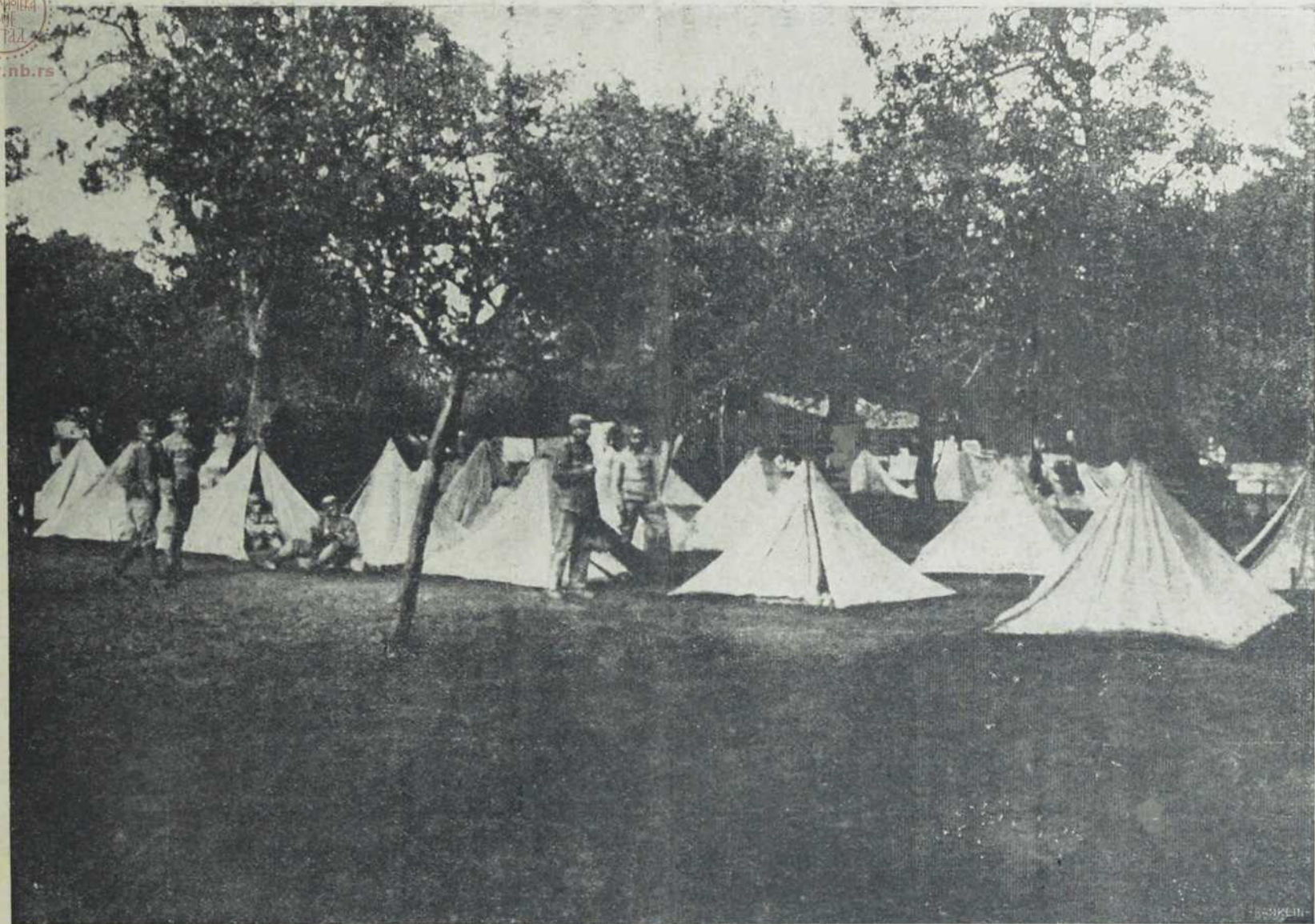
Са севернога ратишта: Шатори у вођњаку.