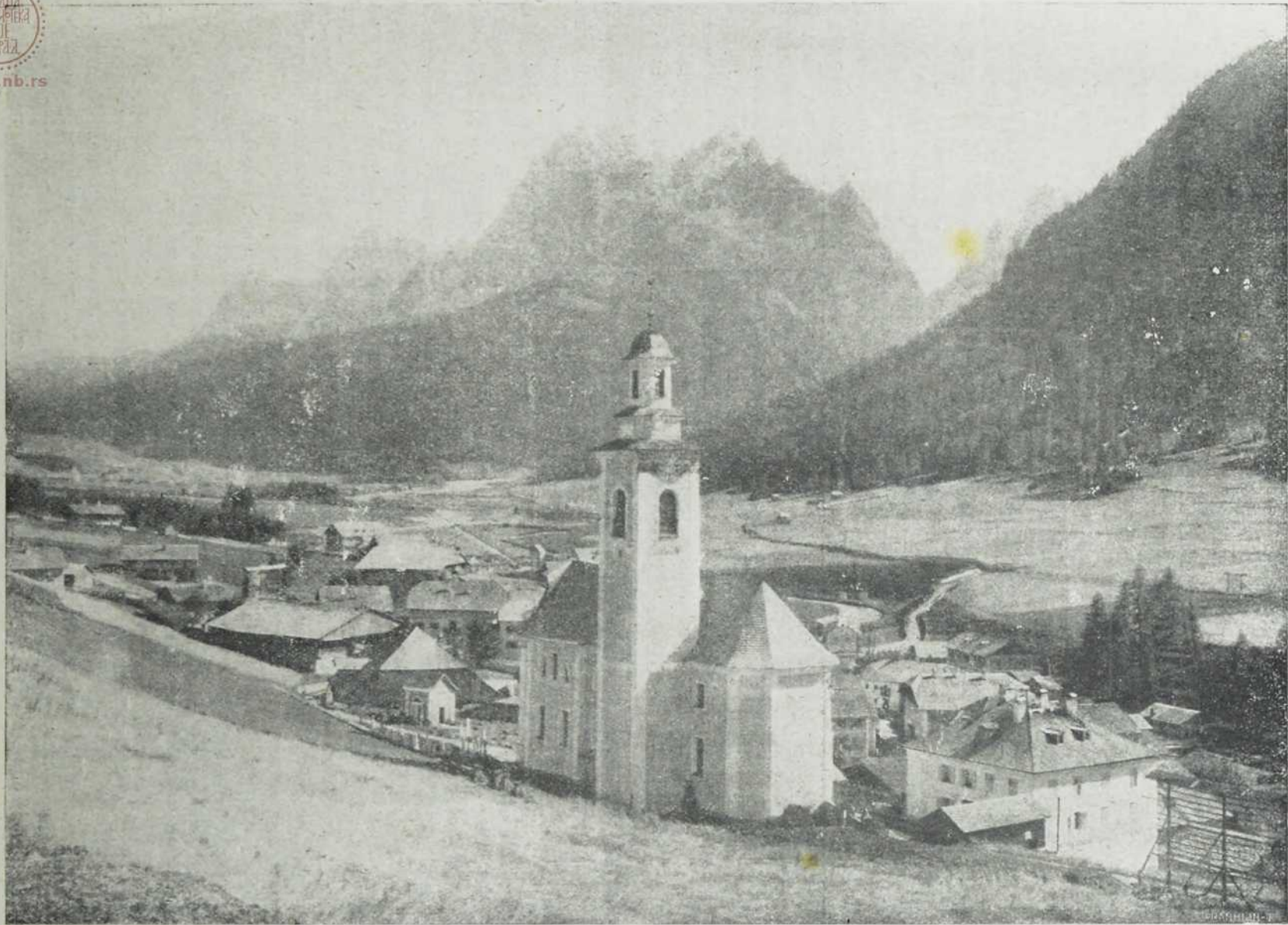
Село Сестон у Доломитима Тиролеким,