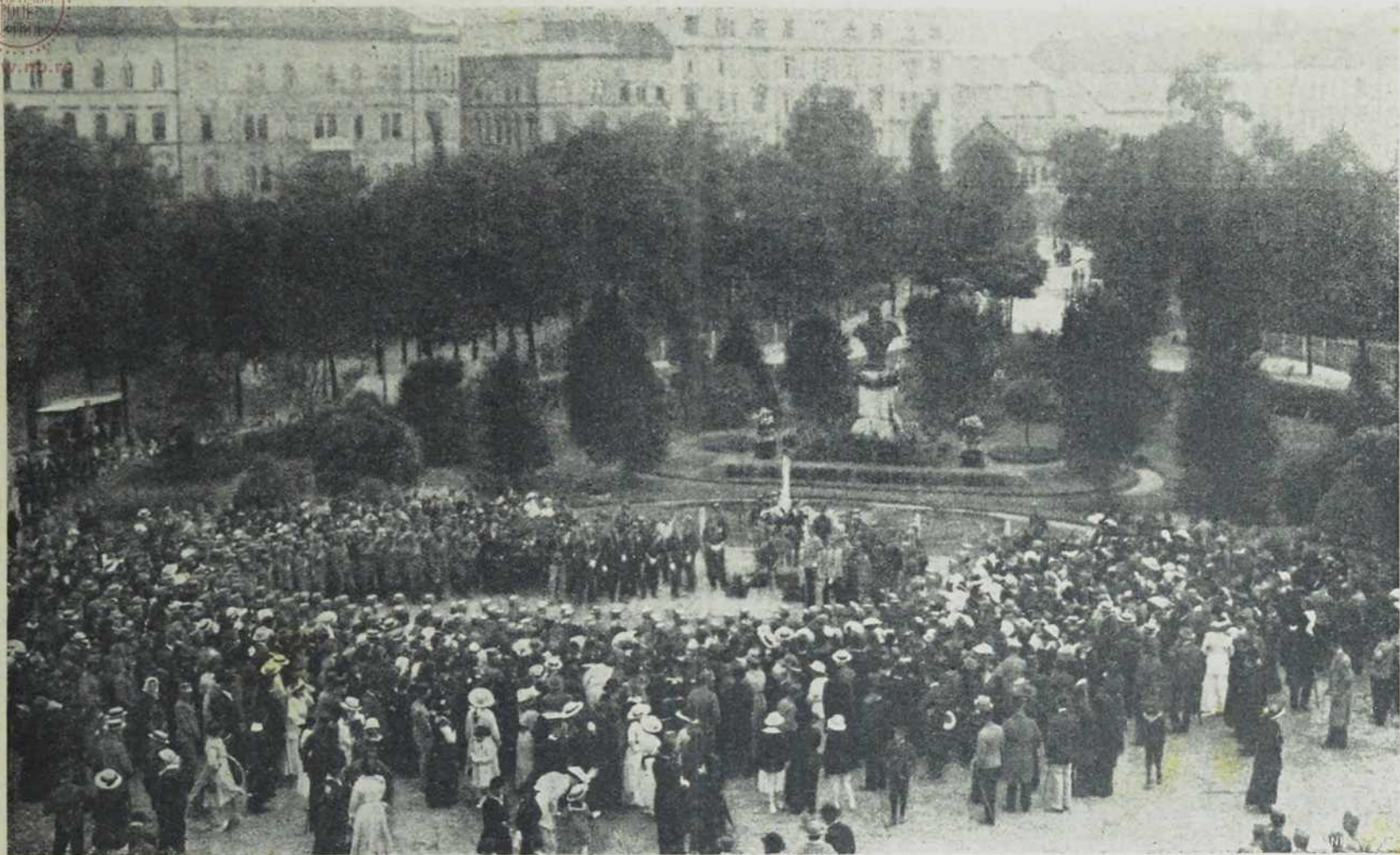
Будапешта: Питомци војничке Лудовике академије постају официри о Краљеву рођендану.