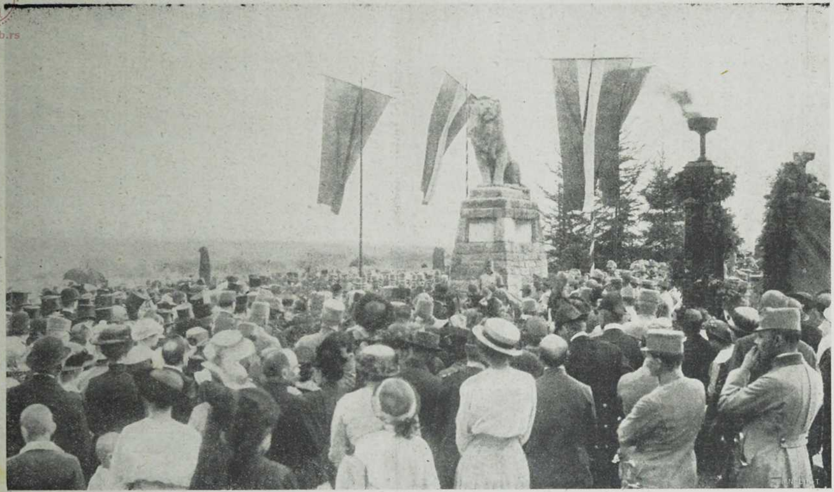
Подизање споменика палим јунацима у Мериш-Вајскирхену.