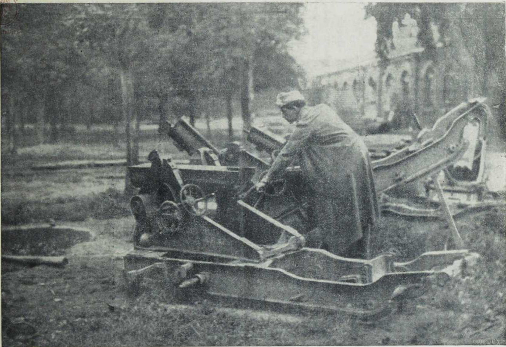
Са севернога ратишта: Развађени руски топови у Ивангороду.