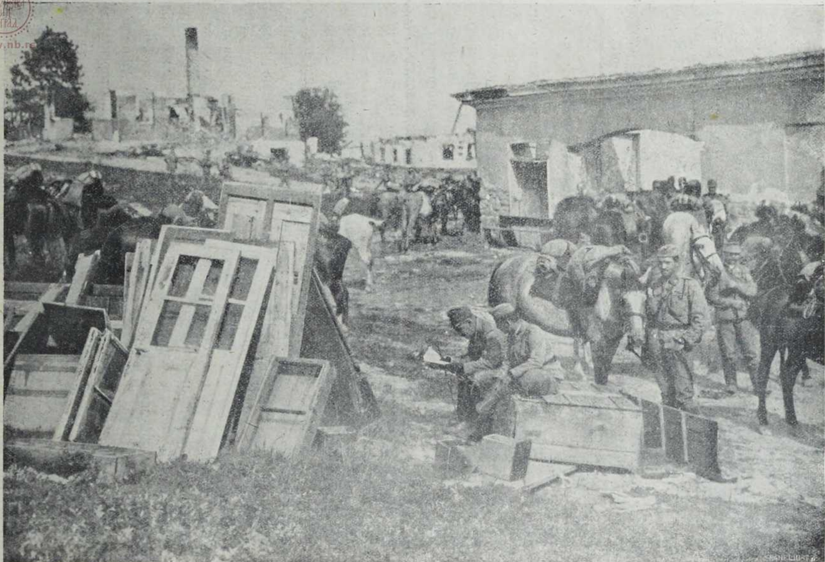
Ратиште крај Серета: Одмор наших домобранаца у Галичком селу.