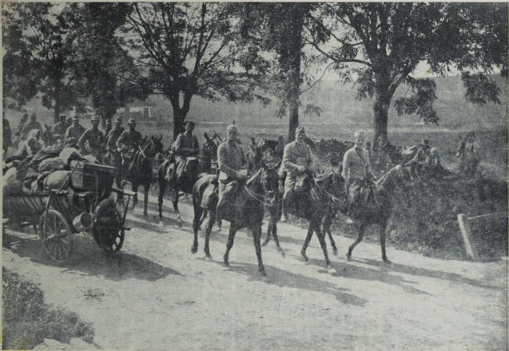
Ратиште крај Серета: Штаб једнога одеа савезничке војске.