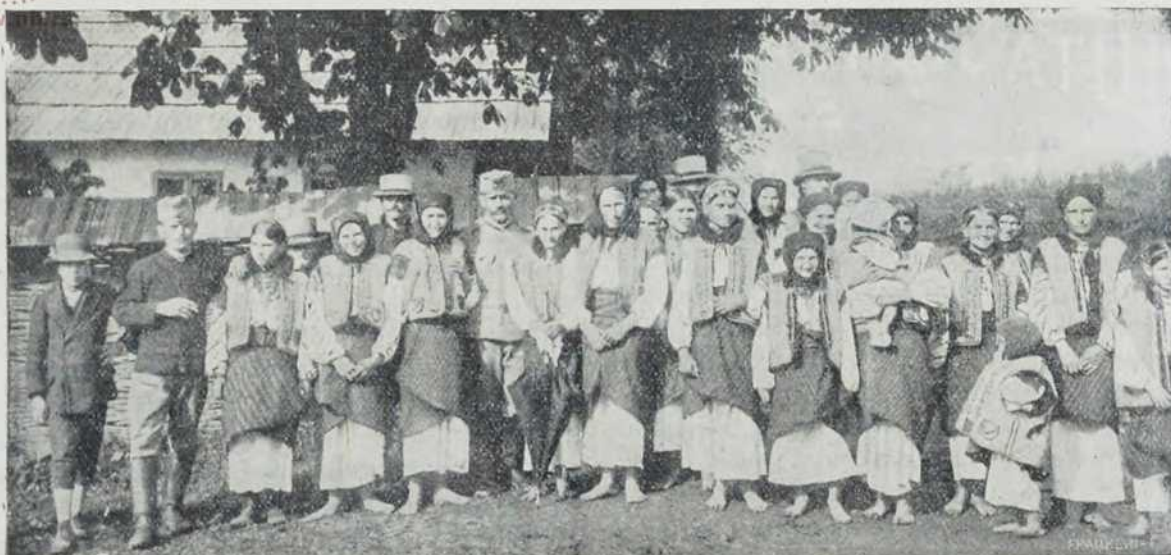
Из почиштене Буковине: Жене у народном оделу.