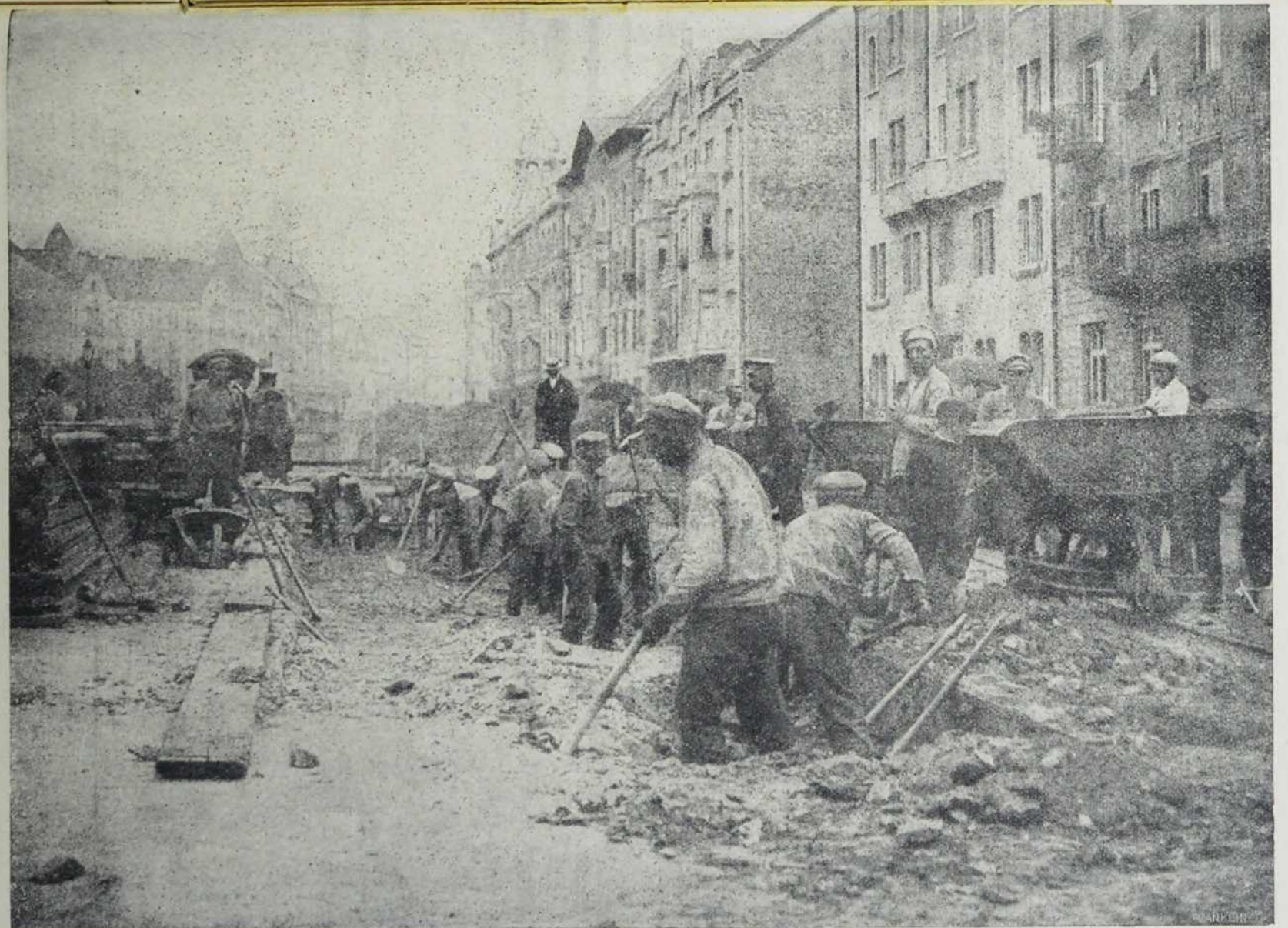
Руски заробљеници граде у Буданешти улички канал.