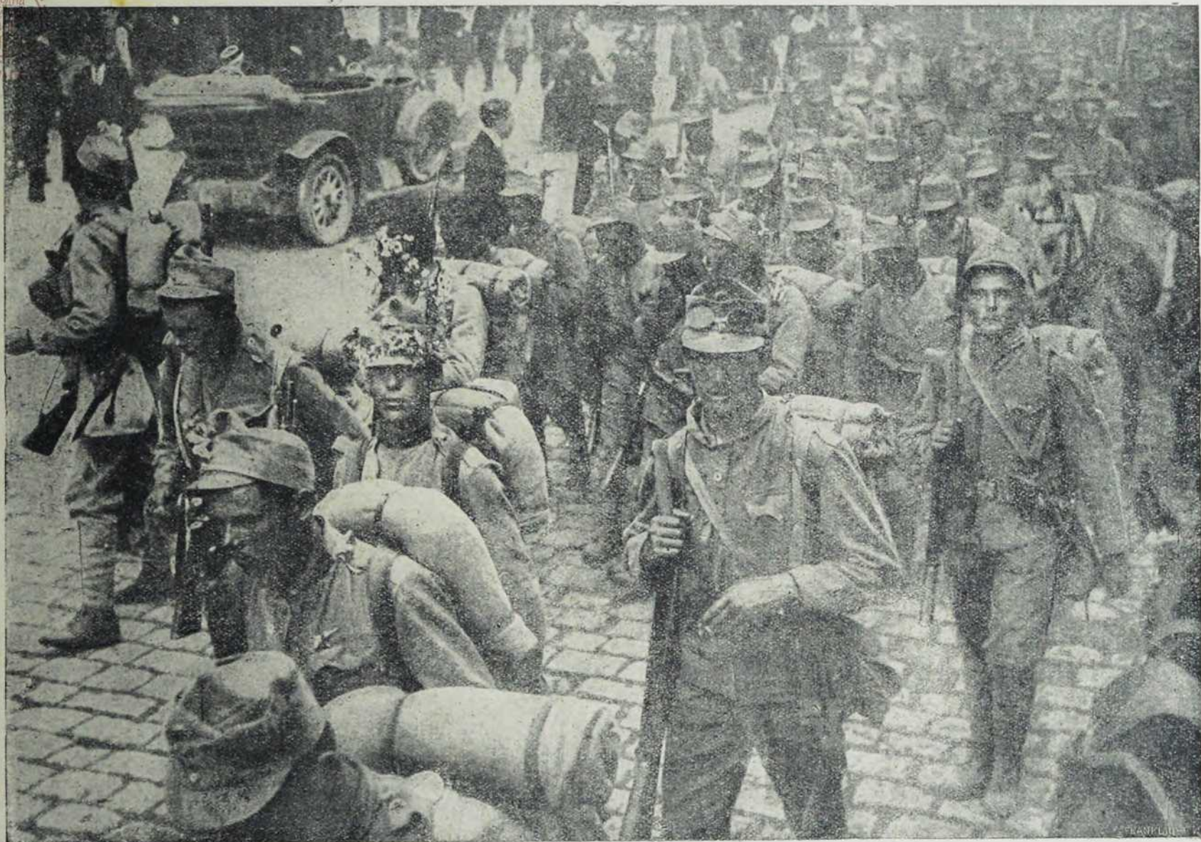
Са севернога ратишта: Пролаз наших војника кроз руску варош.