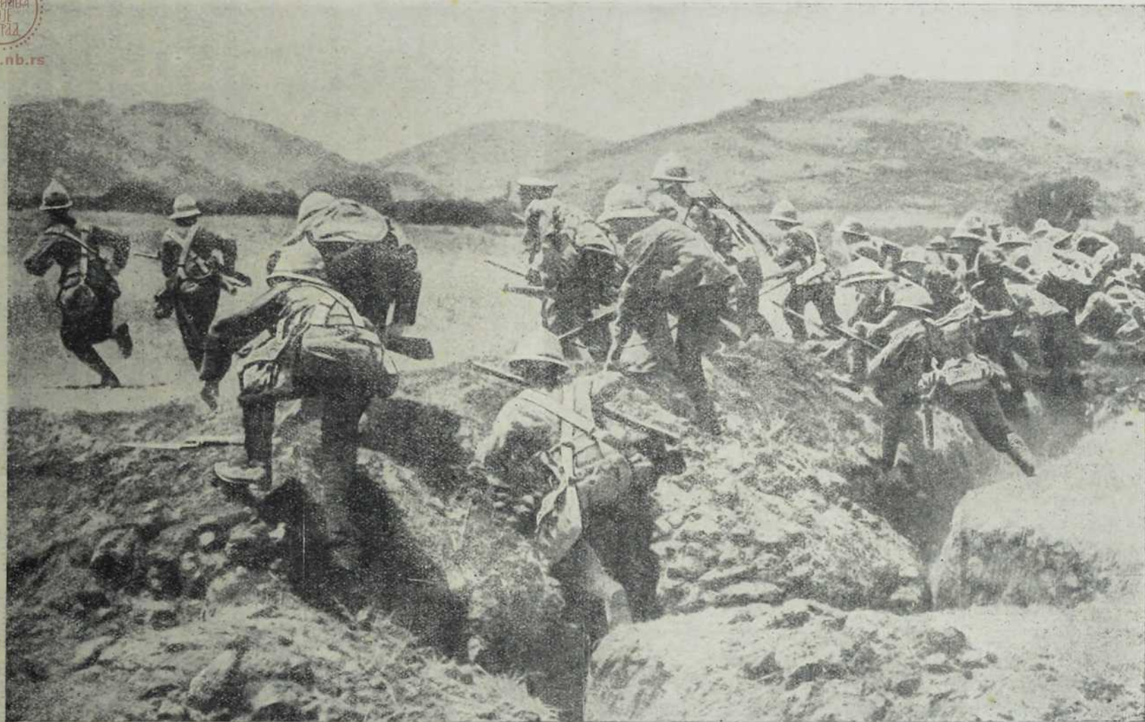
Енглески војници на Дарданелсима.