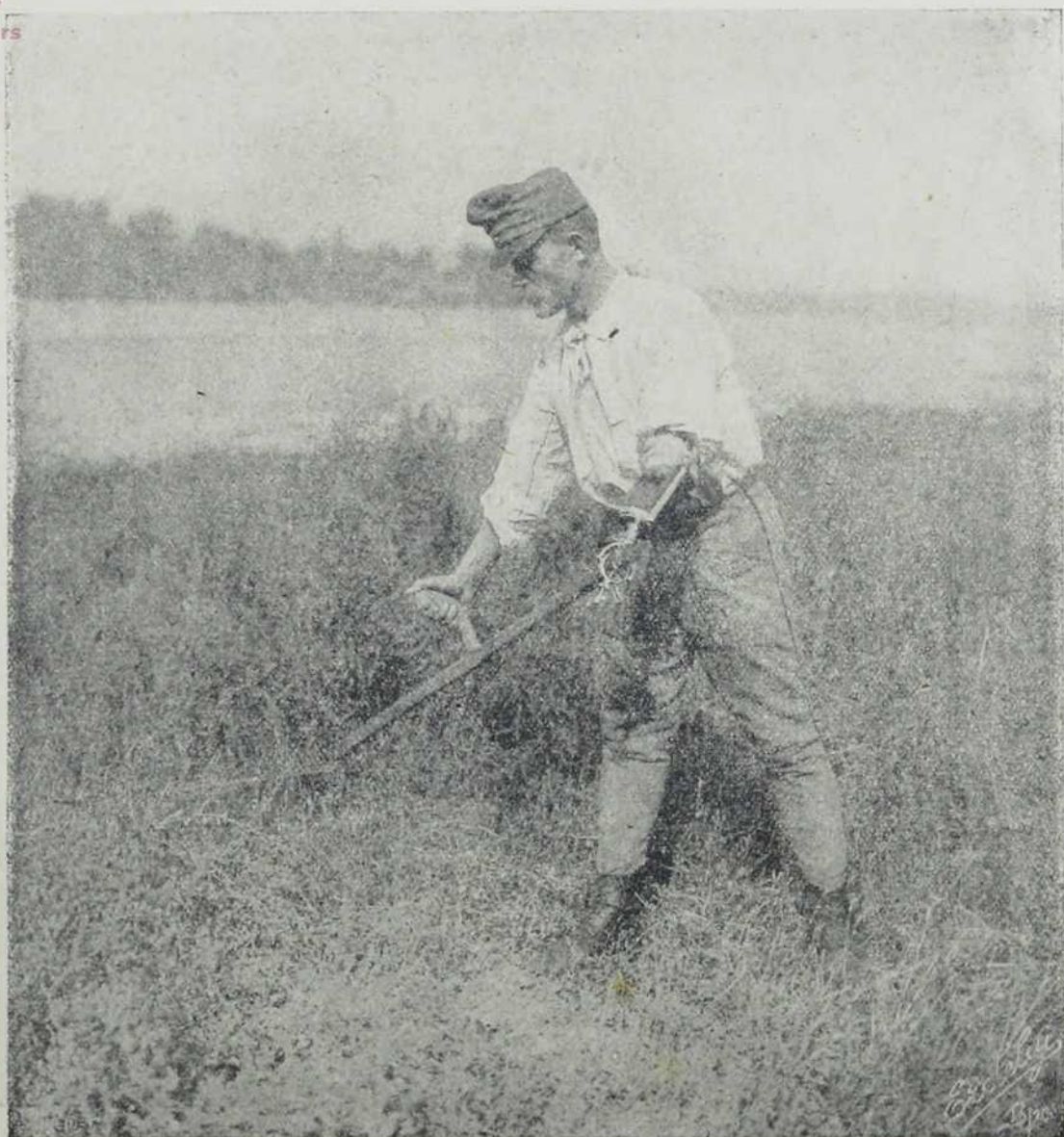
Немоћни војник, који вештачком руком копа.

треба да се служи са вештачким удовима и радилима. Нарочито се узима, при томе, у обзир код сваког појединца његов недостатак; те му се према томе одређује његово будуће занимање. Много се пази на то, каква су нарочита радила потребна ком немоћнику, па му се таква набаве и дотичног онда науче, како треба да се са истима служи. Стално