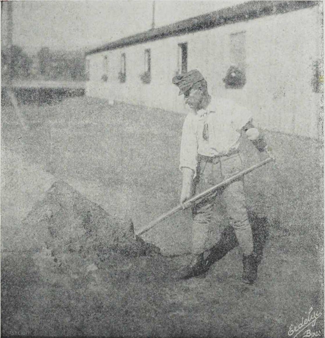
Немоћни војник, који вештачку руку врло добро употребљава при копању.