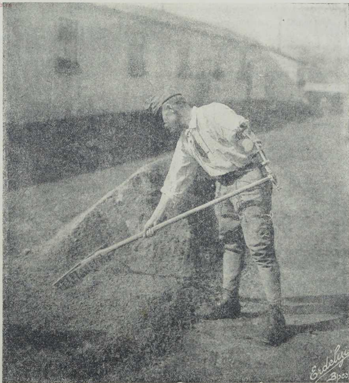
Немоћни војник, који грабуља.

у Будапешти нарочиту школу. Они су лето провели у државној пчеларској школи у Геделу. У колико буду из школе излазили и такови, који немају својте и не би могли уновчити свој посао, за такове ће се подигнути, под стручним људима, постаје и радионице, где ће они моћи