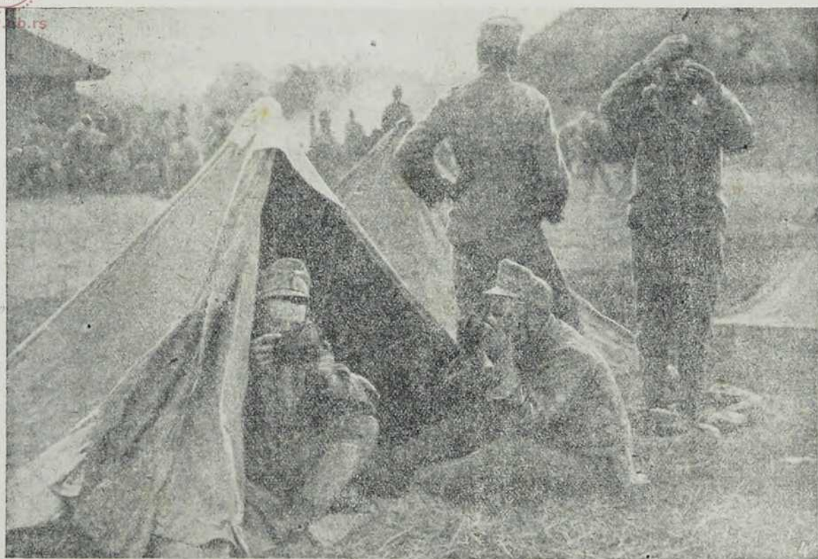
Са севернога ратишта: Доручак у табору.