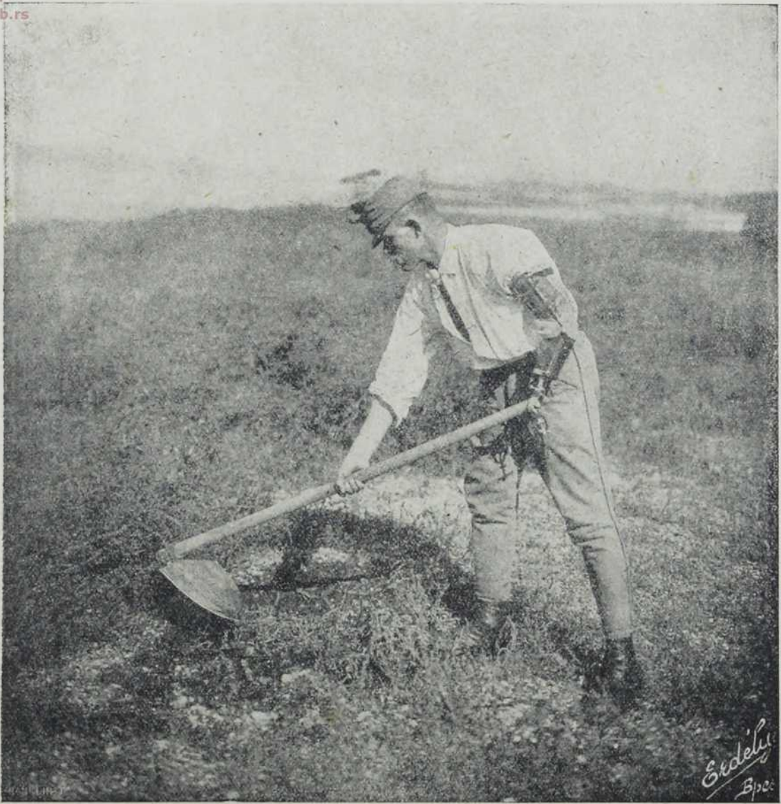
Немоћни војник, који вештачком руком коси.

којима су обе ноге одсечене. Са вештачком руком могу пољоделци, па и обртници у врло много случајева наставити свој позив. При прављењу вештачких руку и ногу нарочита се пажња обраћа на пољоделце. Тако се у будапештанској радници праве јаке и лаке вештачке ноге, да би они, који су само на једној нози осакаћени, могли наставити своје при-