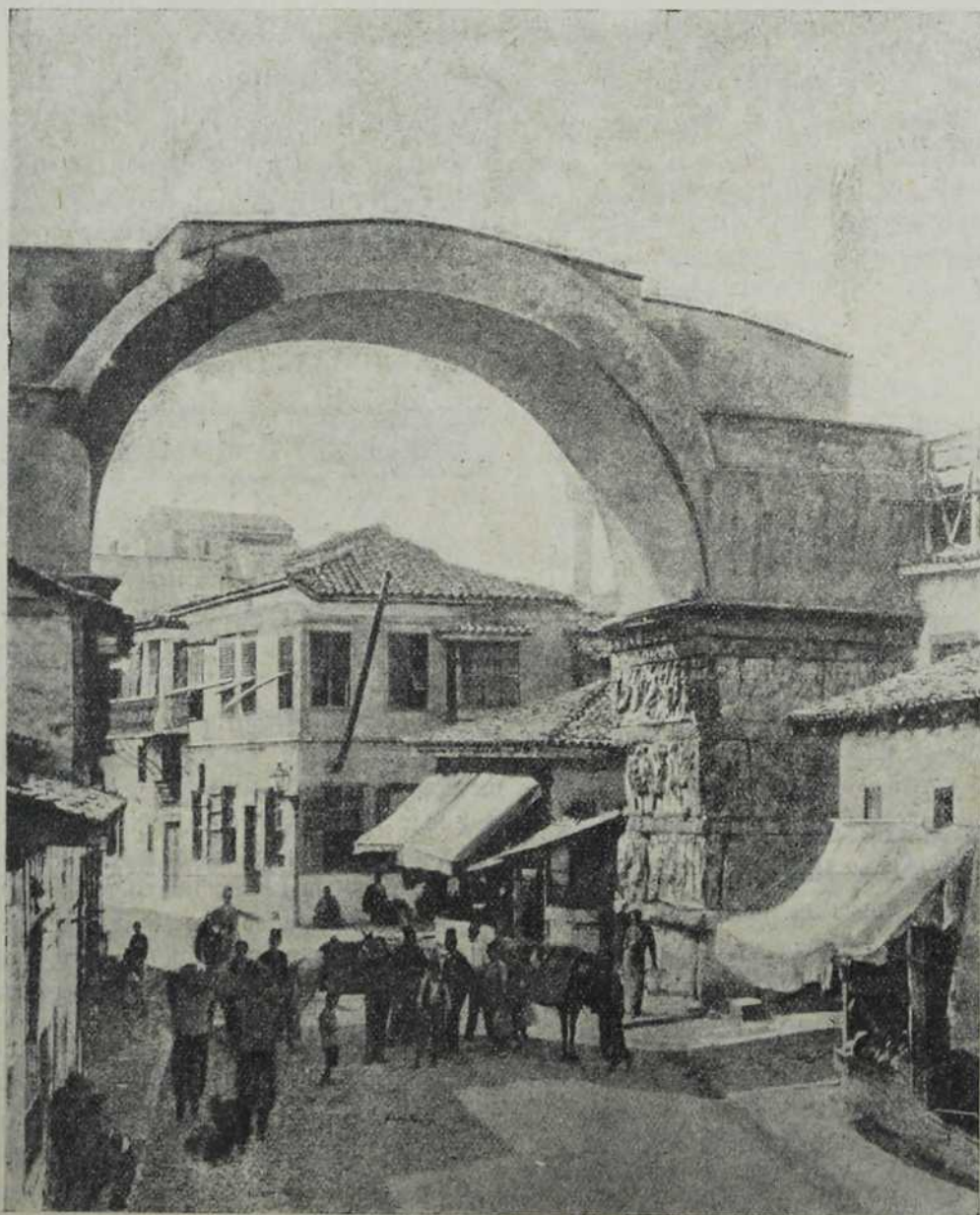
Солун: «Вардарска капија».

које се пробија између свих кућа, па онда чесме (извори), које својим једноличним мрморењем изазивају пред тобом комадић средњег века.