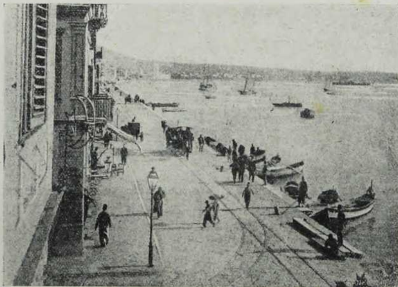
Солун: Морска лука.

Велике грчке цркве мораше се превратити у мошеје, као на пример Аија Софија солунска, која је у уметничком погледу знатнија и од саме истоимене мошеје у Цариграду. Украшена је најдивнијим антикним