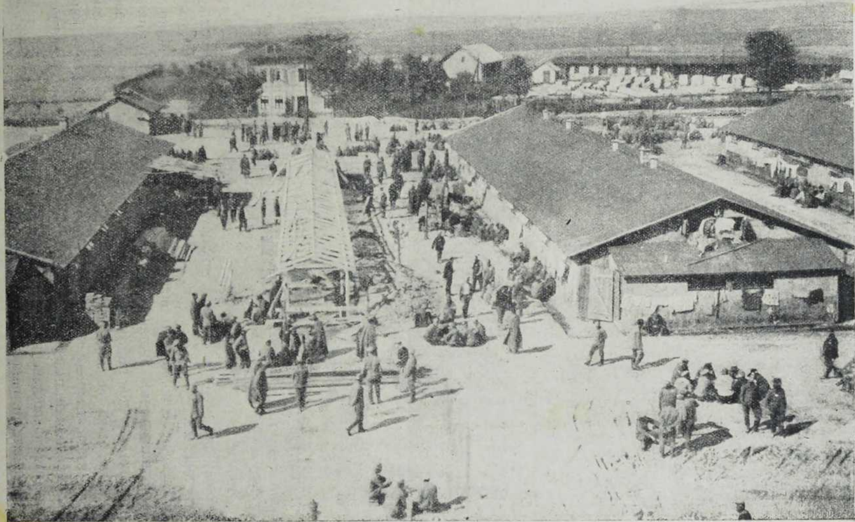
Из заробљеничкога табора у Егеру: Изглед табора.