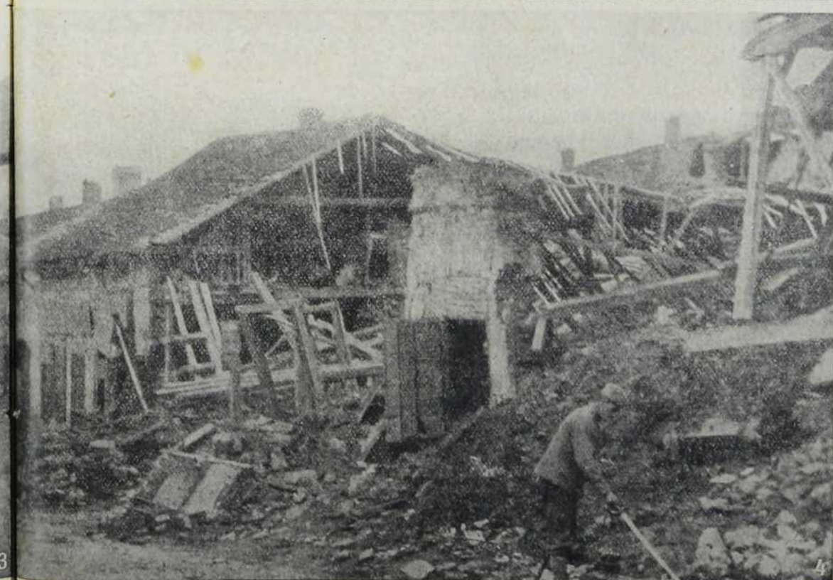
1. Грађење жељезнице крај Саве. — 2. Мост за нужду између Земуна и Београда. — Немачки војници на савској обали у Београду. — 4. Порušена кућа у Београду.