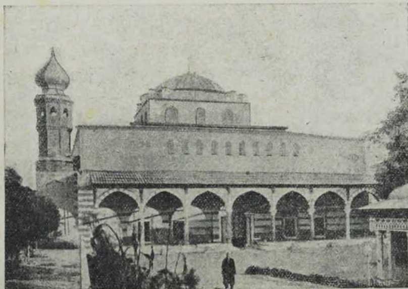
Солун: Цамија Аија-Софија.

Виа Егнација, што је за римскога господства водила од Дирахија (данашњег Драча) у Бизант. Нови римски господари показивали су се свагде на истоку пријатељима и заштитницима хеленским, па су се на тај начин грчки градови могли мирно развијати. То се може рећи нарочито за Тесалонику. Многе сјајне грађевине из античког времена оставиле су трагова до дана данашњег, ма да се тешко може разазнати баш оно место, које је још до почетка XVIII. века између свих градова хеленских — поред Атине —