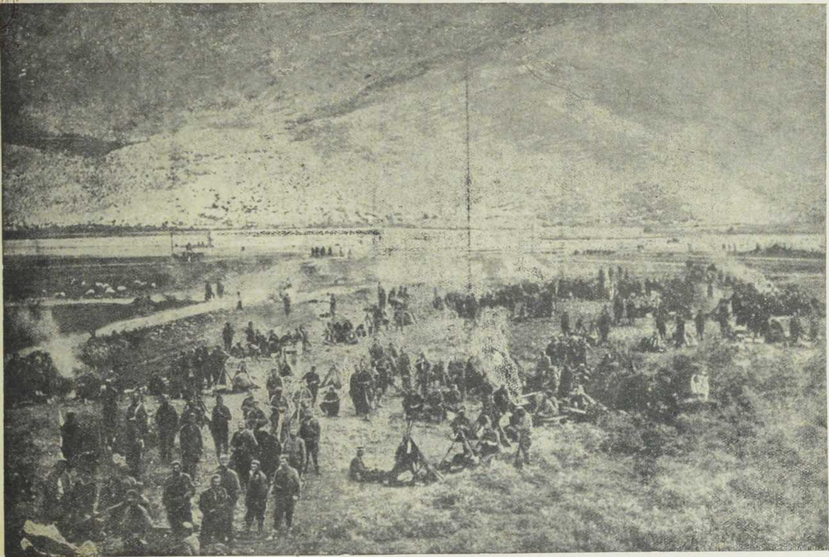
Слике са Балкана: Црногорски табор.