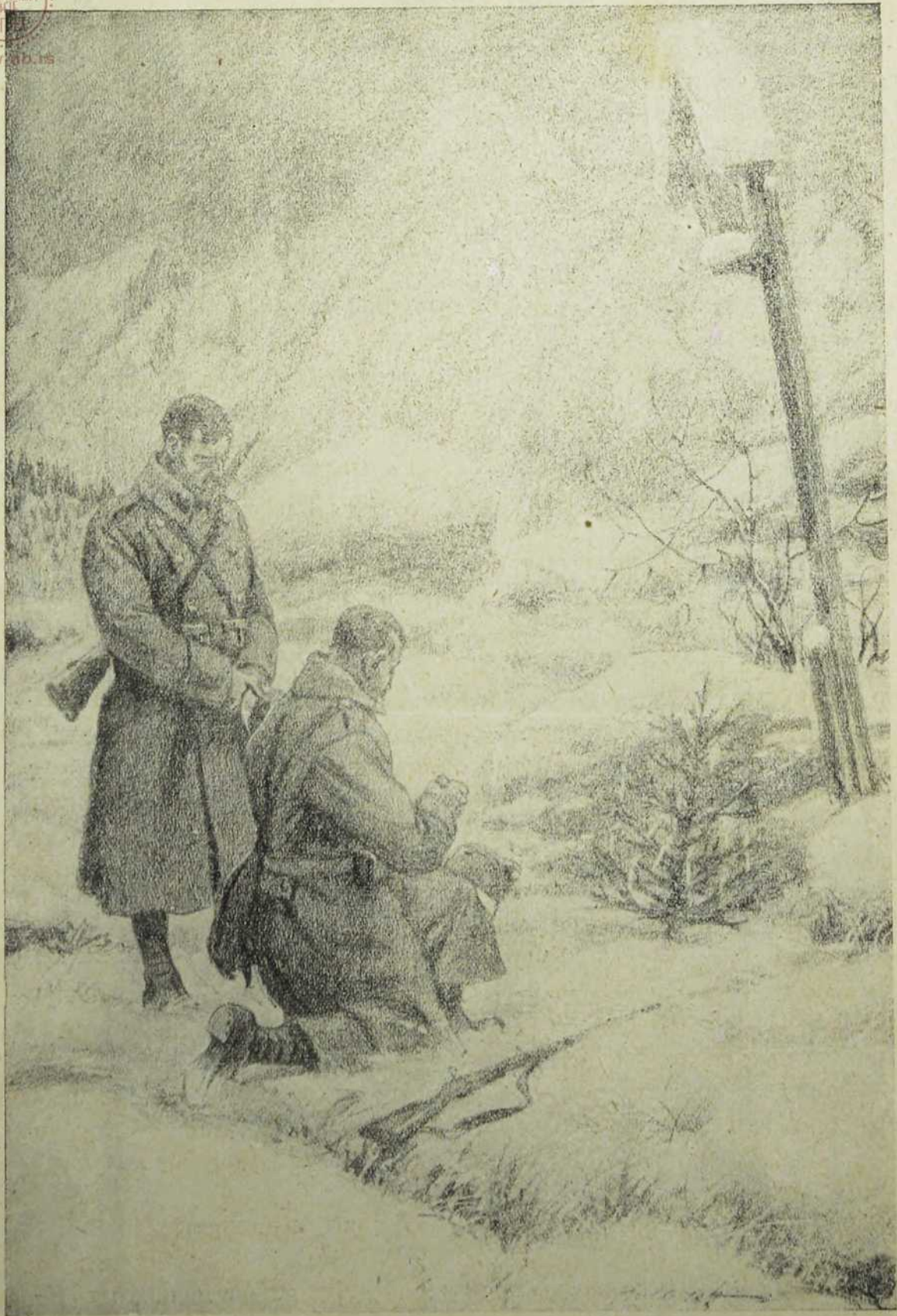
Божић наших јунака.