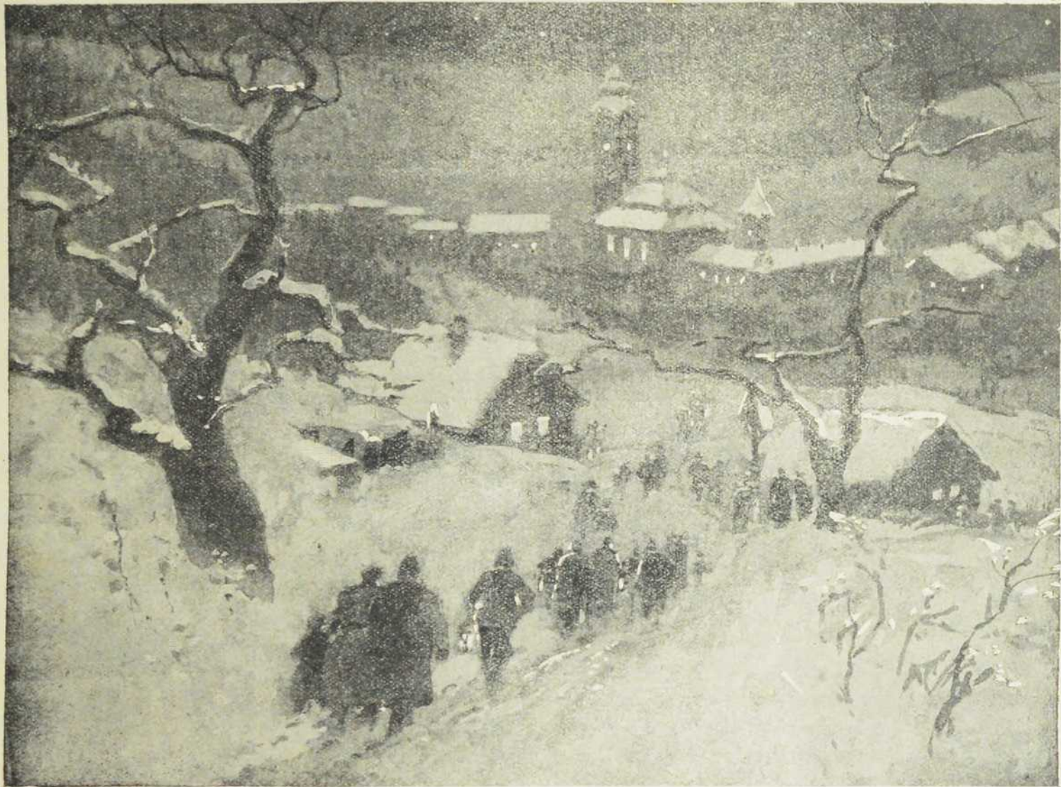
Повратак Јеа Божичњег јутрења.