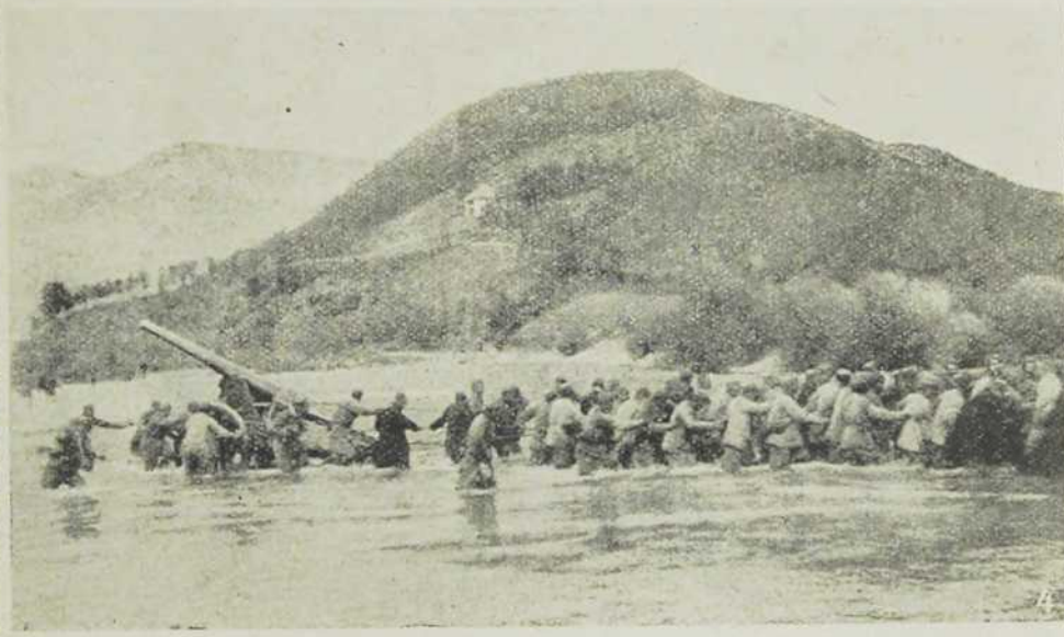
1. Долина Дрине. — 2. Краљ Никола у болници. — 3. Патрола доноси вести. — 4. Срби вуку топ преко Дрине.