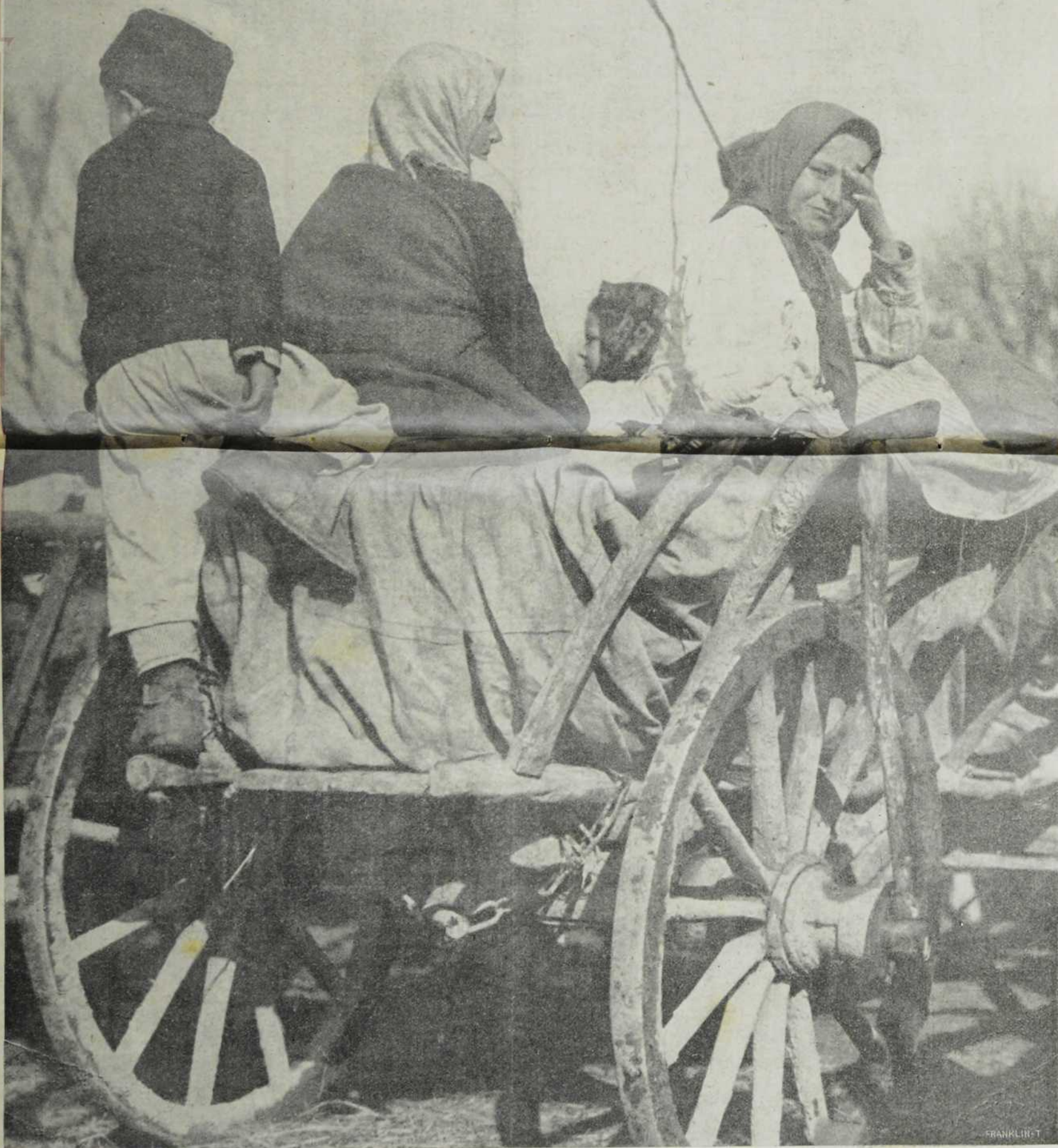
Бегунци се враћају у своју домовину.