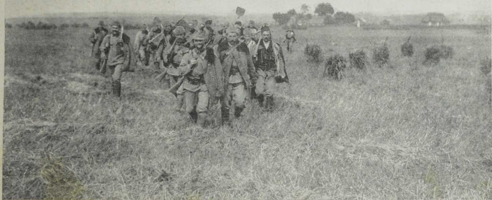
Са севернога ратишта: Улани иду у стрељачки ров.