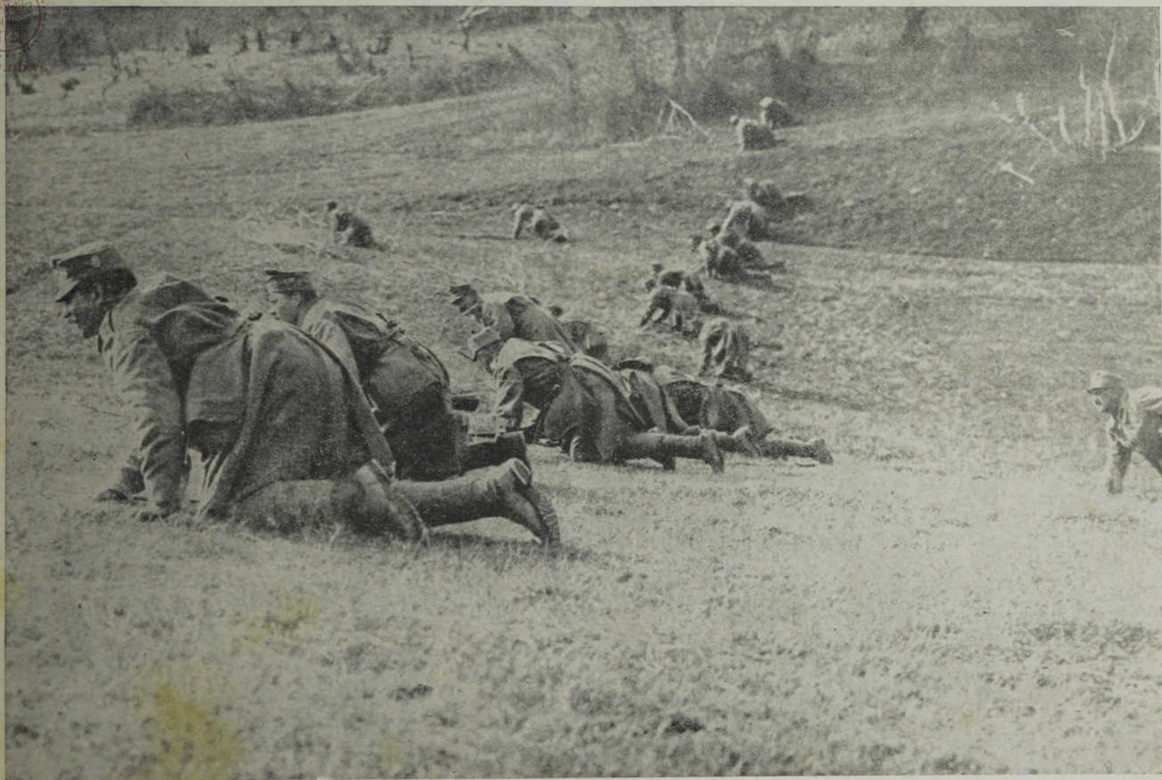
Са севернога ратишта : Примцање непријатељу.