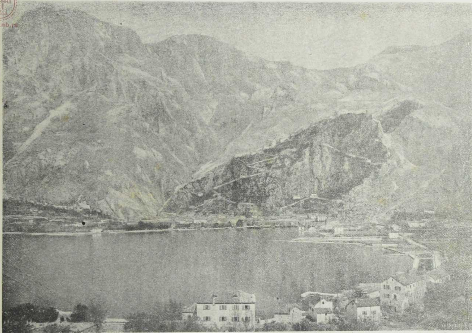
Град Котар са источне стране.