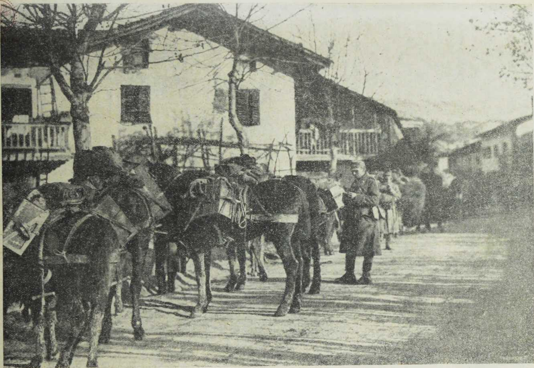
Са југо-западнoг ратишта : Носе ручак војницима.