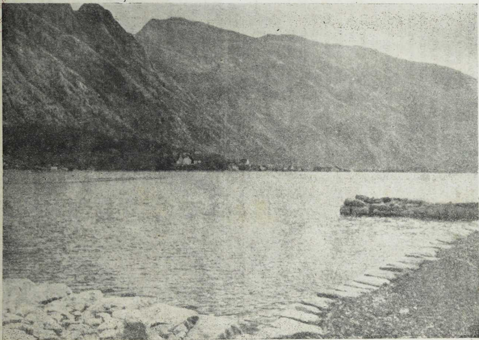
Бока Которска са погледом на Ловћен.