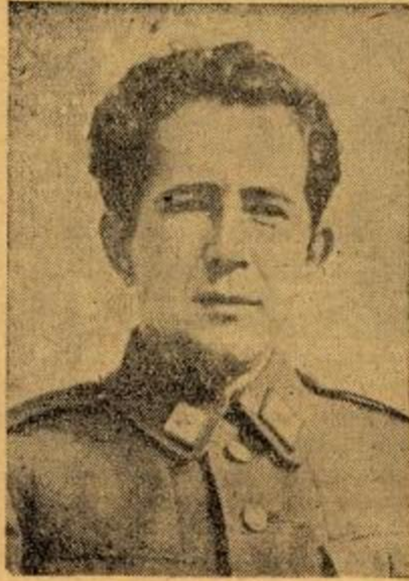
Генерал-лајтнант Милован Ђилас