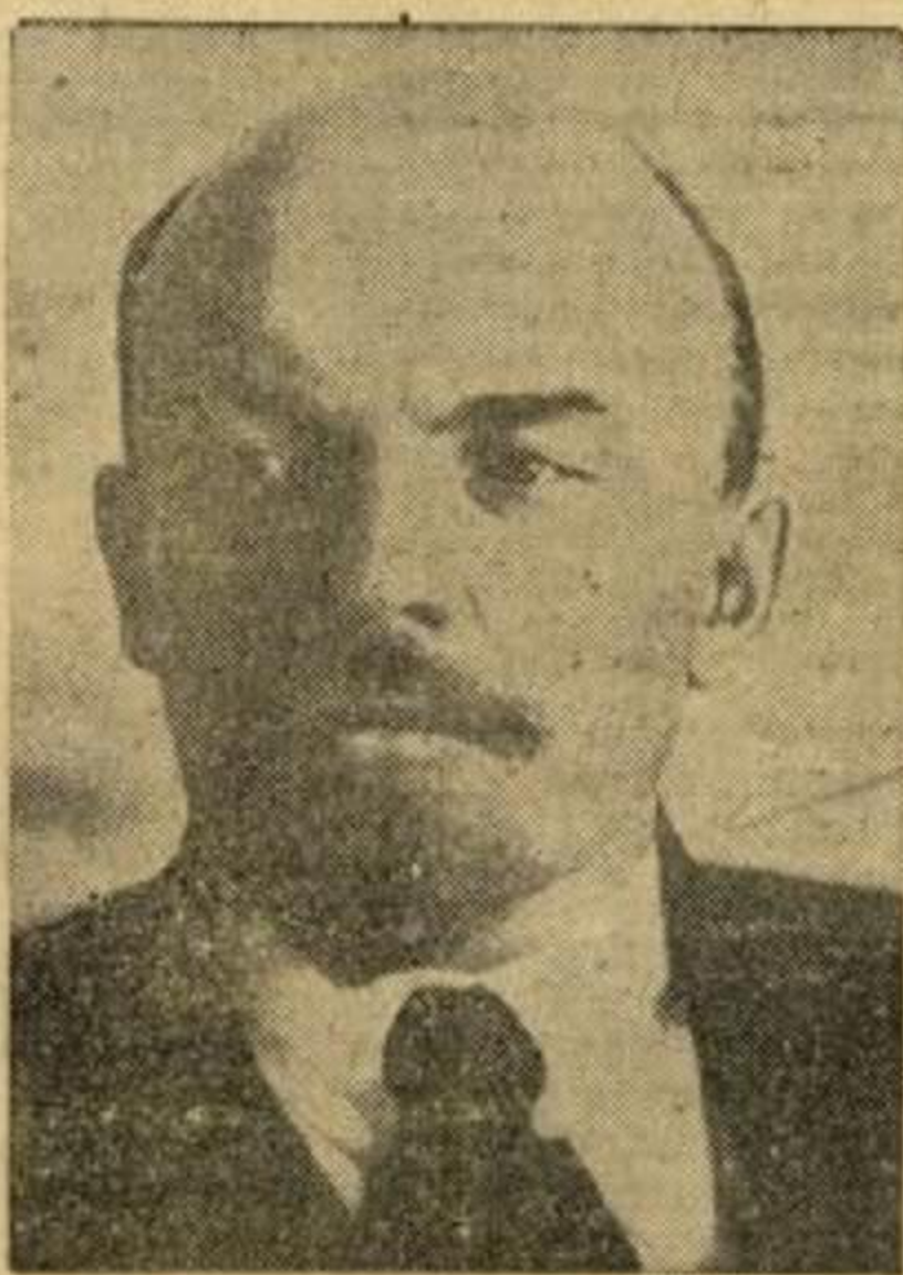
Владимир Иљич Лењин

Наша војска, раме уз раме са армијама наших Савезника, дотући ће фашисте у њиховом брлогу — у Рајху и Берлину.