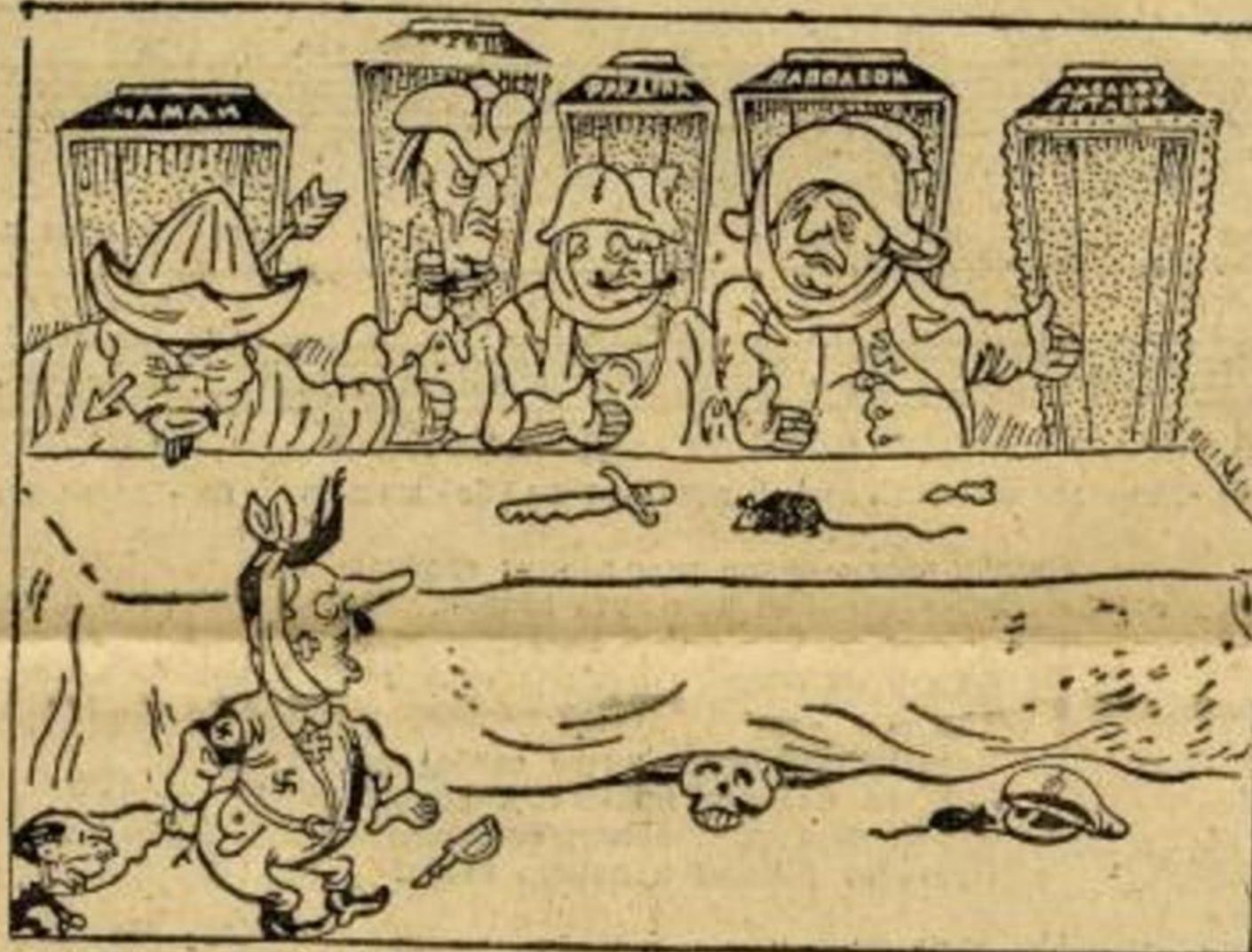
(Из књиге „Прјамој навојкој“, издање „Молодаја гвардија“ 1942)