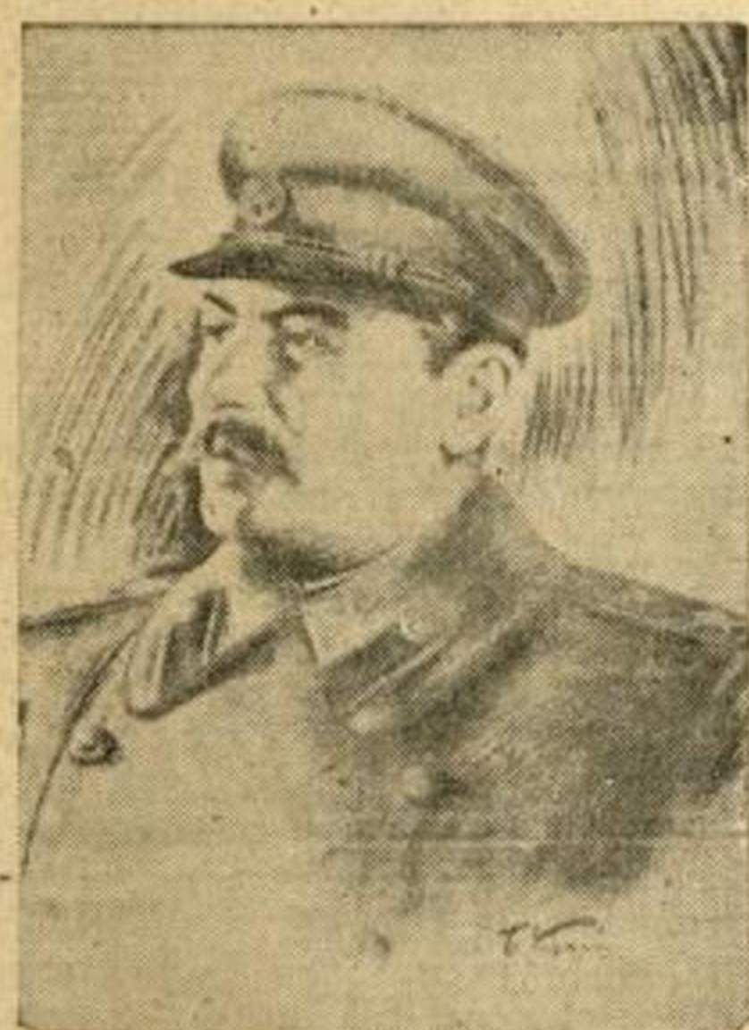
Јосиф Висарионович Стаљин

Прелазећи на питање учвршћења и проширења фронта антихитлеровске коалиције као и питање мира и послератне безбедности, претседник Државног комитета одбране, маршал Стаљин, између осталог, рекао је: