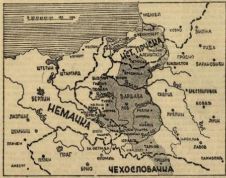
Шатирани део на карти означава територију коју је Црвена армија ослободила од почетка офанзиве од 12 јануара до 24 јануара о. г.

којим ударцим советска армија, није се још десимитно одлучио и даје немарав да задарко советско надзира. Тако у идеју још се није до сада јасно изразила код Немца ни на једном оперативном пољу од Берлина до доњег тока Висле. На путчење и разбине Гуаернијеве армије коју су брањале тз. источни знач, немачко командовање може врло мало или уопште не може рачунати. Дакле потребно је довести разварај из дубине у колони из које и одвојити снаге са других фронтова, што Немци веома чине. Тако су већ са завладог фронта кинто пребачили више дивизија на исток, у циљу да задарко или бар успор не надирнае советских армија. Никада од почетка рата немачко војство није било у такој ситуацији него данас. Видејемо шта ће Немци учинити за задржавање ове советске офанзиве која је још у пуном јеку.