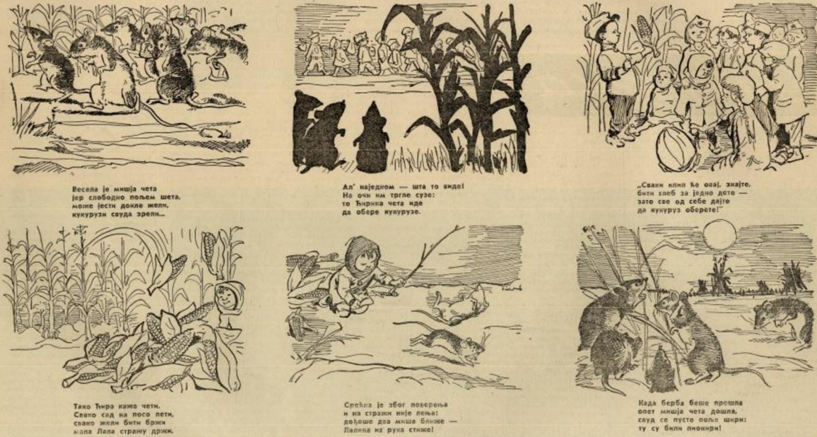
Весела је мишља чета јер слободно пољем шета, много јести докле жели, кукурузн свада зрели...