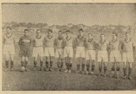
Фудбалски тим С. К. „Црвена звезда“

градну учествовало по 100 девојка као тада, на Капањиници. Спорт је одмах почео да се шири и међу радничком омладином, тако да је на тои истом крос-контри било само са Карбуриме око 50 учесника. Баш та мисленица: вест изјан од елементарно нове физиктурне и спорте. У правилима „Црвене звезде“ постављено је као основна перода за њен бу-