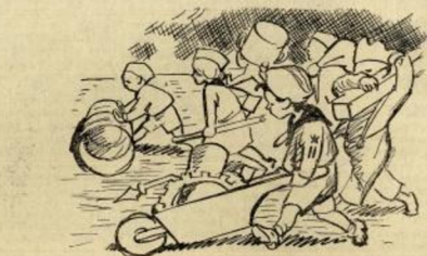
Сладе сви на поса журе, сваки жели Боље бити, није чудо — ствар је важна: треба гвојде сакупити.