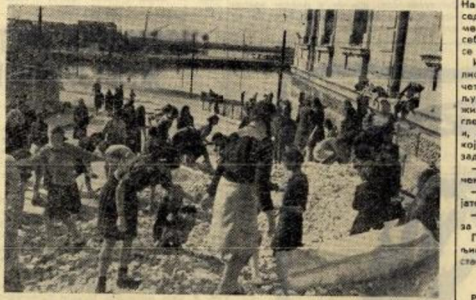
Отварају се посеење рушевине са славских улаза

У целој Македонији достојно је прослављени велики општенародни празник. Провомаско такмичење је обухватило широке народне масе, затегаљено је све традиције, установе и предузећа. У Ресну су формиране радне бригаде које су за кратко време уредиле центри града. У раду учествовају 150 радника, а јавност су са 80-годишњим старци. У великим данима оспособљени и они су ставили на располагање земљи своје старе су. У Осехру, на земљишту између гилемзије и шумског расадника, ископавали су радни јединице и војска за један дан ододелајући до 1.000 метара широк а, а дубок један метар. Таме је омогућено отицање воде на расадника у коме ће сада млади расадни брече и усонишати неопревети. Осим овога изорано је 20 јутра њива, 20 јутра њива, прикопано 23 јутра напуну земљишту. „Сваку медаљу у празници дан, првотретићемо отседа у дан колективни радан“ — говорио задовољним добровољци.