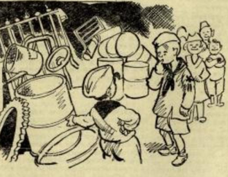
Кад је Родо Ђири дошо зарепањен ствар, „Одвале ван тогко гвојде, како ли сте то успели!“