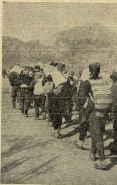
Омладина Златибора вреноси храну за Сицију

Када је 1941 година Италија окупирали и анектирала нове пределе словеначке и хрватске земље, Југословенске су с оне стране старе државе на граница уједињили су се у заједничкој борби против немачко-италијанских освајача. Ослободилачка борба у