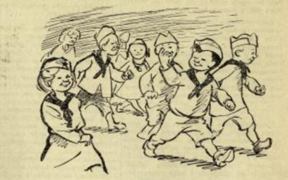
А у другој чети на рад пошао је прав Ђири. Увек, увек бити прав — то је дужност командира.