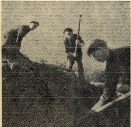
Француски омладинац поправљају колосеке и станику у Бесу

Борба француске омладине против фашизма теже је упоредо са борбом француског народа. Покрет Отпора у кључно је у себи велика маса омладине. Јануар партизанског покрета 1941. године било је потпомогнуто нарочито приливом великог броја омладинаца. Омладина је најактивније учествовала у саботажама у фабрицима, она је пушала немачки саобраћај, учествовала у ликвидирању летокашних елемената.