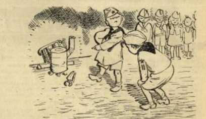
„Ево видих ову зрп!“ показује Родо Ђири. „Под надзором то су мојма сакупити поинери.“