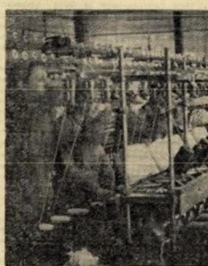
У македонским творилима омладина војкротавоу ради

„Ве работа песна не сегаде ке ески, ке слави слобода и посрејниј дим.“ Пре једног дана на Копању, Осогову, Веласици и другим планинама, грмеле су пушка и ружвети митраљазки — тако је избухнуло фашистичког оккупатор врши последње омладинске покушаје да спомење јављу македонског народа за слободан животом и унитарни живот. Најбоље знамо — партизани, који су у борбеном заносу са братским јединицама Србије и Космету ослобађавају своју домовину.