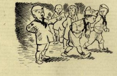
Решење је сасвим просто — доп је Родо рекао четри: „Сви морате сад завети!“ — он је сам за надзор ост.