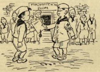
„Темичкема отеравам“ показује Родо Ђири. „Одвале ван тогко гвојде, како ли сте то успели!“