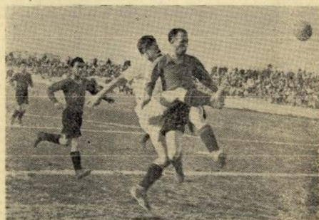
Момент са утакмице између Софије и београдске омладинске репрезентације