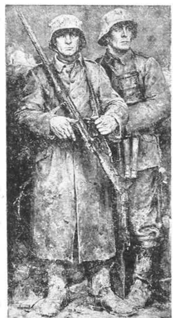
Немачка пешадија (рад Вилхелма Саутера)

Директива армије је за 15 април 1941: „Пробити се до Сарајева!“ Ова кратка реченица армијске заповести била је одлучујућа за судбину бивше Југославије — то осећамо сви који окружавамо велику карту на столу армијског генералштаба. Треба проћи још огроман простор, можда и под борбом, простор који би некада захтевао више априлских дана, али наше околне дивизије и моторизовани одред показали су већ при пробоју до Загреба, као и при заузећу Београда, шта су све кадри учинили на беспутном земљишту.