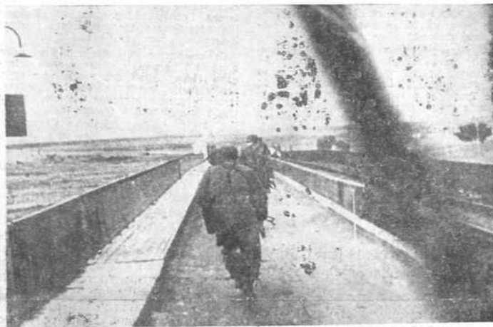
Немачки паобранци трче преко Коринџког моста... не знајући да је минирањ...

Немачке пропагандне чете (П. К.) жртвујући своје животе, својим снимцима овековечиле су јунаштво немачке војске.