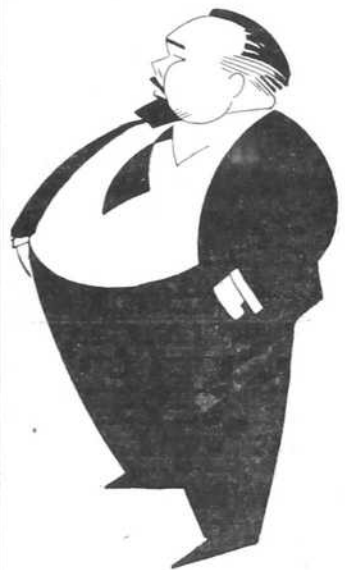
Несуђени „Плацкомандант“ Берлина (Цртеж: Б. Јанковић)