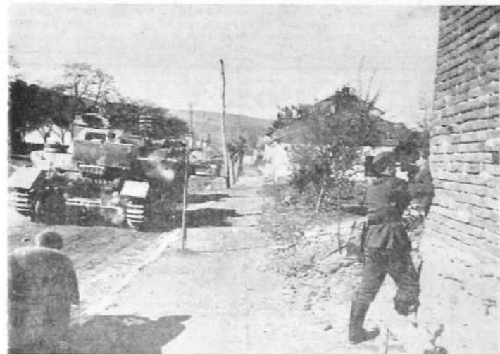
ТЕШКА БОРНА КОЛА, ЧЕЛО КОЛОНЕ, УНИШТАВАЈУ ОТПОР, ДА БИ ЈЕДНОЈ БРДСКОЈ ДИВИЗИЈИ ОМОГУЋИЛА НАПРЕДОВАЊЕ. ФИЛМСКИ ОПЕРАТЕР СНИМА У СМРТНОЈ ОПАСНОСТИ ЗА НЕДЕЉНИ ЖУРНАЛ