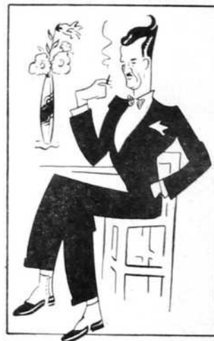
Човек који има уверење масонске ложе — да није масон! (Цртеж: Ђ. Јанковић)