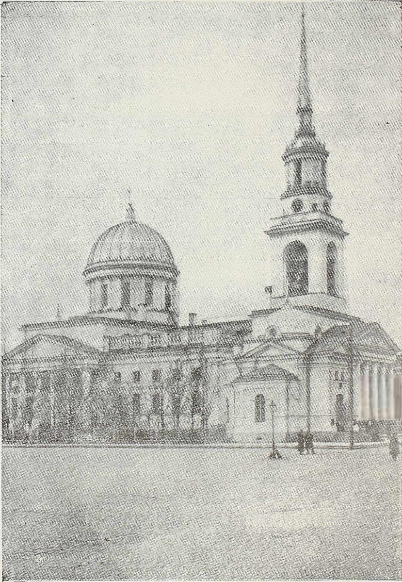
Андревский Соборъ въ Кронштадтѣ.