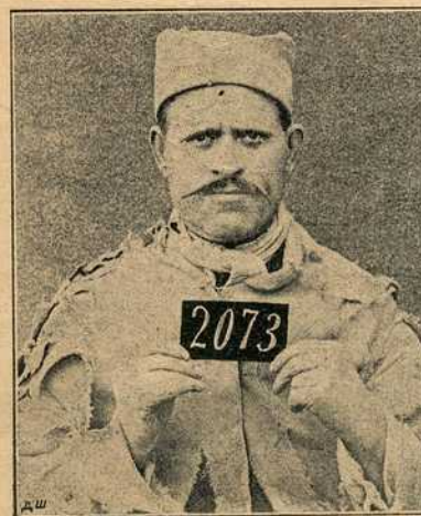
4074. или Управи града Београда на Бр. 15.849.