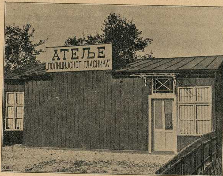
Види опис на стр. 286.

Ти знаци су интернационални и задатак им је да с по-моћу њих лопови један другог налазе и познаду.