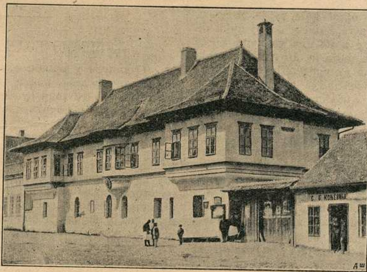
Начелство окр. подринског у Шапцу (види опис на стр. 342.)

У колико је значајна вештина, с којом се Циганин увлачи у кућу, још је значајније то, како он мудро спреми повратак и осигура се против сваког напада. Он помишља на бегство као и сваки други препредени лопов, само што њему поред