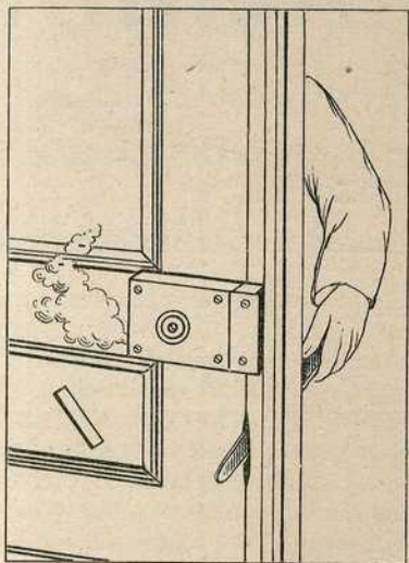
Сл. 1. — Бланшеова брава на цуцан.

Што се уопште може замерати овим извештачким справама, то је што оне изискују посебан надзор и непрекидно одр-