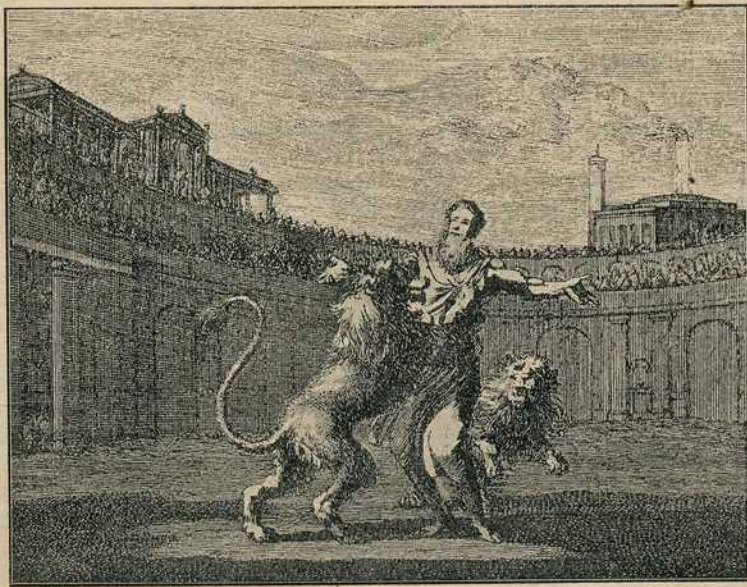
Сл. 6. — Убијање животињама.

Пошто је најужаснија сврепства чинио човек човеку, природно је да су и они који су вршили бестијалне пресуде, изметнули се најпосле и сами у дивље животиње. Отуда је природно и потекла мисао да казну извршују саме дивље животиње. Отуд је прастари обичај да се животињама даје да