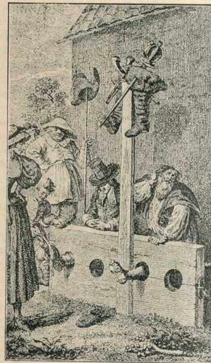
Сл. 40. — Углављивање у пањ.

Узроци због којих су осуђивани на галије били су различни. Први је узрок био што је тешко било наћи радника за мучни посао веслати, те су, једва чекали да нађу јевтине веслаче. У Италији су богохулнике осуђивали на галије.