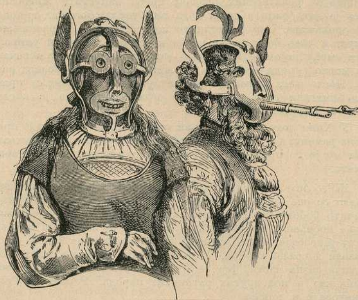
Слика 35. — Срамне маске.

Таква је иста казна била и срамна маска, коју су обично правили од гвожђа, и на којој су били насликани ђаволи, начињени дуги кљунови и т. д. Све су то биле срамне казне, али се морају убројати у телесне казне, али као најлакше. Све су те казне цветале нарочито у 16 столећу, али су се у неколико одржале и до 19. столећа.