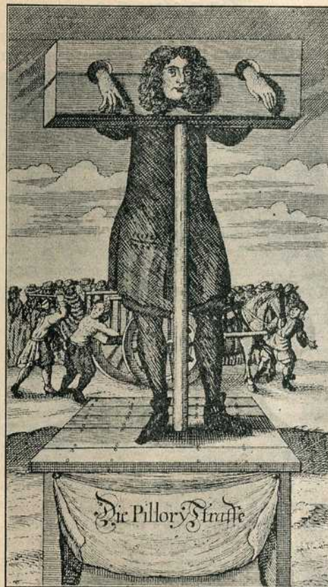
Сл. 36. — Прање у Енглеској

У другим крајевима била је за племиће, па и за кнежеве друга слична казна, још раније у обичају, а то је да су кажњени носили не псе него седло да би тиме изразили понижење и потчињеност. Тај обичај као да је поглавито владао у Нормандији и у старој француској, с тога се тамо никад није ни знало