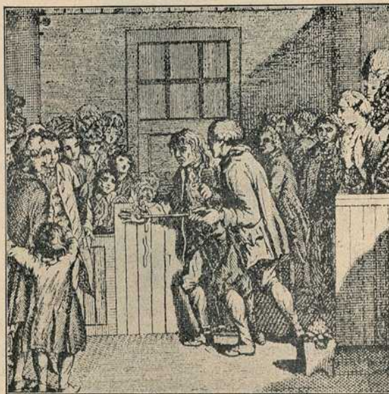
Сл. 38. — Жигосање у руку

Кад је први пут жигосање примењено као казно средство тешко је одредити; свакојако оно је било познато у Риму као казна још у доба Цицероново, и поглавито се примењивало на допове и клеветнике. А то је имало логичких оправдања, јер су баш допови и клеветници такве личности које подмукло врше своја кажњива дела, и који су у велико нешкодљиви кад се на