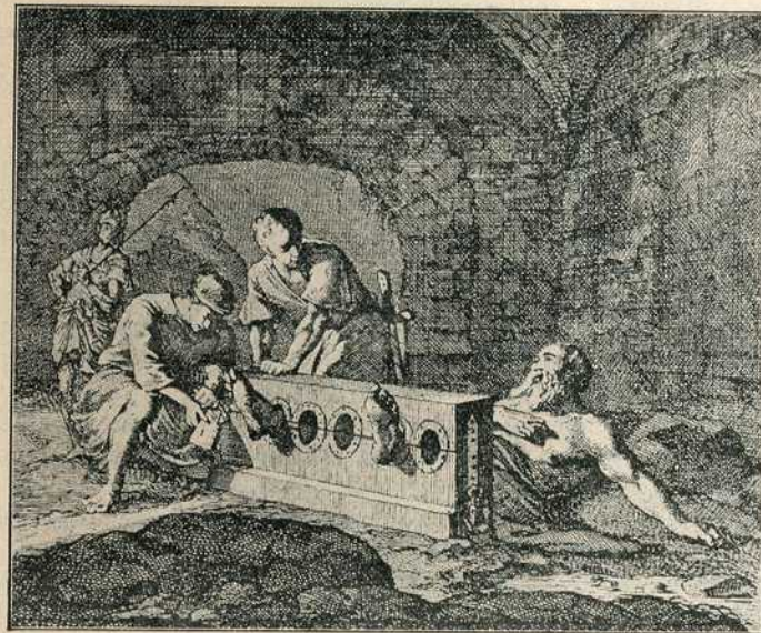
Сл. 41. — Окивање у пању.

Казна галија била је позната још и старим Римљанима, којима је у њиховим ратним походима требало доста веслача. Ту казну су називали Римљани poena triremium . Али се ту са осуђенима није тако нечовечно поступало, него је осуда била више рад за казну и кажњени су радили заједно са добровољним и плаћеним веслачима. Преступи због којих су у Риму осуђивали на галије, нису морали бити велики. Цар Август једног човека који је се издавао за природног сина цареве сестре Октавије, казнио га је за ту клевету тим што га је послао на галије.