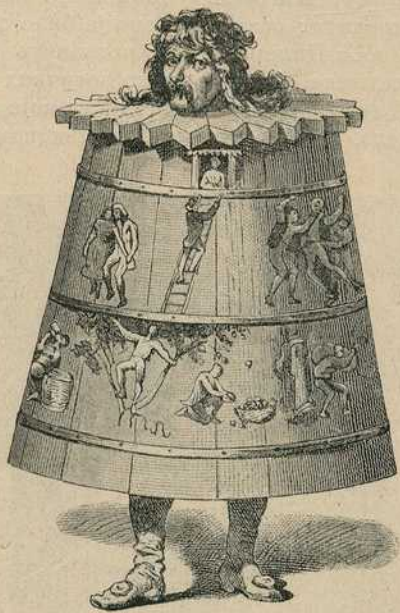
Слика 34. — Лажни огртач.

био изложен. Обично су на огртачу била насликана дела због којих је преступник морао да га носи. Нарочити телесни болови нису били спојени с том казном, ако се не рачунају болови од притиска тог тешког и тврдог огртача.