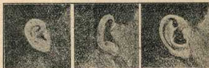
Слика 3. а.

2. Меко месо на доњем крају ушне шкољке: а) његова форма, и б) величина.