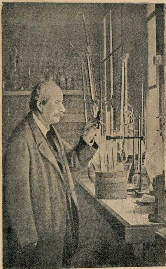
Бертло (Berthelot), рођен 1827.

Други његов принцип гласи, да количина топлоте, која се развија при некој реакцији, зависи од завршнога стања, без обзира на пут којим се дошло до тога резултата . Кад се угљеник при сагоревању најпре претвори у угљенов монооксид ( \text{CO} ), а потом у угљенов диоксид ( \text{CO}_2 ), исти је резултат, као кад би се одмах извршило потпуно сагоревање, како и бива при обичном сагоревању дрва на огњишту. — То је Хесов закон, који се може с коришћу употребити за из-