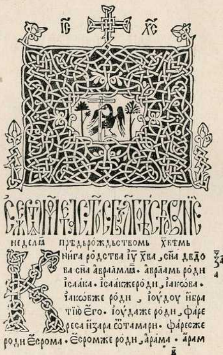
Четворојеванђеље (Београд, 1552)