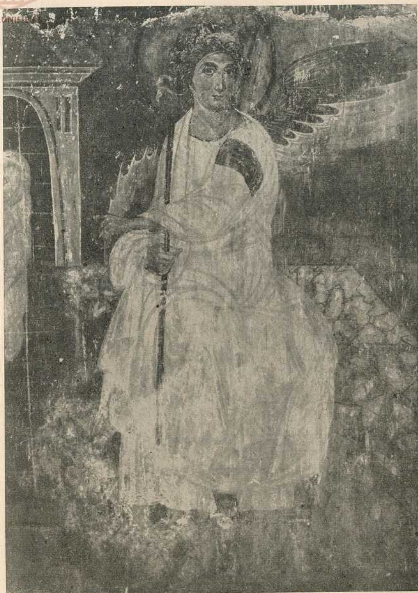
Анђео Васкрсења у Милешеву (XIII век)

дице, приказују се на самртном одру, не би ли им душу прихватио Спаситељ, као у Успењу његове Мајке. У Дечанима, изнад улазних врата из припрате у главни брод, Стеван Дечански и Душан примају повељу од Серафима Божијег. Овај храм је дизан као завет, из захвалности за победу над непријатељем код Велбужда. Многи манастири постају као нека залога спаса и саме земље.