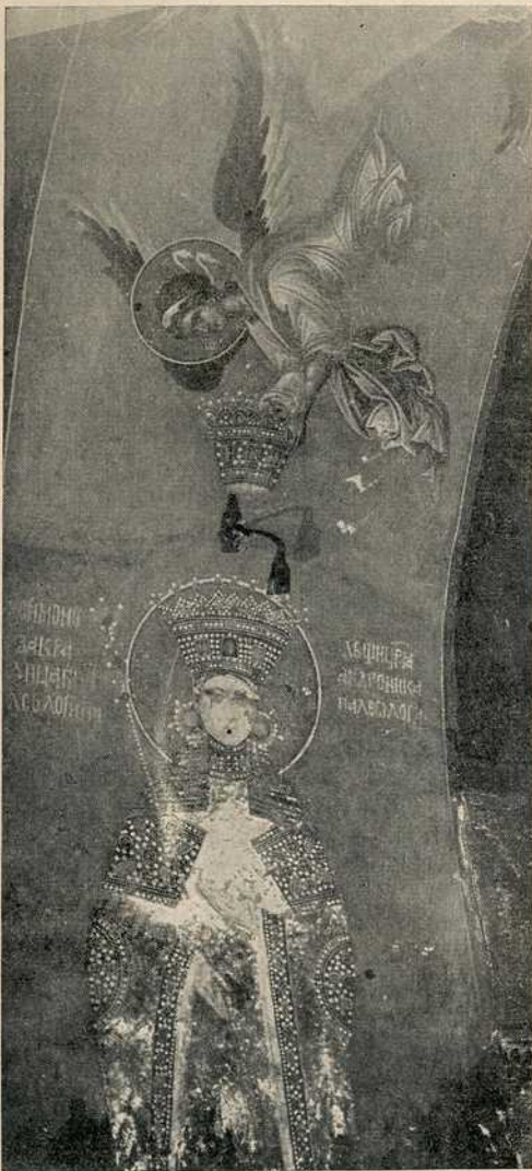
Краљица Симонида (Грачаница)

свештених лица и сликара монаха. Можда баш у тој монашкој основи лежи могућност обилажења, путовања. Као путујући мозаичисти, и све остале занатлије тога доба, путовали су и сликари. Еутихиос и Михаило потписали су се у Нагоричину и Св. Никити.