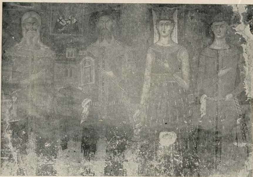
Ктигорска породица из Псаче (XIV век)

Из саме технике проистиче монументална упрошћеност и површинска дводимензионална стилска одлика, нарочито прве рашке школе. XIII век је уопште узев најправилније схватио и занат и стилски израз. Фреска је тада синтетички доживљај, симболичка пројекција, на зидном платну извесени чаробни ћилим. Тада је постигнуто једно нама својствено величанствено решење декорације унутрашњег простора. Велике зидне масе уоквирују вазду-