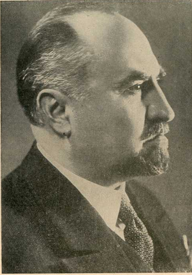
МИНИСТАР ПРОСВЕТЕ ВЕЛИБОР ЈОНИЋ

У Н И В Е Р З И Т Е Т С К А Б И Б Л И О Т Е К А